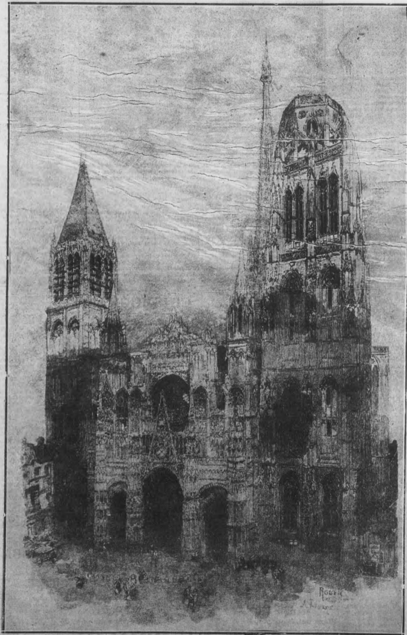
CATEDRALES DE FRANCIA.—Fachada de la catedral de Nuestra Señora, en Rouen, monumento gótico de lo más notable en ese estilo. Este grabado en madera, que se publicó en «L'Illustration» el 11 de julio de 1896, fué hecho por el ilustre artista francés Augusto Lepere.