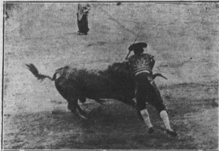
Valencia I entrando a matar al toro que cogió a su hermano.