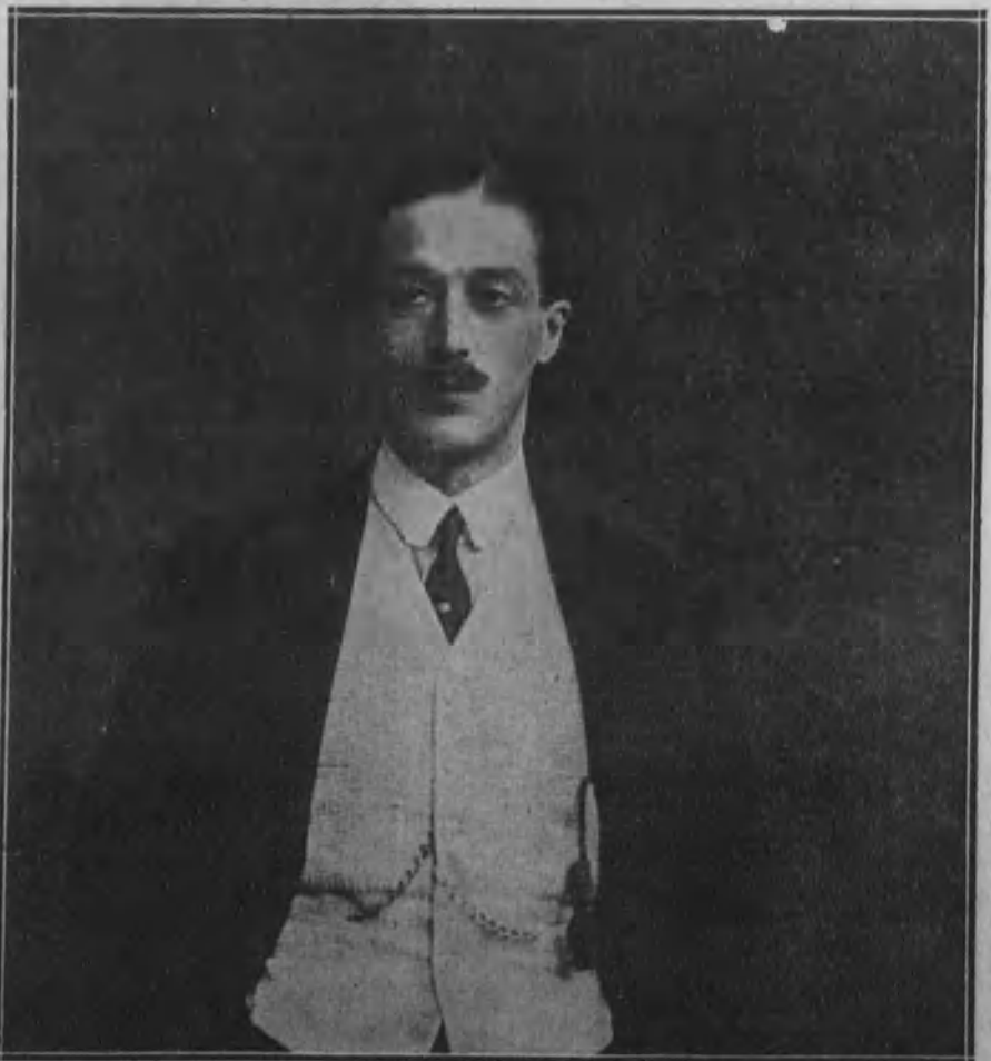
Excelentísimo señor duque de Berzovik y de Alba, D. Jacobo Stuart Fitz-James Falcó Portocarrero, nuevo académico electo de la de la Historia, cuya solemne recepción se verificará hoy, a las cuatro de la tarde.