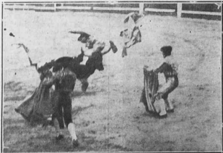
Cogida de Ventoldra durante la lidia de su toro.