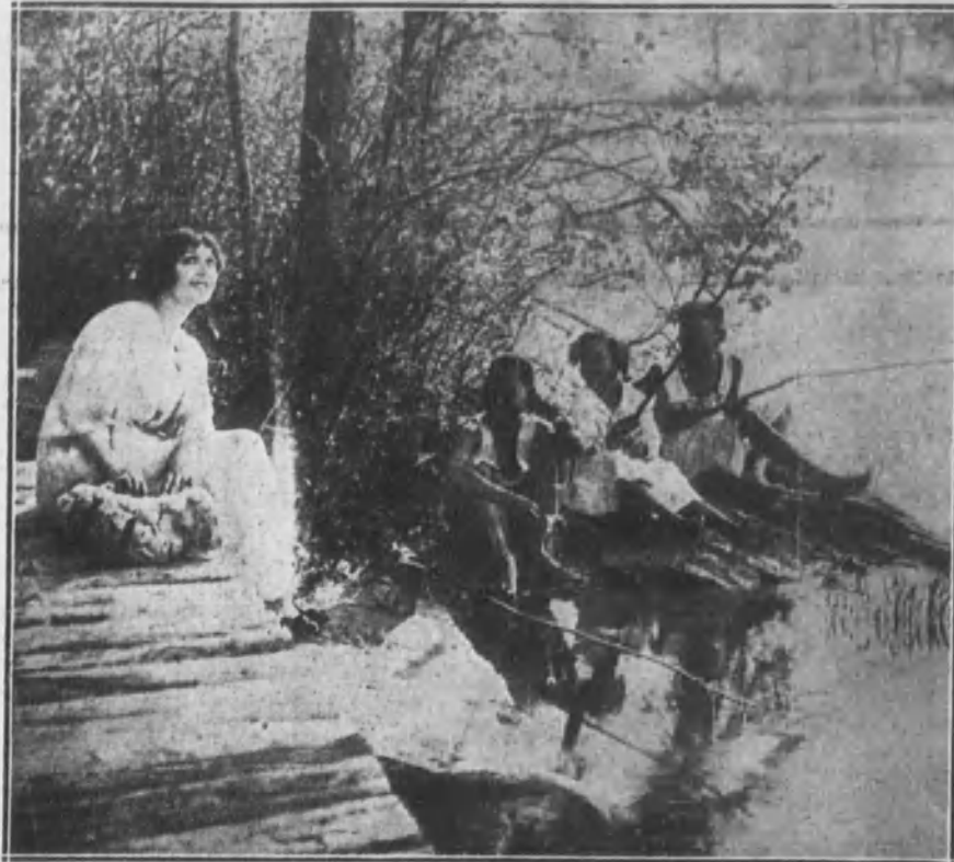
La gentil Lina Cavalieri en una delicada película, impresionada durante el otoño último. La célebre diva, que en la ópera tantos aplausos conquistó, dedica actualmente su tiempo a filmar otra cinta, en unión de su esposo, el gran tenor Muratore.