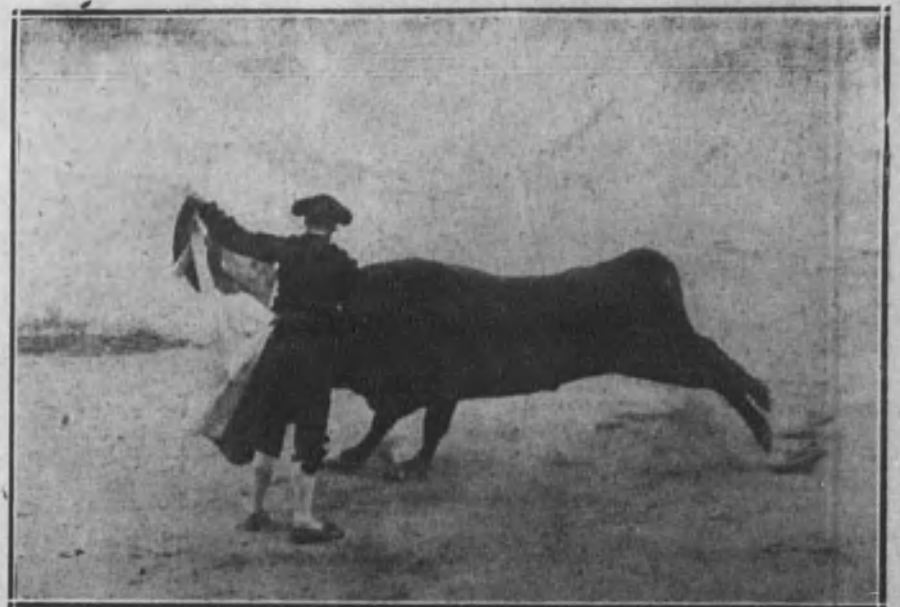
Saleri toreando de capa a su toro.