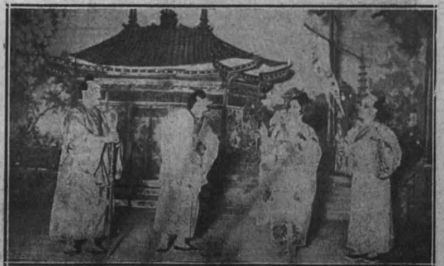
Una escena de la zarzuela «El capricho de una Reina», estrenada en el teatro de Apolo.