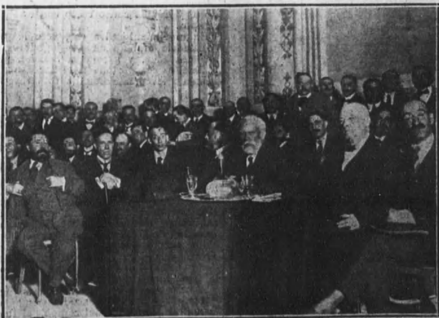
Mesa presidencial y oradores que han tomado parte en el mitin de las izquierdas, celebrado ayer mañana en el teatro del Centro.