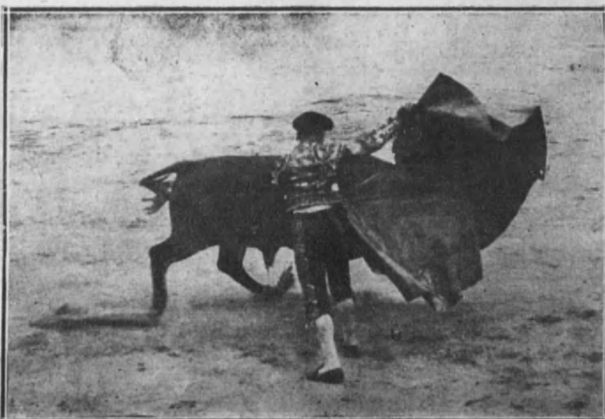
Fortuna toreando de capa a su toro.