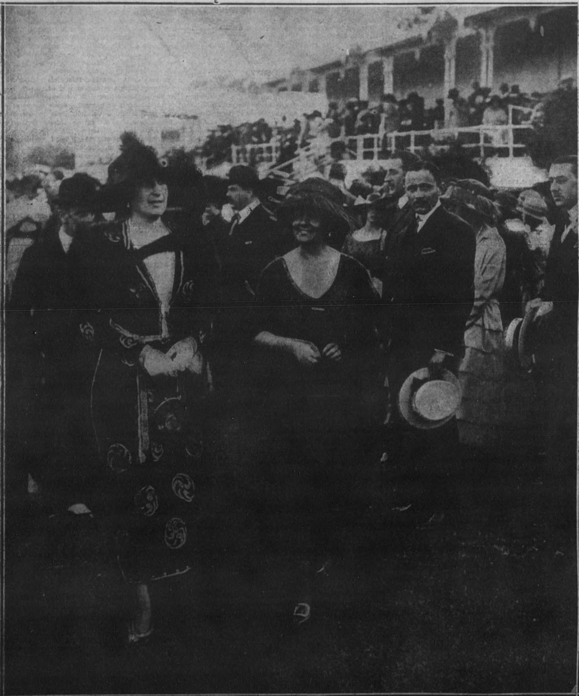
Su Majestad la Reina, con la duquesa de la Victoria, paseando por el "stand", durante las carreras celebradas ayer tarde en el Hipódromo.