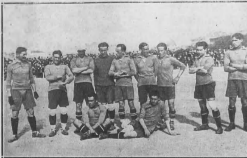
El equipo Arenas, de Bilbao, que ganó el partido final de campeonato.