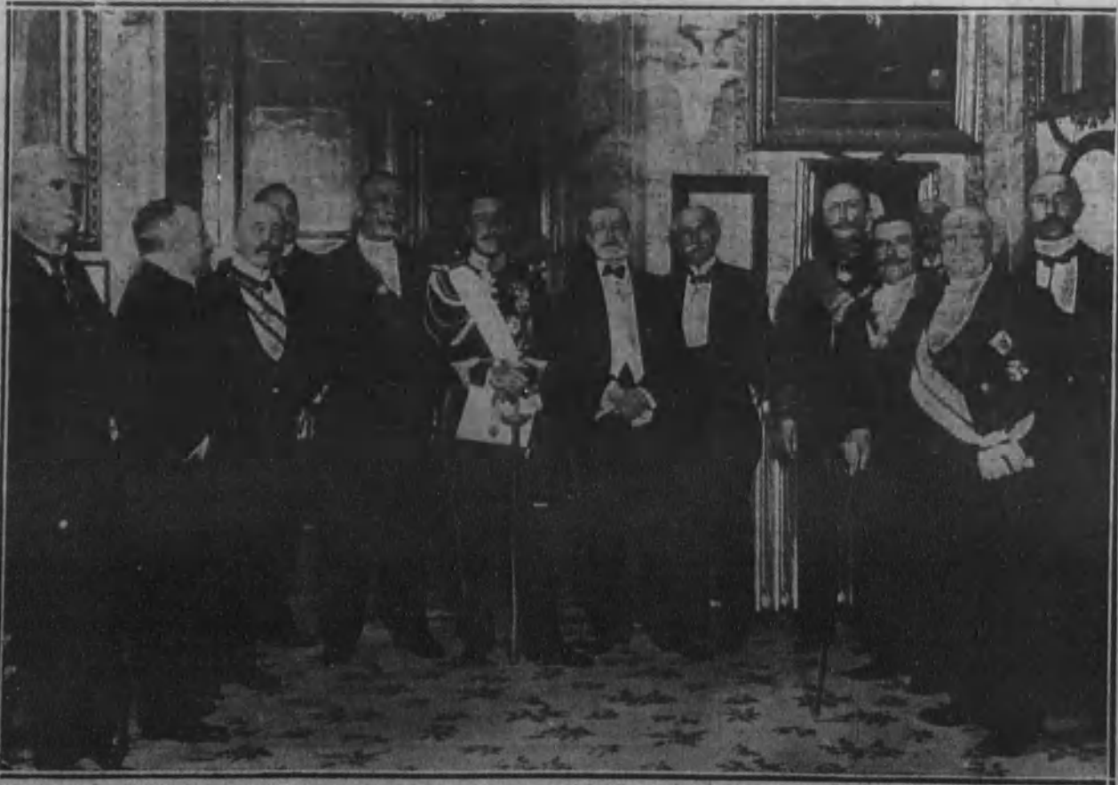
Acto de la toma de posesión del nuevo académico señor duque de Alba, celebrado ayer tarde.