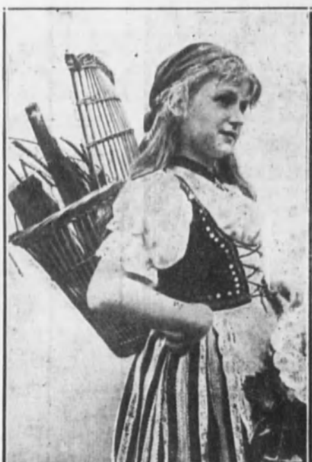
Niña con traje de campesina hamburguesa.