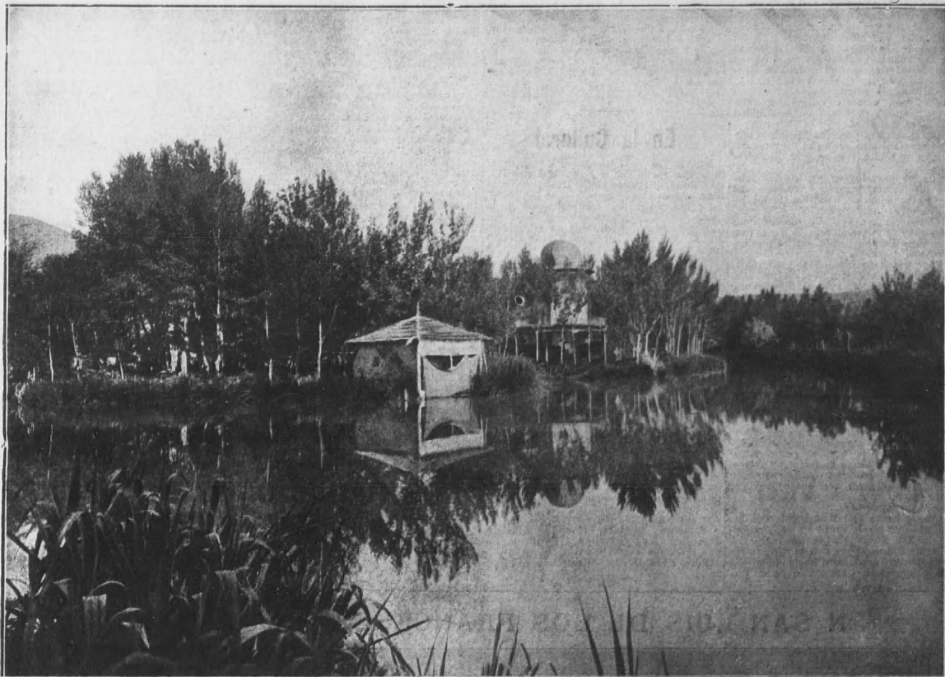
ALHAMA (Aragón).—Poética vista de las islas del lago.