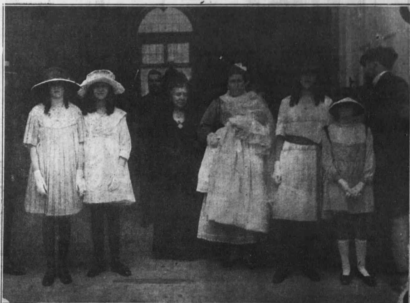
La hija de los duques de la Vega al salir de Palacio, en brazos de la nodriza, después de verificado su bautizo, celebrado en la Capilla Real, y en cuya ceremonia actuaron de padrinos Sus Majestades.