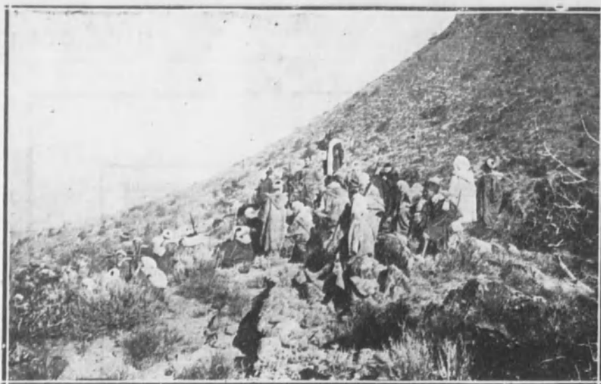
Harca amiga, que con la Policía indígena forma la vanguardia de nuestras fuerzas durante los avances.

Melilla.--Avance victorioso de nuestras tropas en Guenan