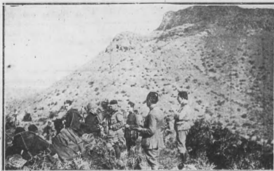
Vista de las cumbres del Uiel, ocupado por nuestras tropas en la madrugada del 21 de abril.