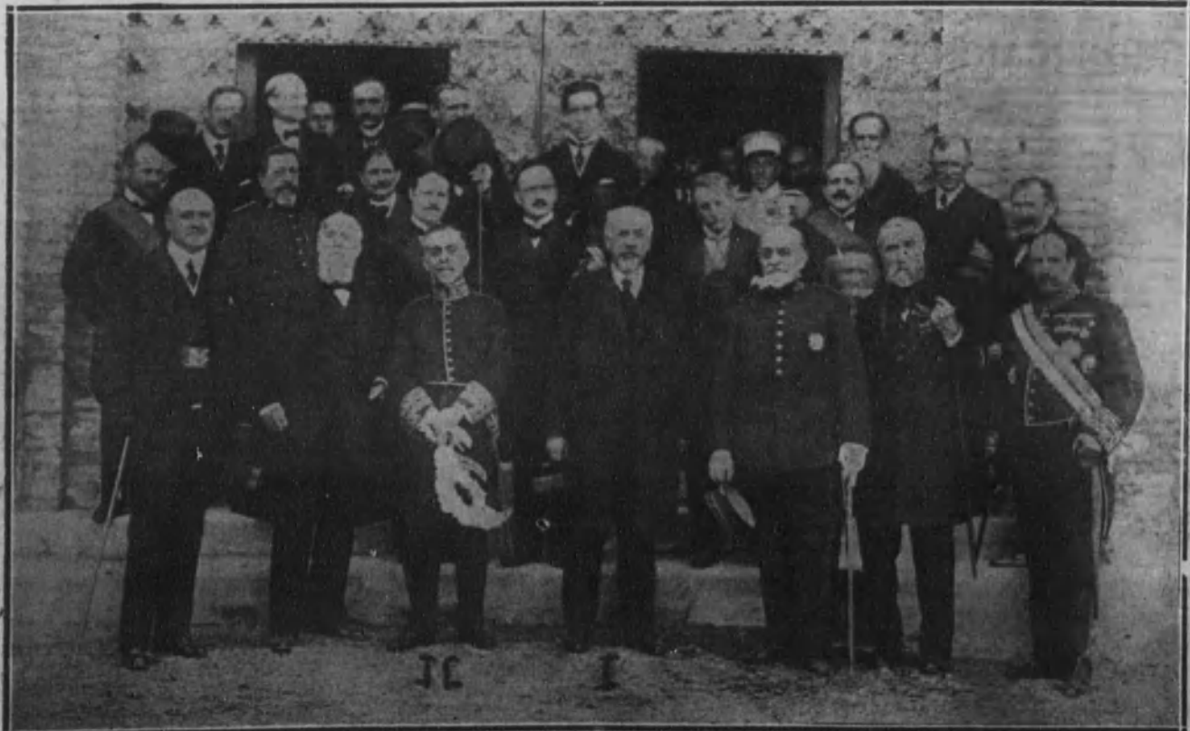
ZARAGOZA.—Los señores ministros de Bellas Artes de Francia, M. Lafferre (1), y de Instrucción pública de España, Sr. Silió (2), con las distinguidas personalidades que asistieron al solemne acto de la inauguración.