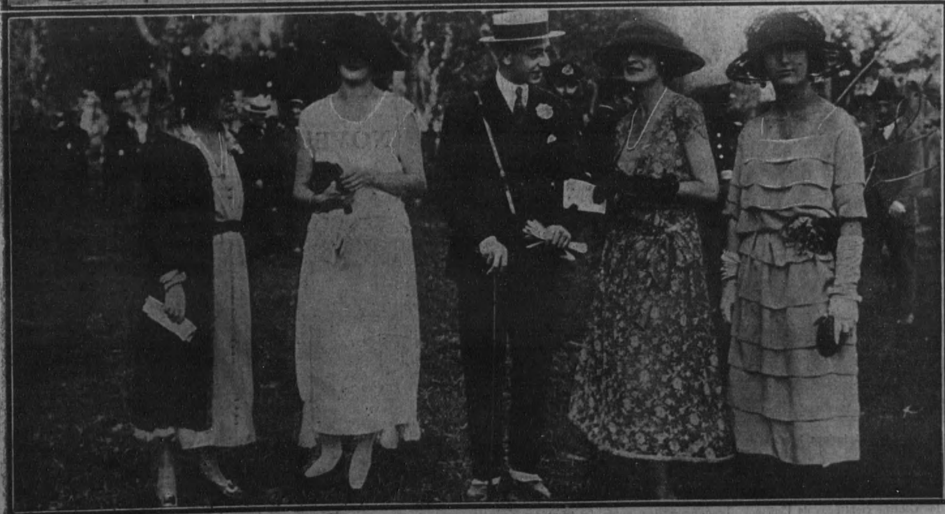
I. Aspecto de una tribuna durante las carreras efectuadas anteayer.—II. Aristócratas conversando en el "stand".