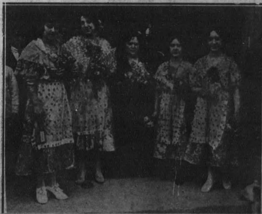
Señoritas que entregaban ramos y bombones a la entrada del teatro Apolo durante la función de la fiesta del Sainete.