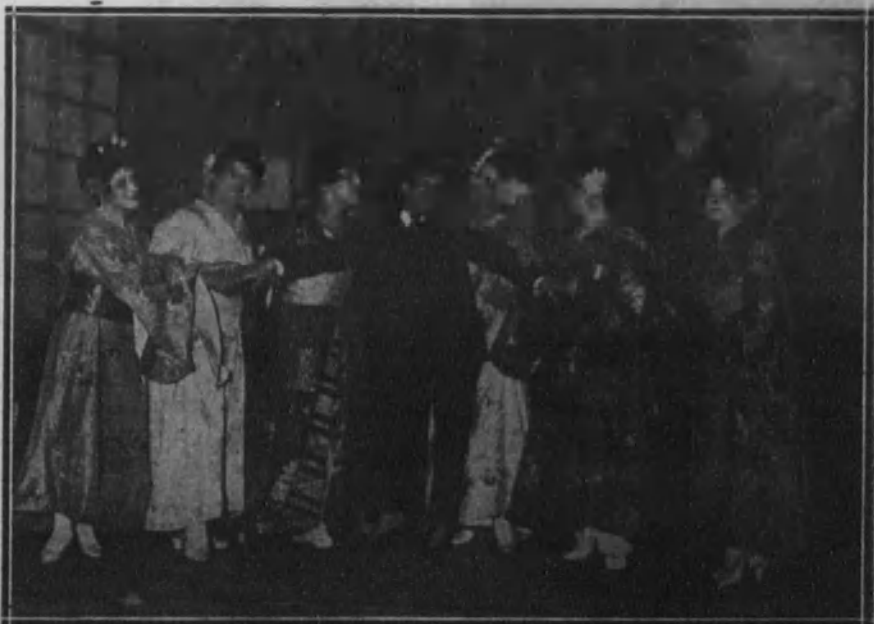
Una escena de la opereta «La princesa Zingana», estrenada en el teatro Español.