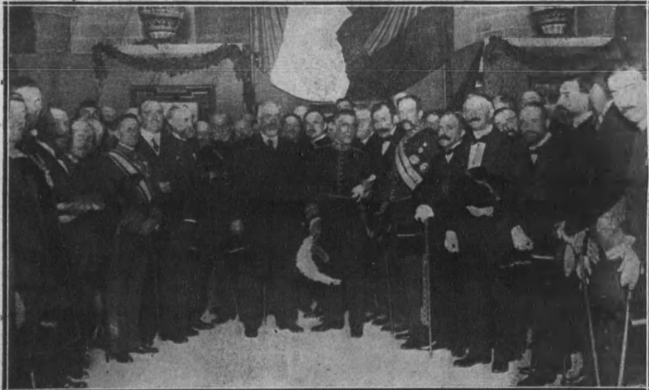
ZARAGOZA.—Acto inaugural de la gran Exposición de pintura y escultura en la Lonja, y a cuyo acto asistieron los ministros de Bellas Artes de Francia e Instrucción pública de España.