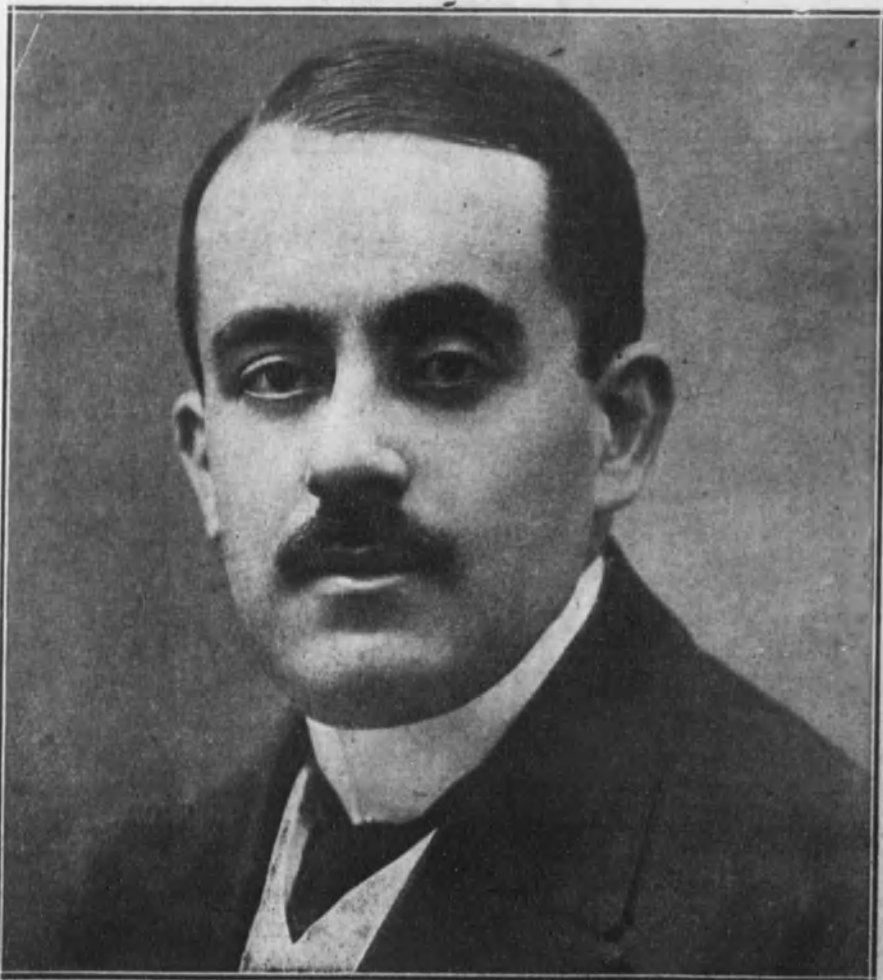
SEVILLA.—El insigne hombre de ciencia doctor Lecha-Marzo, fallecido recientemente.

Ha muerto en Sevilla el hombre sabio y bueno que se llamó Lecha-Marzo. La noticia ha causado impresión dolorosísima en todos los Centros científicos de España.