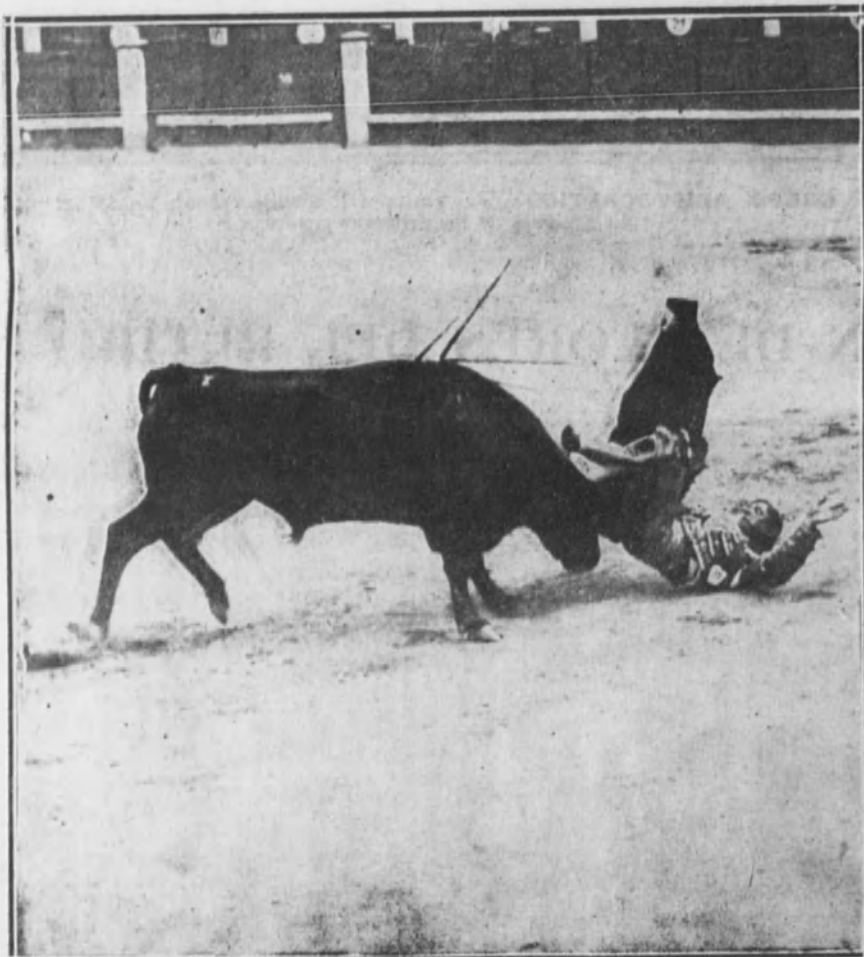
Cogida de Cocherito de Bilbao al entrar a matar.