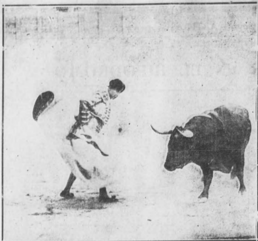
Gaona toreando de capa a su toro.