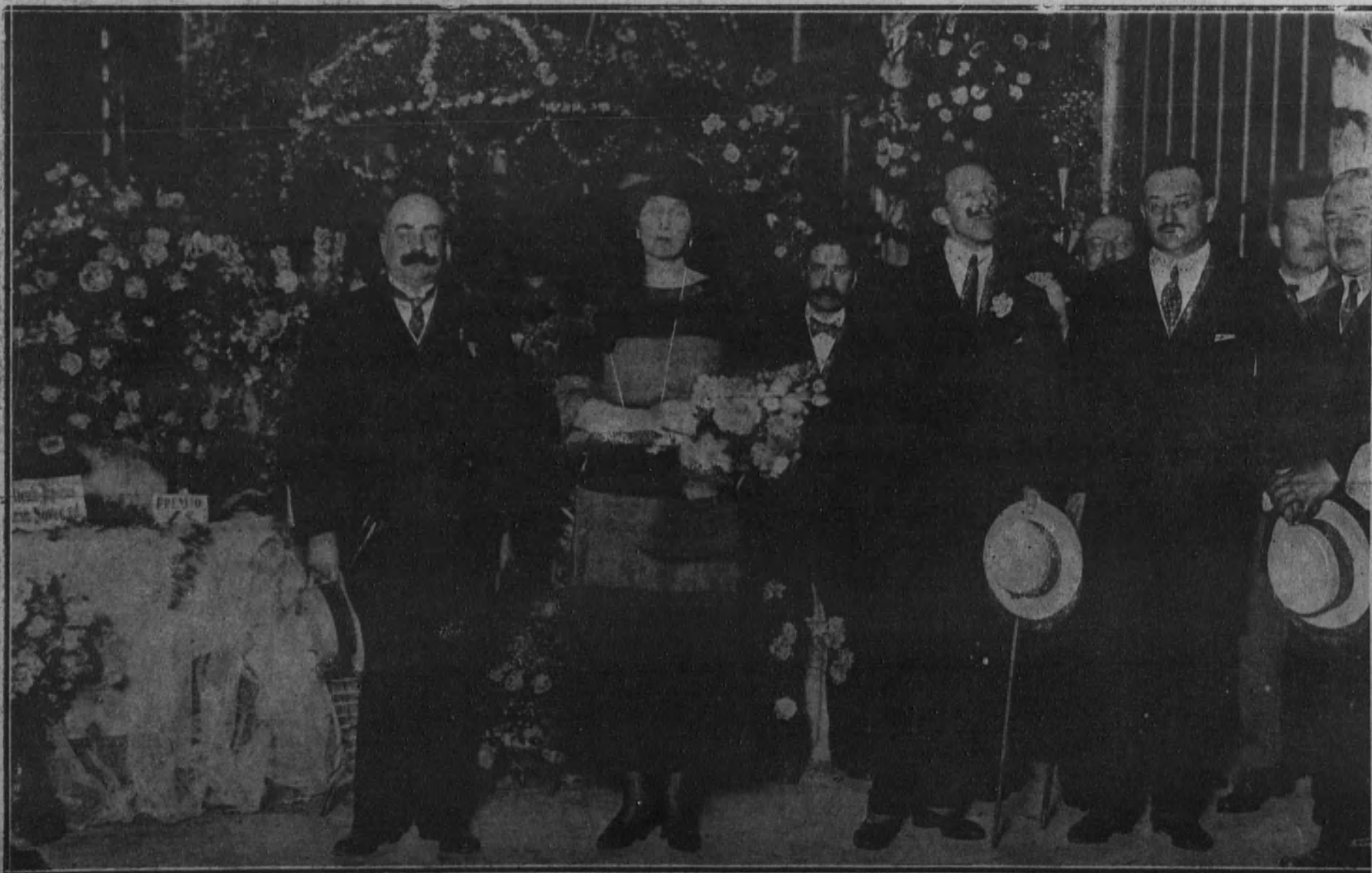
Sus Majestades los Reyes en la Exposición de flores, recientemente inaugurada en el Retiro, durante la visita que hicieron ayer tarde a dicha notable Exposición.