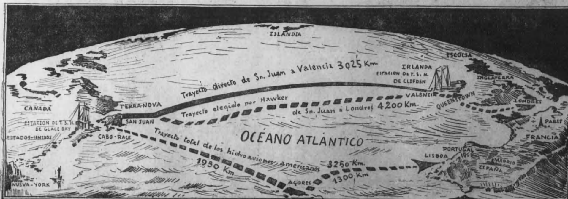
Gráfico comparativo, con el trazado de las trayectorias aéreas, que ha constituido el recorrido de los aviadores norteamericanos, y el que eligió el piloto australiano Hawker.