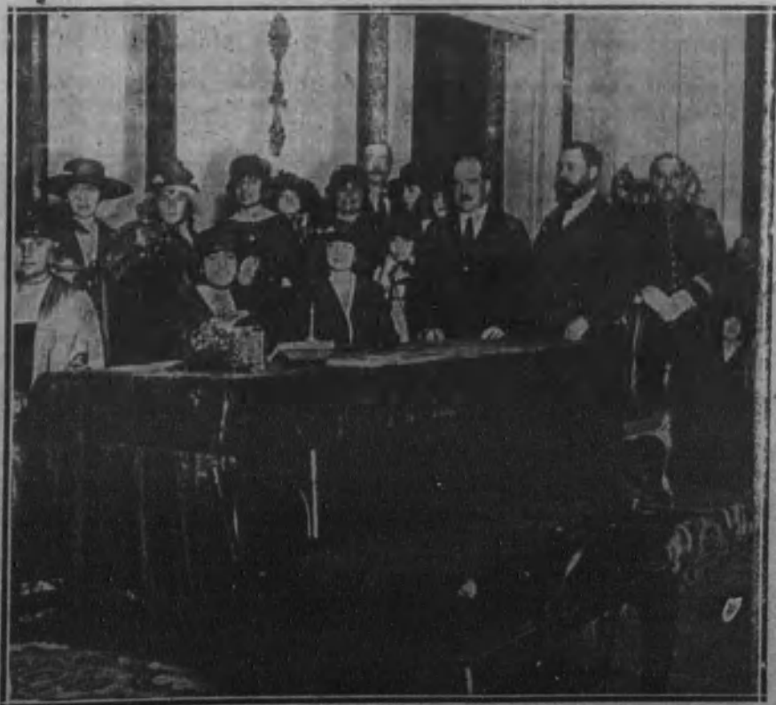
Recepción celebrada en honor de las señoritas auxiliares de la Cruz Roja, con asistencia de las autoridades municipales y representaciones corporativas.