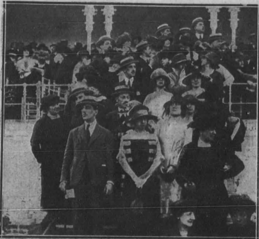
Aspecto de los palcos y tribunas del Hipódromo durante las carreras de ayer tarde.