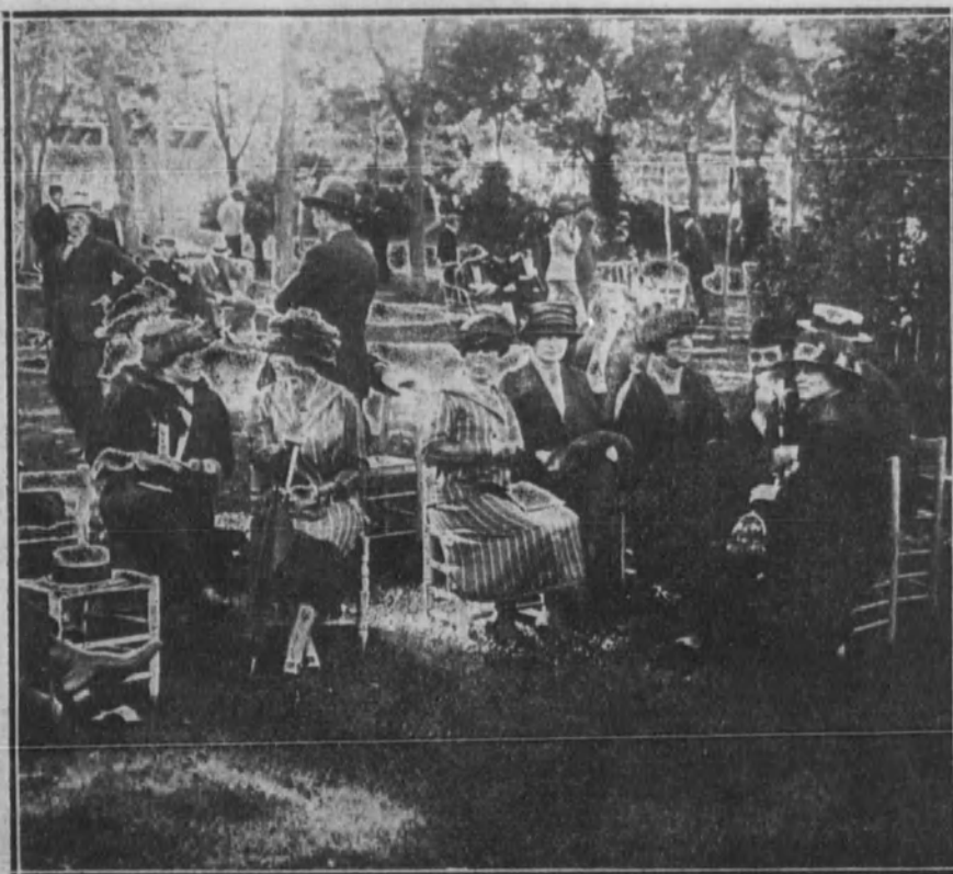
GRUPO ARISTOCRATICO.—Un rincón del «stand» durante un descanso, después de las primeras pruebas.