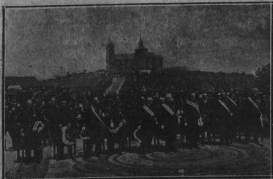
El Gobierno en pleno durante la solemne celebración de la misa, verificada al pie del monumento.