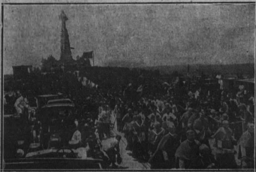
La procesión dirigiéndose a la ermita de los Angeles, al acabar la ceremonia religiosa.