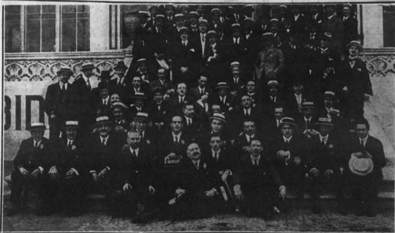
BARCELONA.—El personal de la sucursal del Banco de España en Barcelona, después del fraternal banquete que celebraron en el restaurante del Tibidabo.