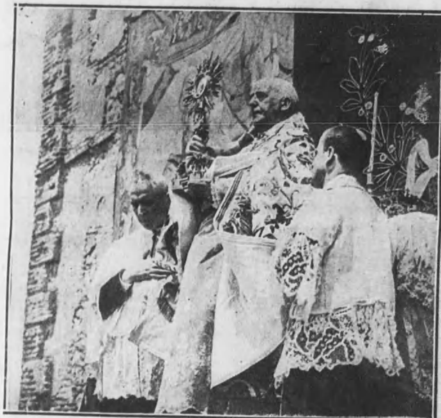
Solemne momento de exhibir la Sagrada Custodia, durante la ceremonia que siguió a la celebración de la misa.