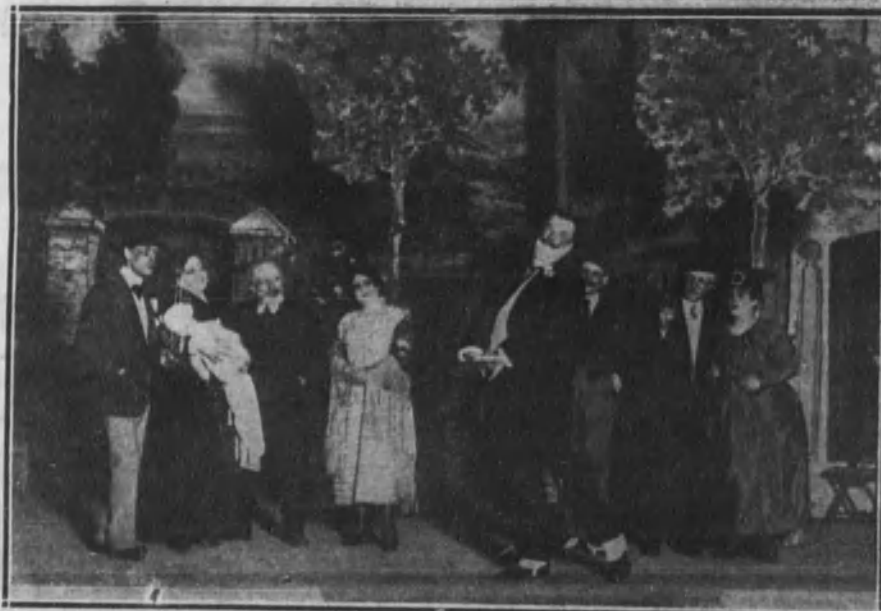
Una escena de la zarzuela titulada «La flor del barrio», que se ha estrenado en Apolo.