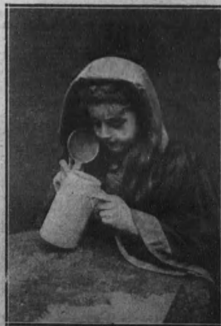
Niña hamburguesa con la típica capa de capuchón.