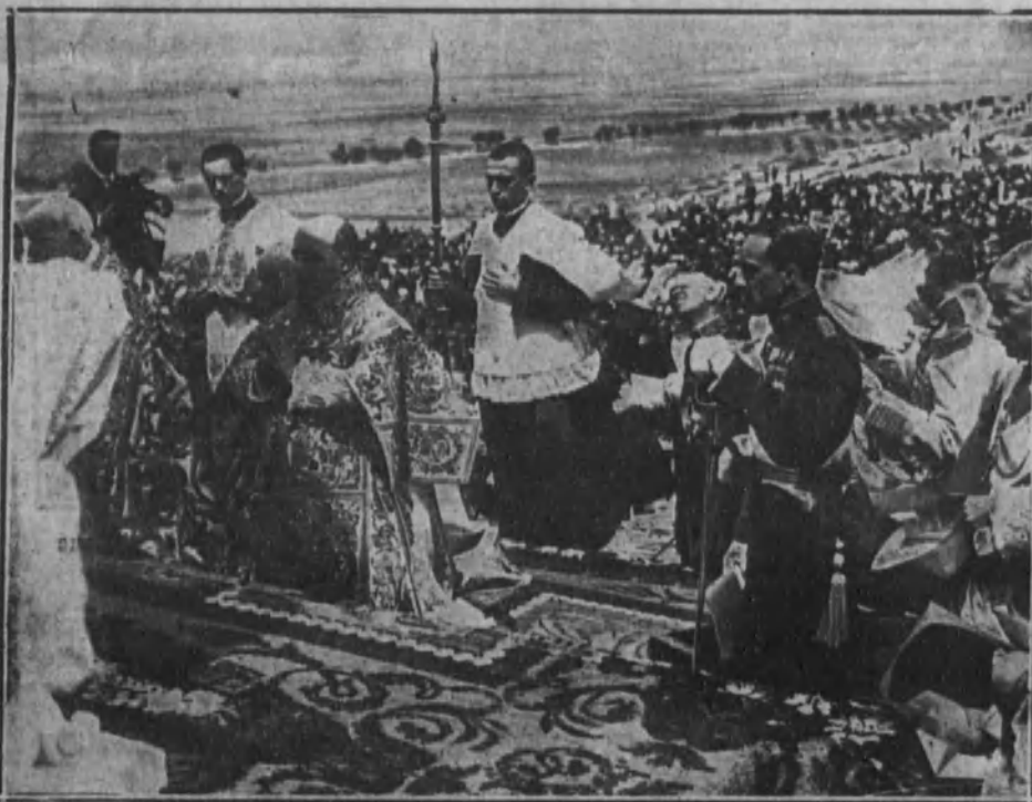
Su Majestad el Rey arrodillado en el momento de consagrar el acto con su bendición el obispo de Madrid-Alcalá.