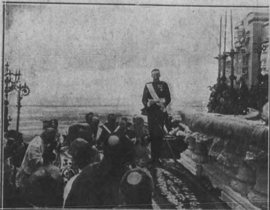
Su Majestad el Rey dando lectura al documento del acto de la consagración, inmediatamente después de celebrada la misa.