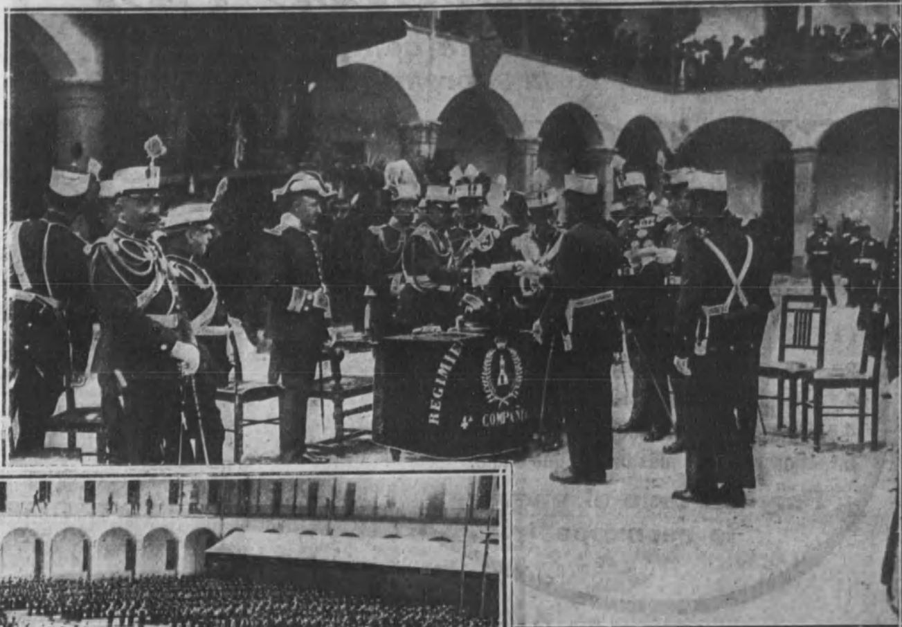
Reparto de premios en el patio del cuartel de la Montaña a los soldados que más se han distinguido por su comportamiento.

En el altar se elevaba una imagen de talla de San Fernando.