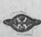
Núm. 1.964.—Brillantes y rosas. Ptas. 420