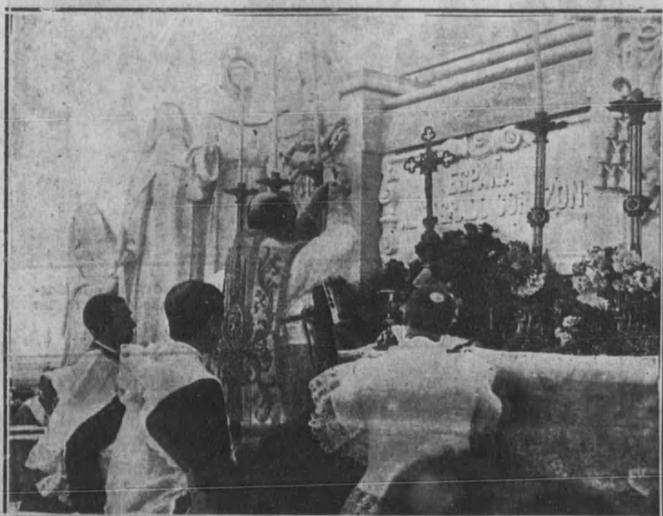
Momento de alzar la Sagrada Forma, durante la misa celebrada en el altar dispuesto al pie del monumento.