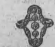
Núm. 2.165.—Cinco brillantes y rosas. Ptas. 415