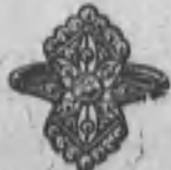
Núm. 2.187.—Brillantes y rosas. Ptas. 525