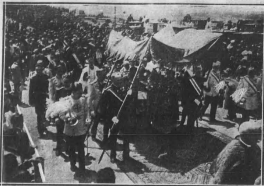
Sus Majestades los Reyes formando la escolta durante la procesión de la Custodia, conducida bajo el palio, que fué transportado y custodiado por grandes de España.