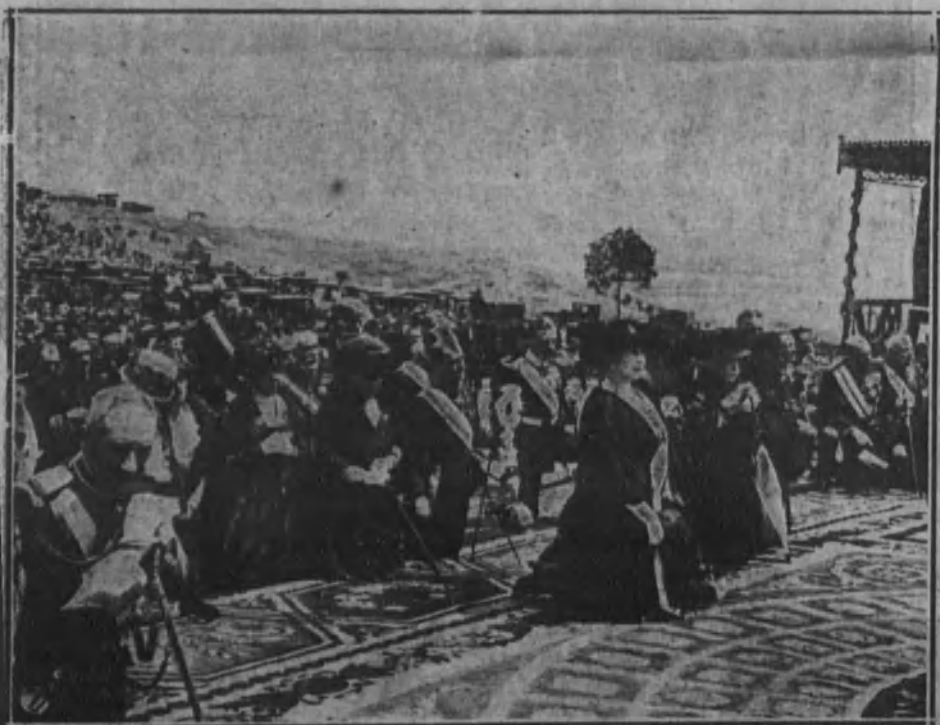
Sus Majestades las Reinas y Sus Altezas Reales los Infantes, oyendo la misa celebrada ante el monumento.