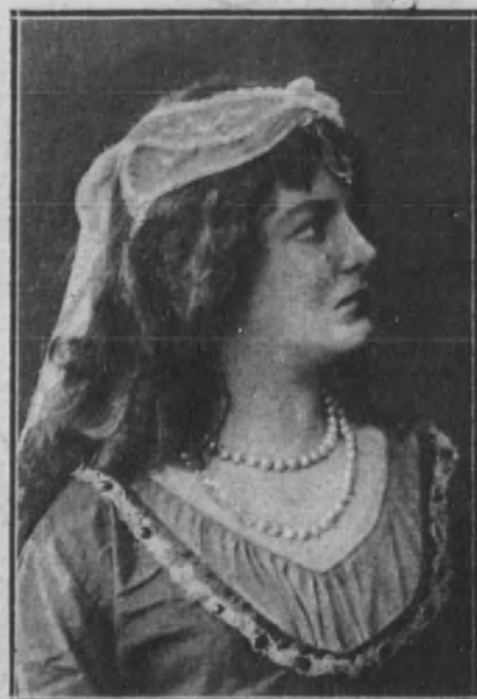
Joven luciendo un artístico tocado oriental.