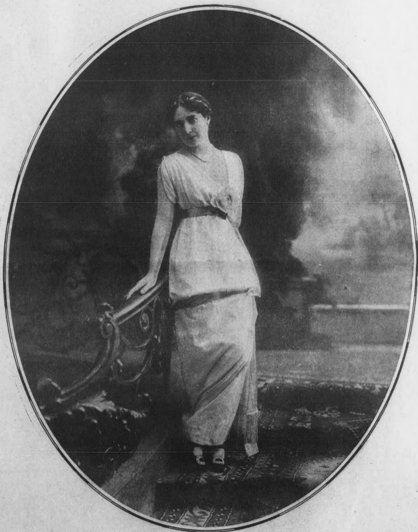
Elegante traje de recepción.