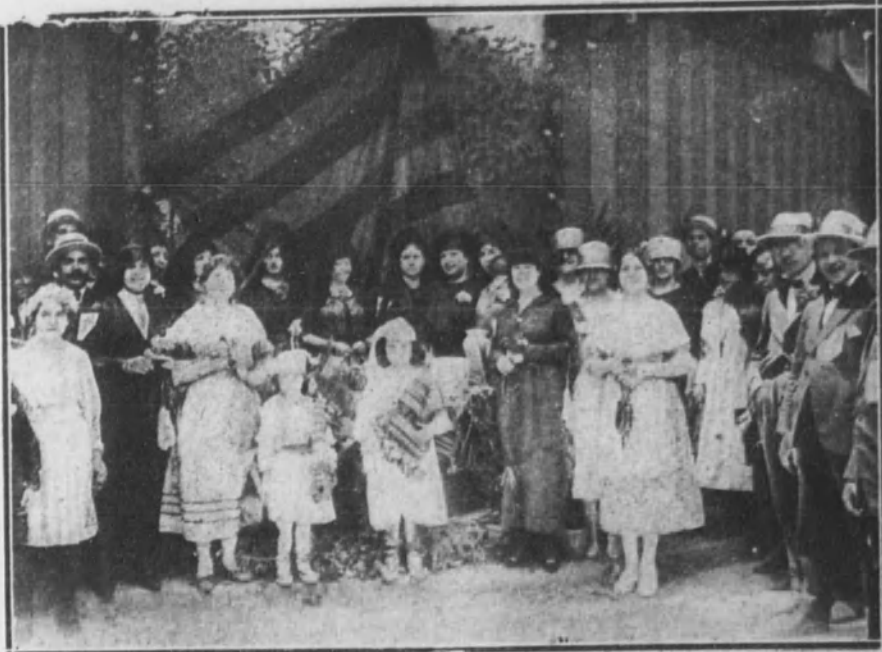
Grupo de distinguidas señoritas que postularon el día de la fiesta de la Flor en la capital aragonesa.