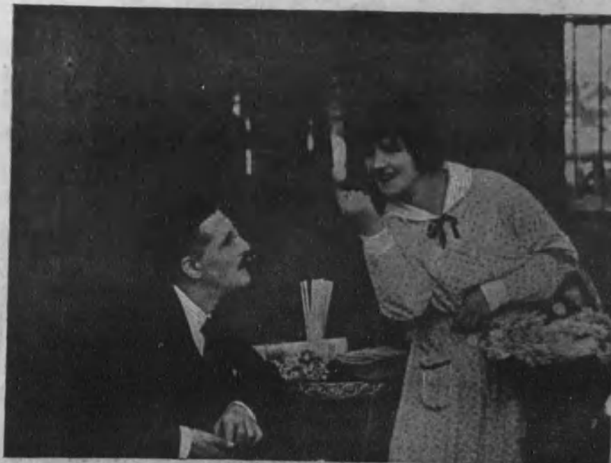
La deliciosa actriz francesa Susana Grandais en una escena de «Como en el cine».