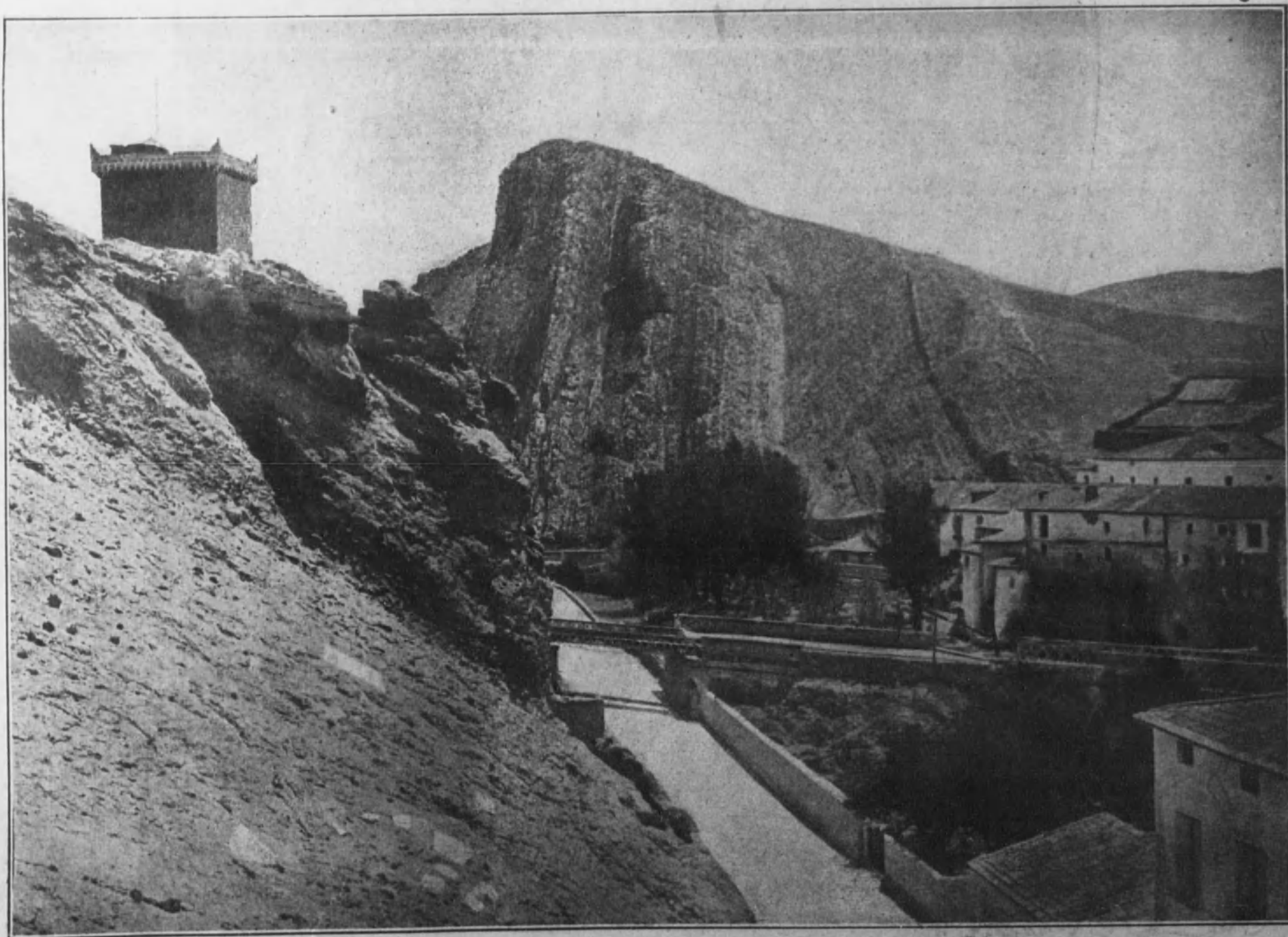
ARAGON.—Aspecto del agreste paisaje de los alrededores de Alhama, por la parte de la carretera. Vista tomada desde el lugar llamado «Casa de la Montaña».