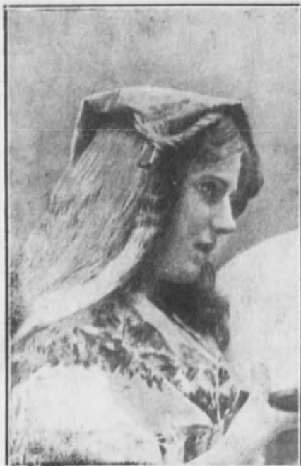
Niña con traje de campesina hamburguesa.