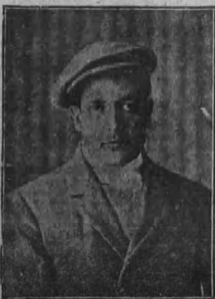
El hijo de «El Federal», que durante la desaparición de su padre ha trabajado en colaboración con la Policía para averiguar el paradero del rico traficante del Rastro.