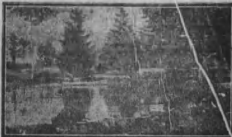
Detalle del Parque del GRAN ESTABLECIMIENTO BALNEARIO de ZALDIVAR (Vizcaya)

Aguas clorurado-sódicas-sulfurosas. De maravillosos resultados para el herpetismo , escrofulismo , reumatismo , estreñimiento crónico , etc. Lugar de verano de los mayores atractivos, situado a una hora de Bilbao y dos de San Sebastián, con estación de ferrocarril.