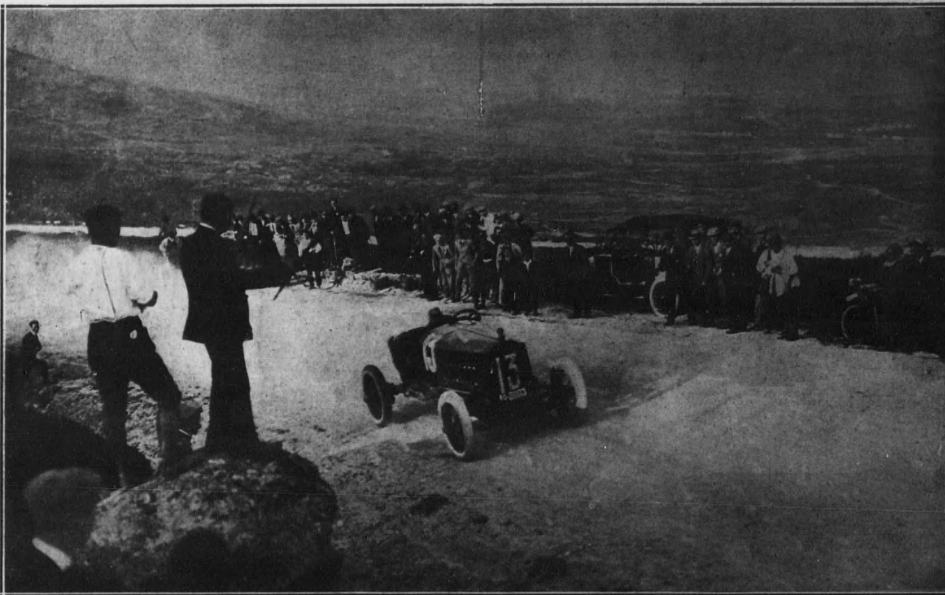
Llegada a la meta de uno de los corredores.