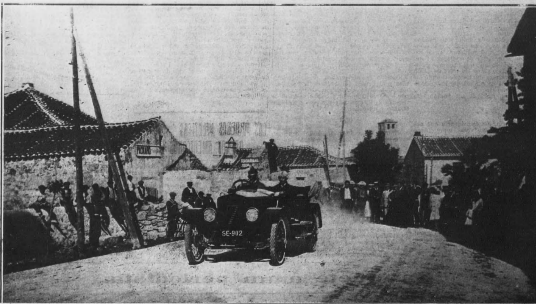
Salida de uno de los coches.

CARRERA DE AUTOMOVILES ORGANIZADA POR EL R. A. C. E. EN GUADARRAMA