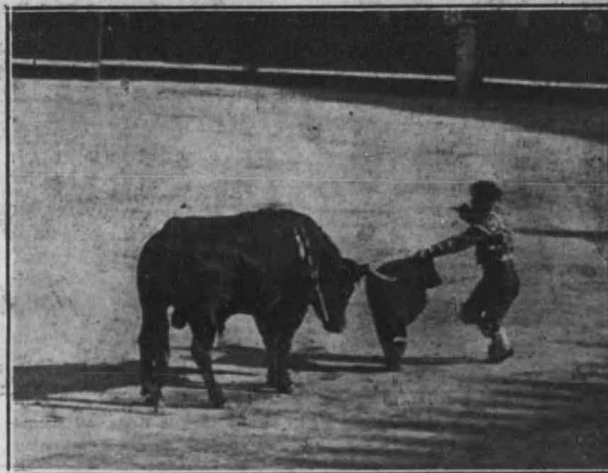
Belmontito entrando a matar a su toro.