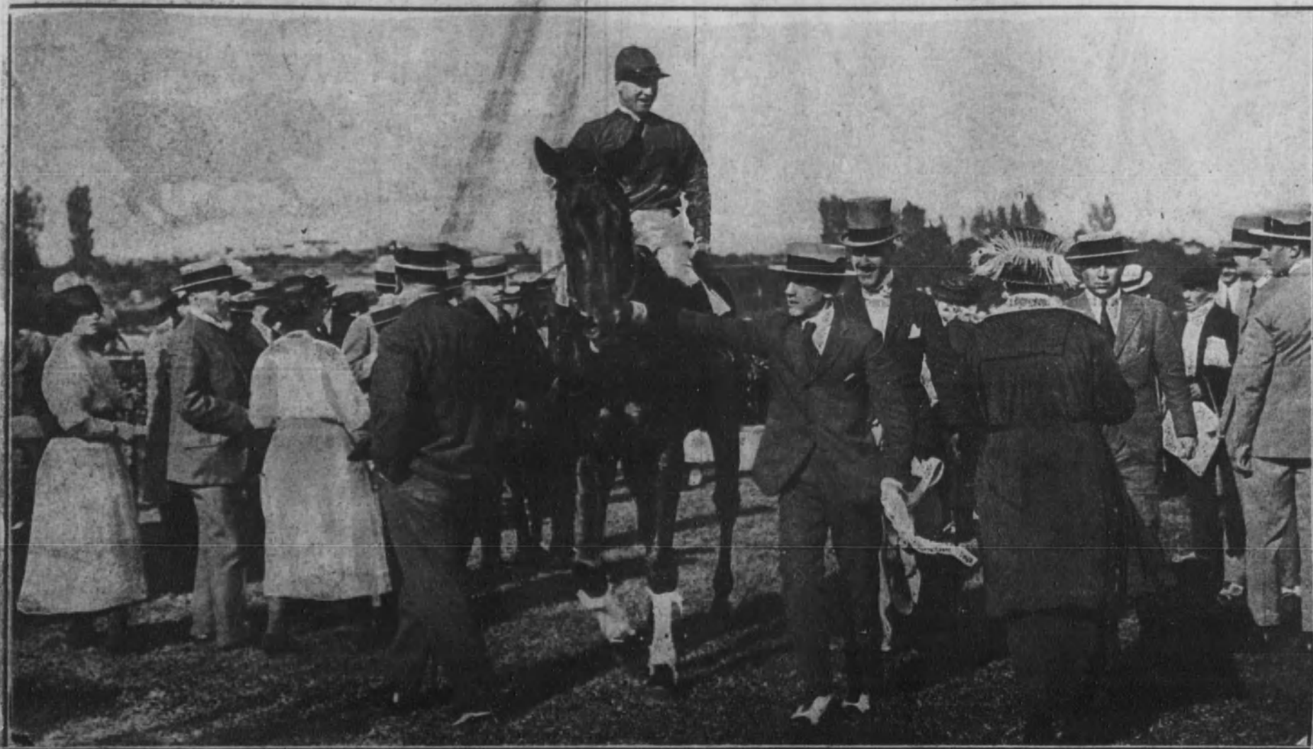
El caballo «Regalo Real», del marqués de San Miguel, ganador del «Gran premio» nacional.