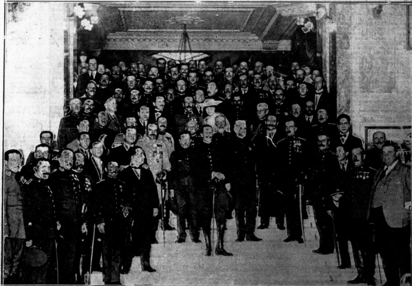
Banquete con que obsequiaron a S. M. el Rey los oficiales de la escala de reserva, en el Palace Hotel.