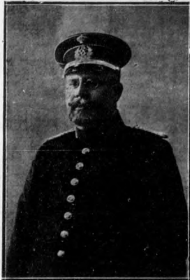
El comandante del Cuerpo de Seguridad, Sr. Salgado, que pronunció un notable discurso en el Palace Hotel ante Su Majestad el Rey.

La fiesta ha resultado brillantísima, y de ella pueden estar orgullosos sus organizadores.