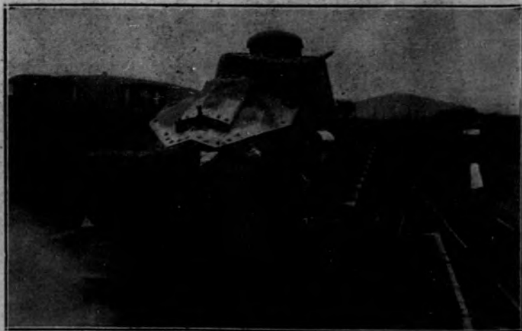
SAN SEBASTIAN (en la estación de Irún).—Tanque francés, de la Casa Renault, que ha sido regalado por dicha Casa a S. M. el Rey D. Alfonso, con destino al Museo de Artillería de Madrid.