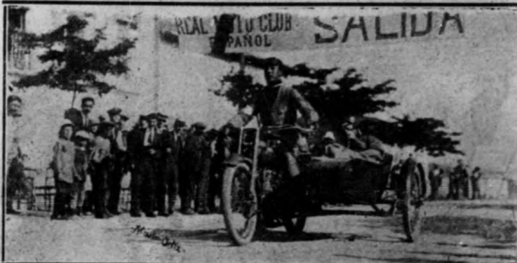
Un corredor de «moto» con «side-cars» al emprender la carrera, en el sitio de salida.