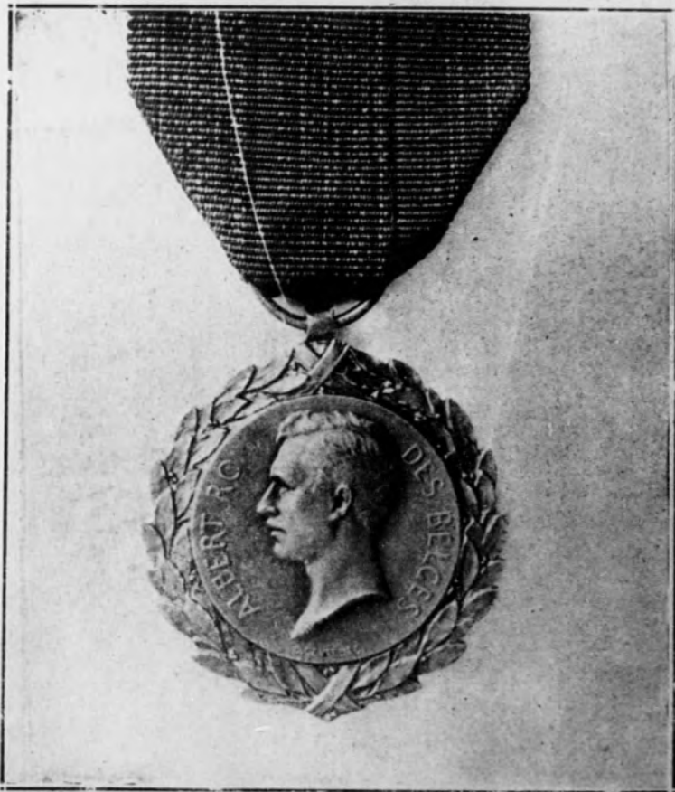
Primer ejemplar de la medalla creada en Bélgica para recompensar a los que durante la guerra se han dedicado a aliviar la suerte de los que por ella sufrían, ofrecido a S. M. el Rey de España por S. M. el Rey de los belgas con efusiva carta autógrafa.