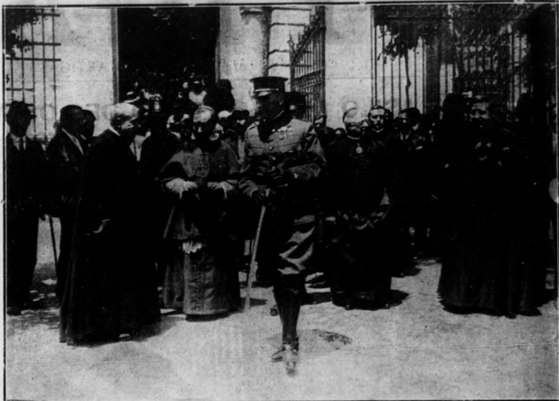
Su Alteza el Infante D. Carlos y el obispo de Madrid, Sr. Melo, saliendo de visitar el Asilo de San Pedro de los Naturales, para sacerdotes pobres, de la calle de San Bernardo.

Terminada la misa, se cantó un «Te Deum». El Rey visitó luego las principales dependencias del Asilo para sacerdotes, contiguo a la iglesia, y recibió, al salir, una cariñosa manifestación del público que se había congregado frente al templo, en la calle de San Bernardo.