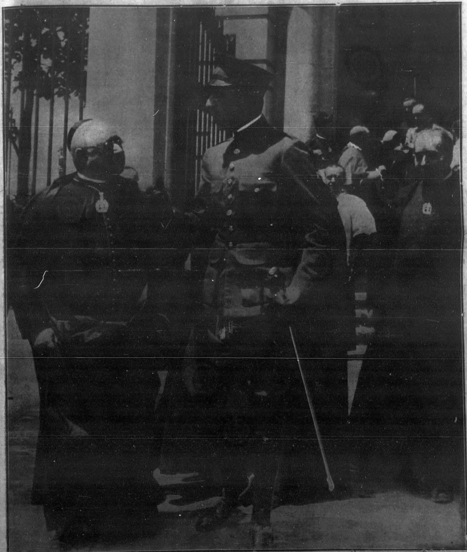
Su Majestad el Rey, al salir del Asilo de San Pedro de los Naturales (para sacerdotes pobres), después de la visita que ayer tarde hizo a este edificio, instalado en la calle de San Bernardo.

EN EL ASILO DE SAN PEDRO DE LOS NATURALES