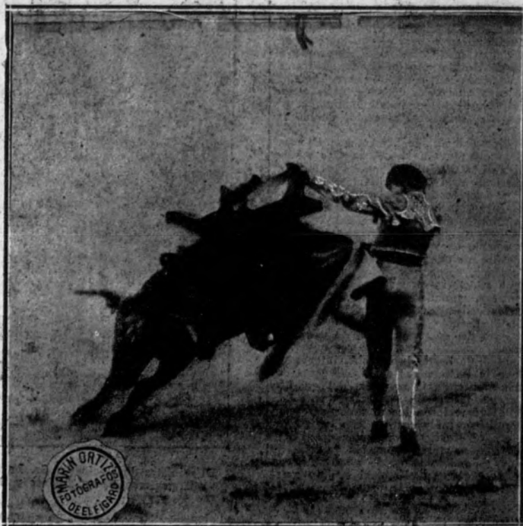
Belmonte toreando por verónicas a su toro.