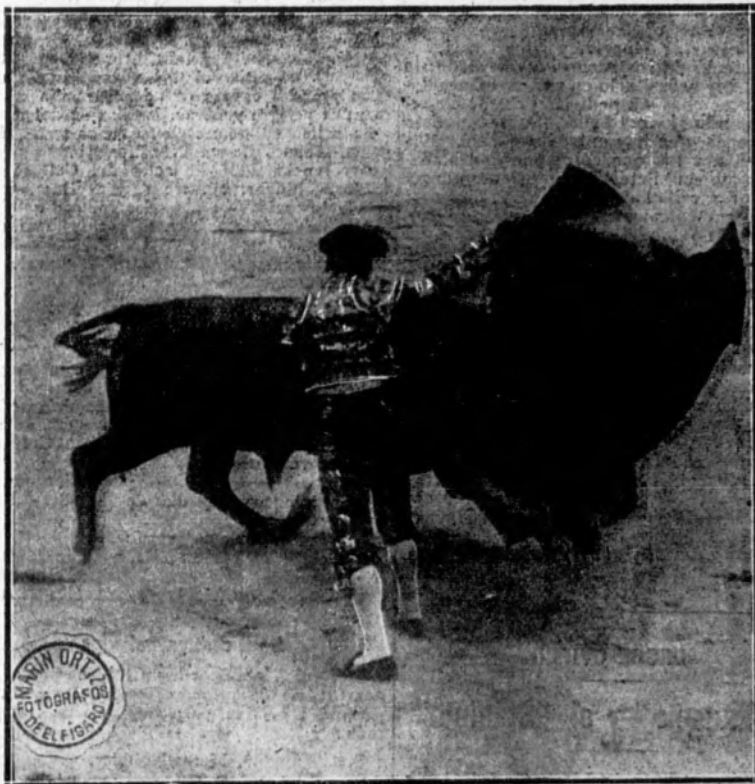
Fortuna toreando de capa a su toro.