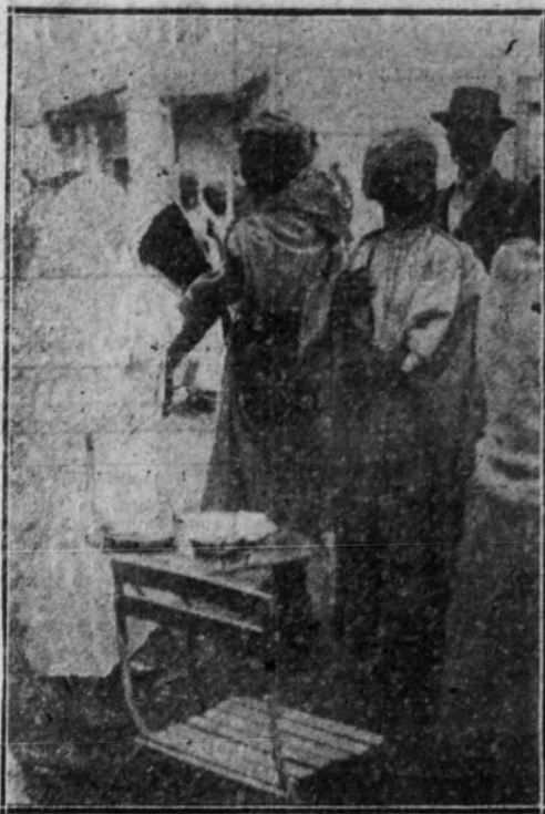
Como se vacuna en Casablanca

—Aquí, en Casablanca, los franceses han acabado poco menos con la fiebre y la viruela, pero para ello emplean procedimientos radicalísimos. Vamos a la