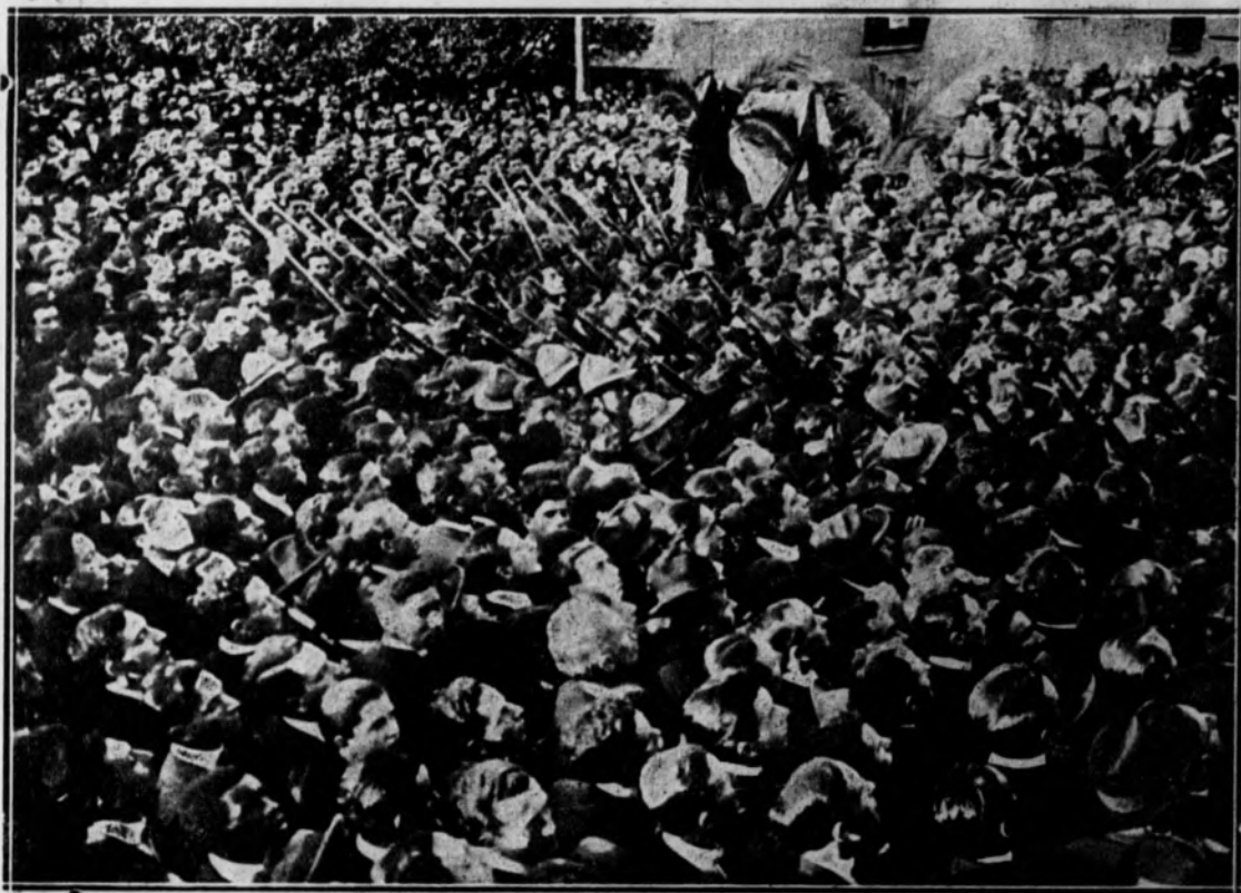
ENTIERRO DE LOS RESTOS DE AMADO NERVO.—Aspecto de la manifestación de duelo frente a la necrópolis.

Amé, fui amado, el sol acarició mi faz. Vida, nada me debes! Vida, estamos en paz!