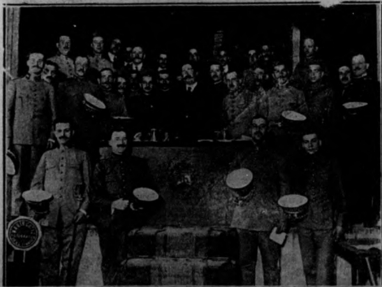
Grupo de los asistentes a la Asamblea celebrada en el Centro de Hijos de Madrid, por el Cuerpo de Prisioneros.