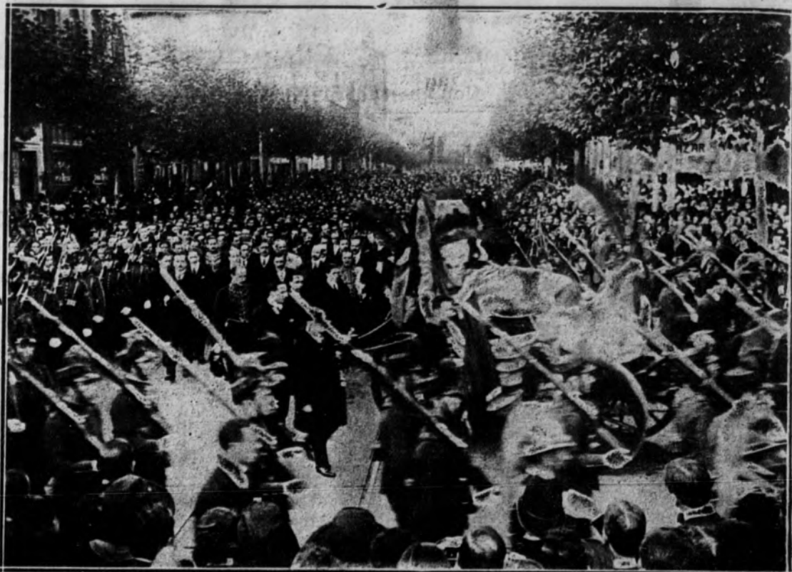
ENTIERRO DE LOS RESTOS DE AMADO NERVO.—El cortejo fúnebre a su paso por la Avenida 18 de Julio.

Agrega el doctor que las preocupaciones de los que le rodeaban, por las alternativas de su quebrantada salud, le hacían decir espontáneas y dulces frases de gratitud.