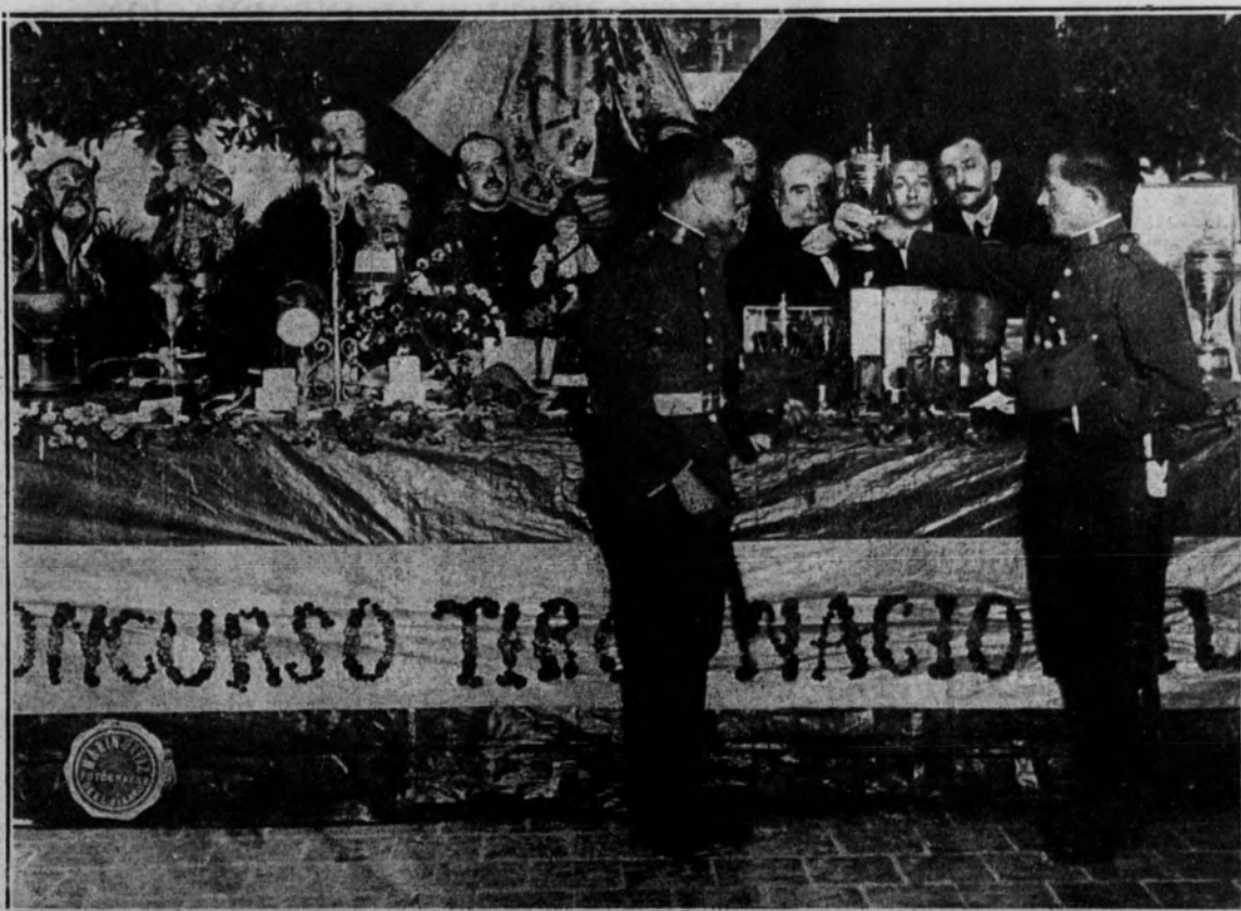
El ministro de Hacienda, Sr. La Cierva, rodeado de otras personalidades, entregando la copa del Rey a los soldados de Ingenieros David Dapazo y Germán Nalda, en el reparto de premios del final del campeonato de Tiro Nacional.