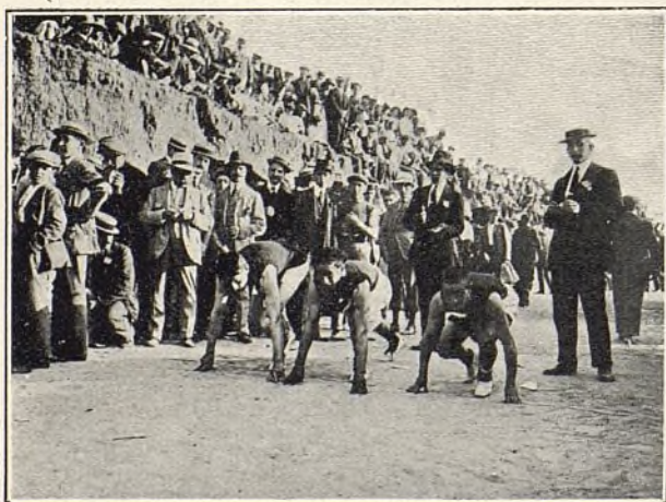
Salida de corredores en la carrera de velocidad de 1.500 metros en pista.