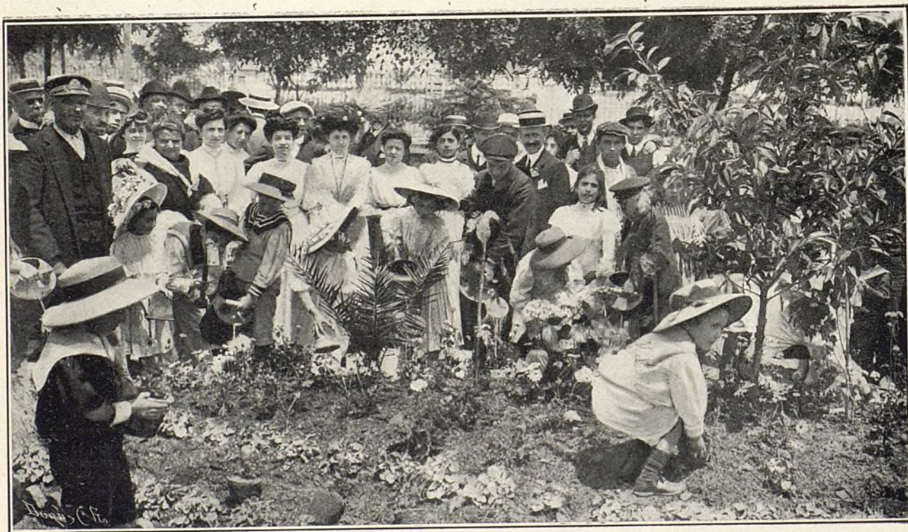
Riego de árboles y trabajos de jardinería por los escolares premiados en los concursos.