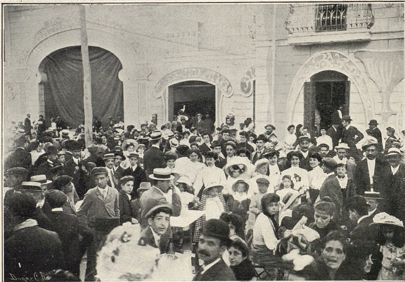
El público saliendo del concierto y festival celebrados en el frontón.