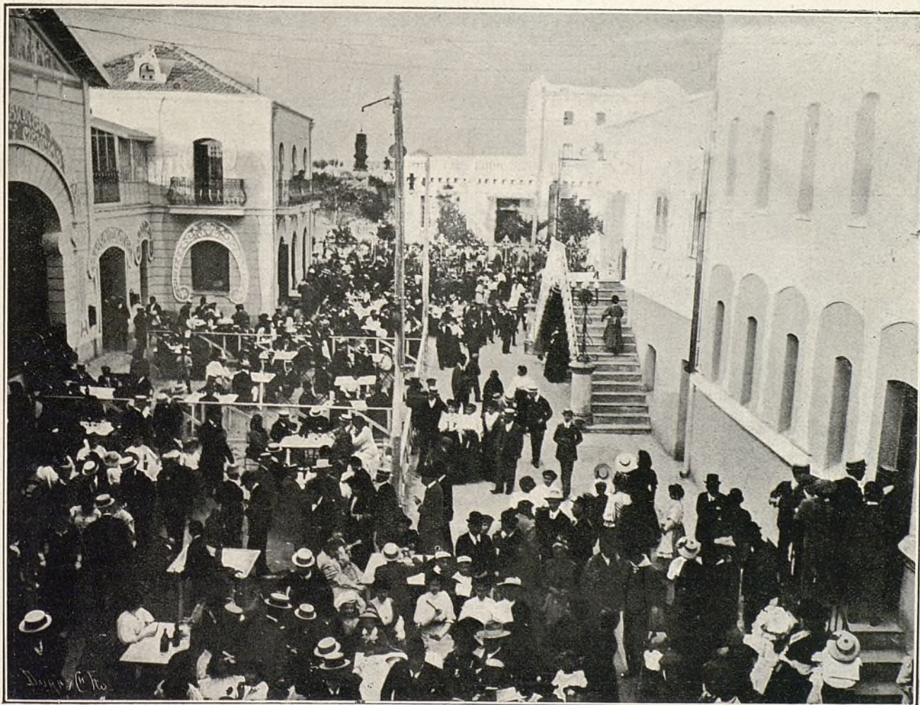
Aspecto del recinto del teatro momentos antes de empezar el festival atlético en el frontón.

celebrada los días 19, 20 y 21 de junio.