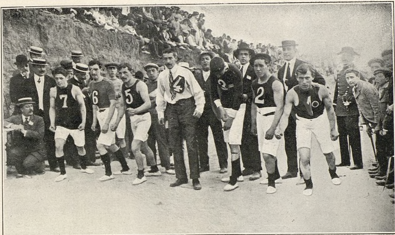
Salida de corredores en la carrera á pie con obstáculos.