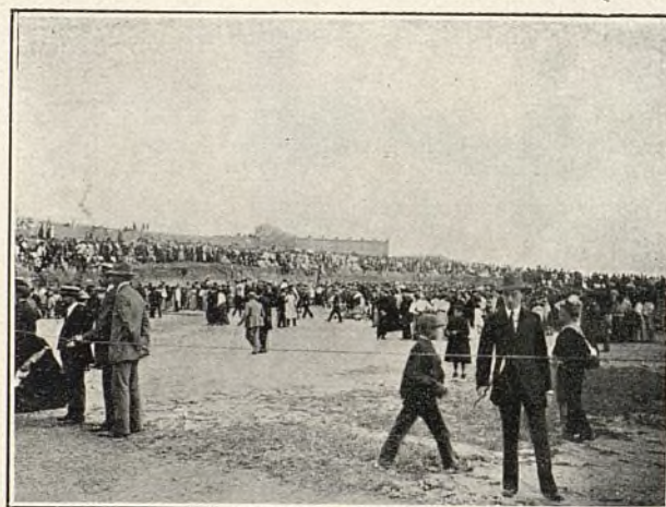
Vista general del lugar donde se celebraron las carreras á pie.