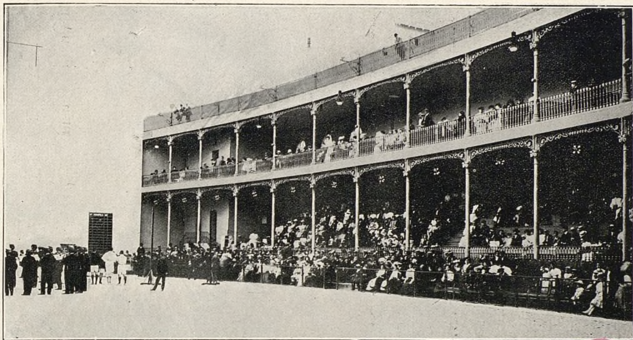
Aspecto del frontón durante el concierto de bandas militares.