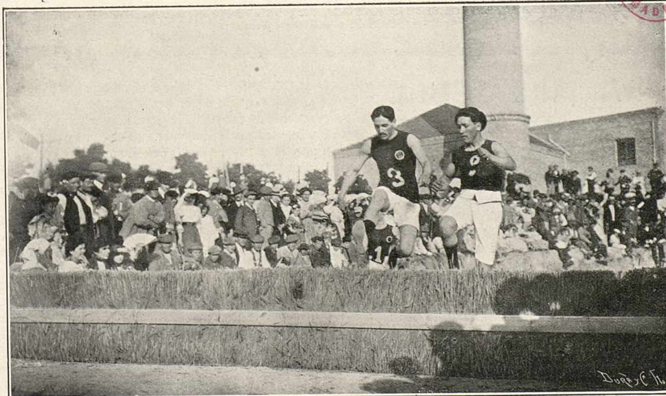
El público presenciando uno de los obstáculos de saltos.