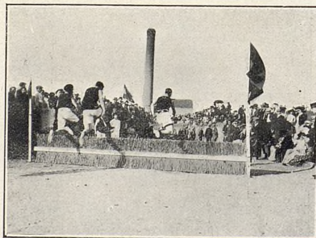
Los que ganaron los tres primeros premios, saltando el último obstáculo.