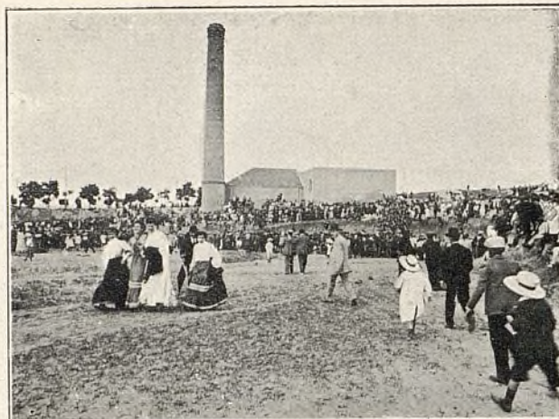
El público presenciando los preparativos de las carreras á pie con obstáculos.