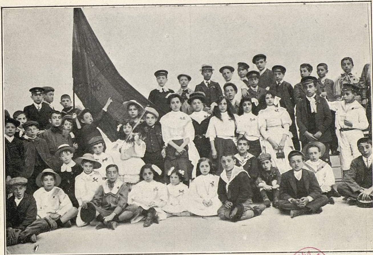
El Orfeón infantil «Beççjo» que ganó el primer premio.