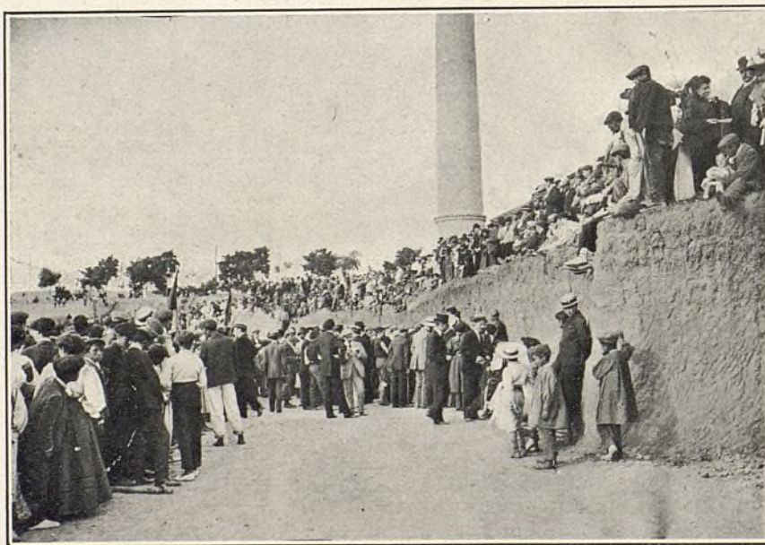
El público esperando el resultado del concurso de carreras á pie.