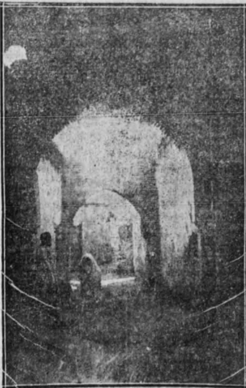
Una calle de Mequinez

Estas dos sílfides, maestras en el arte del galanteo picante y picaresco, se desviven por que las tentacio-