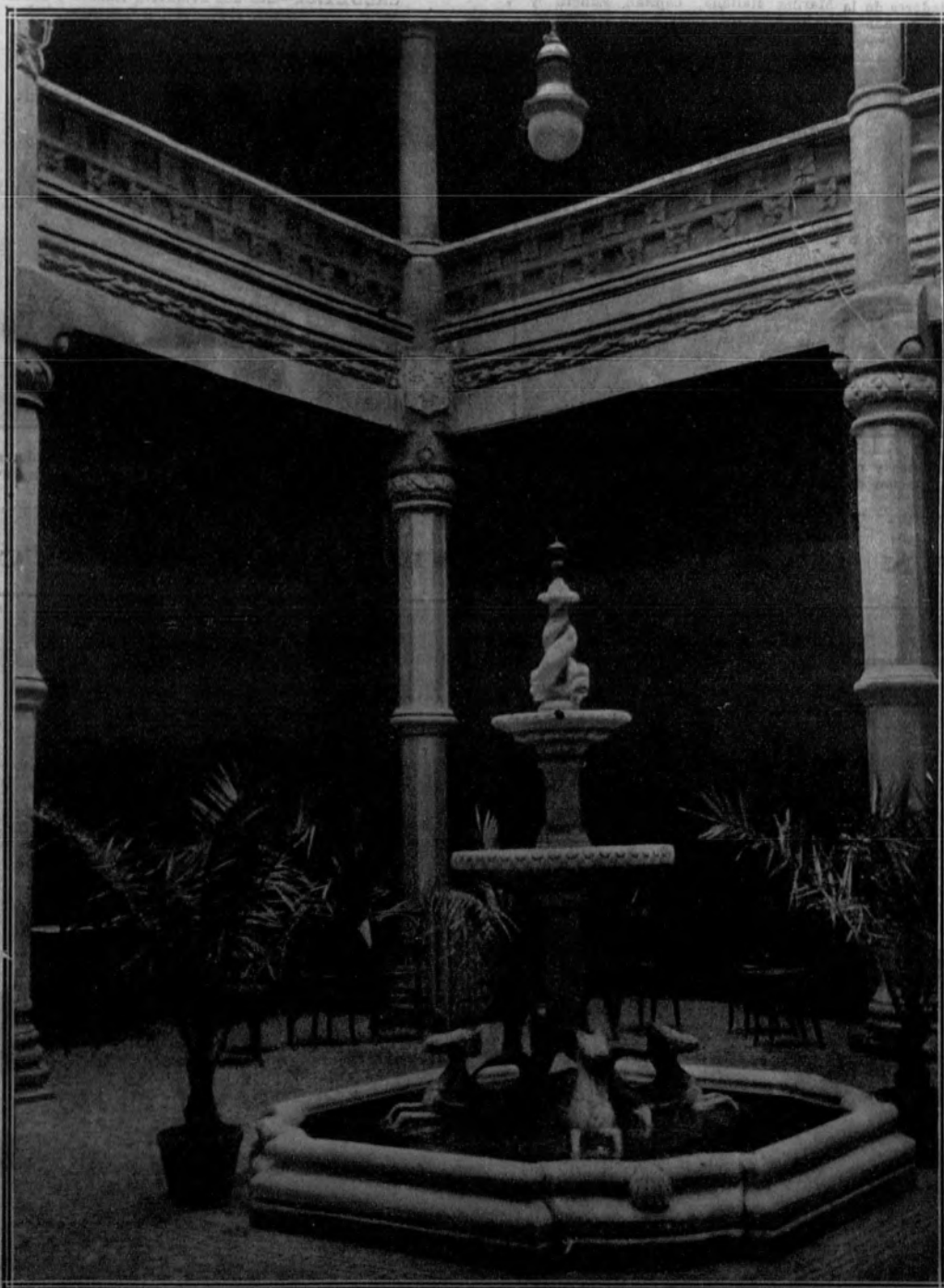
ORENSE.—Vista del artístico patio del Casino, moderna construcción de delicado gusto y fino estilo.