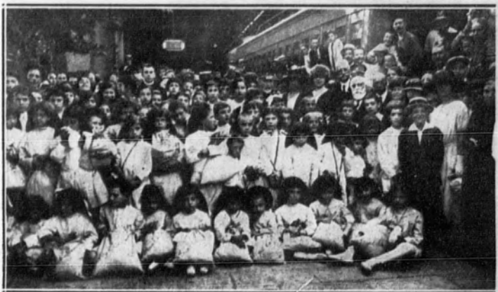
BARCELONA.—Grupo de niñas y niños pertenecientes a las Colonias escolares, esperando en la estación de Francia para dirigirse a Tiana.