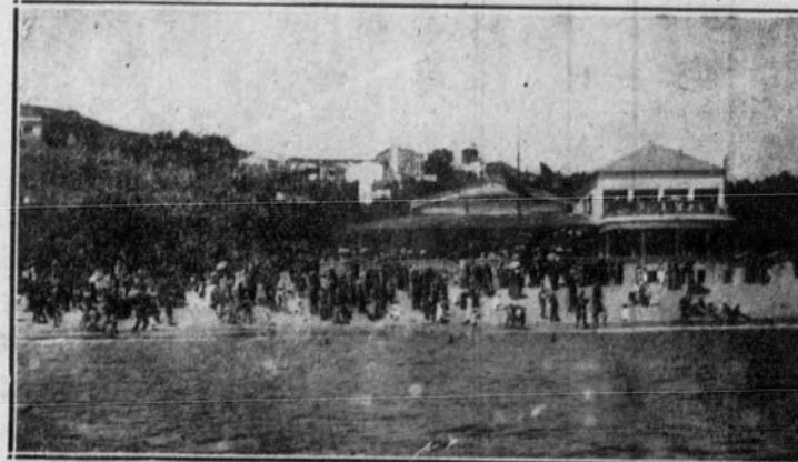
CALDETAS.—La Colonia veraniega de Caldetas presenciando desde la playa las evoluciones de la escuadrilla de aviadores italianos.