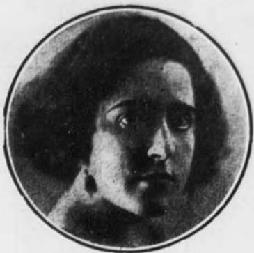
CATHERINE CALVERT Aplaudidísima actriz de la pantalla.