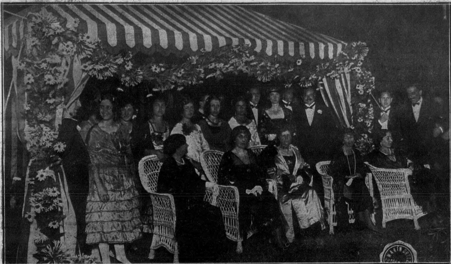
Su Majestad la Reina rodeada de varias señoras y señoritas de la aristocracia, que tomaron parte en la fiesta celebrada a beneficio de la institución "La Gota de Leche"

SANTANDER.—VERBENA BENEFICA EN EL REAL PALACIO DE LA MAGDALENA