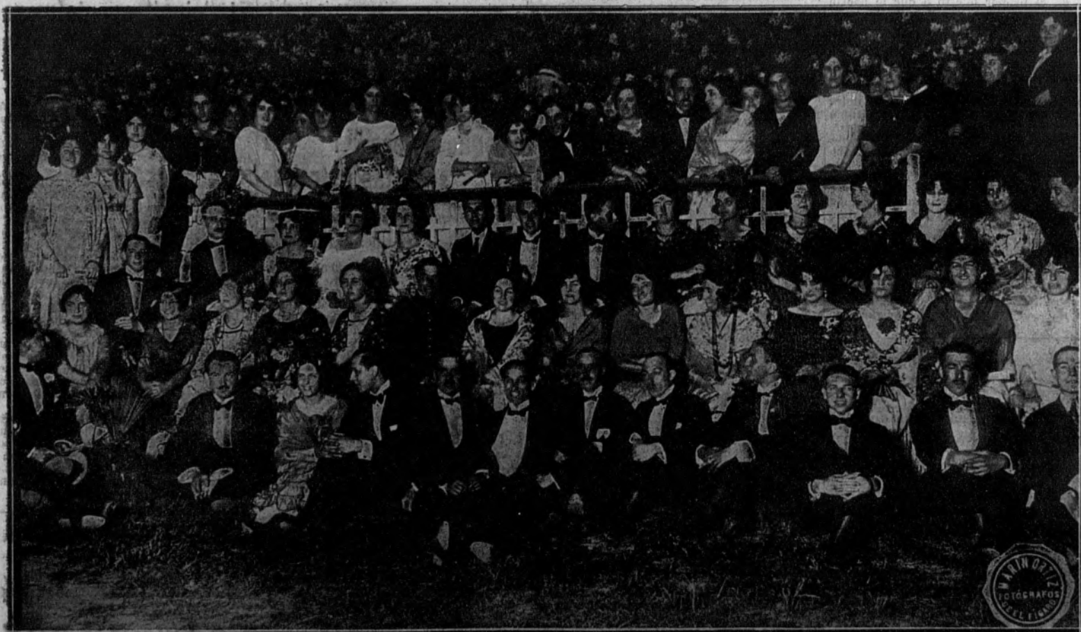
Grupo de aristócratas que asistieron a la verbena aristocrática que se verificó en el campo de "tennis" del Real Palacio de la Magdalena