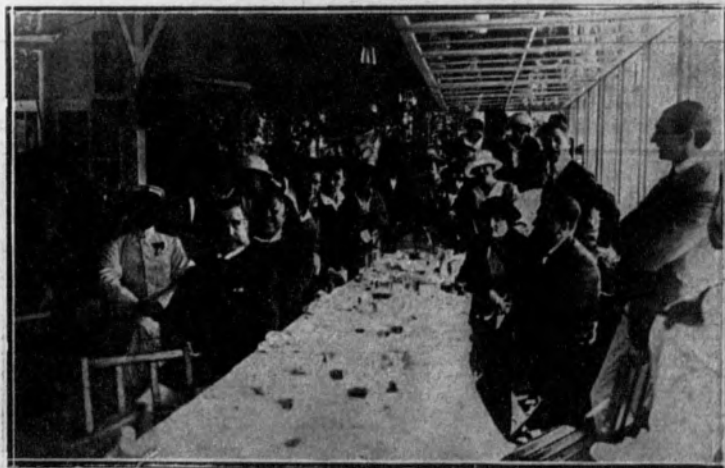
Los balandristas en el restaurante Cámara, donde celebraron un banquete a su llegada a este punto.