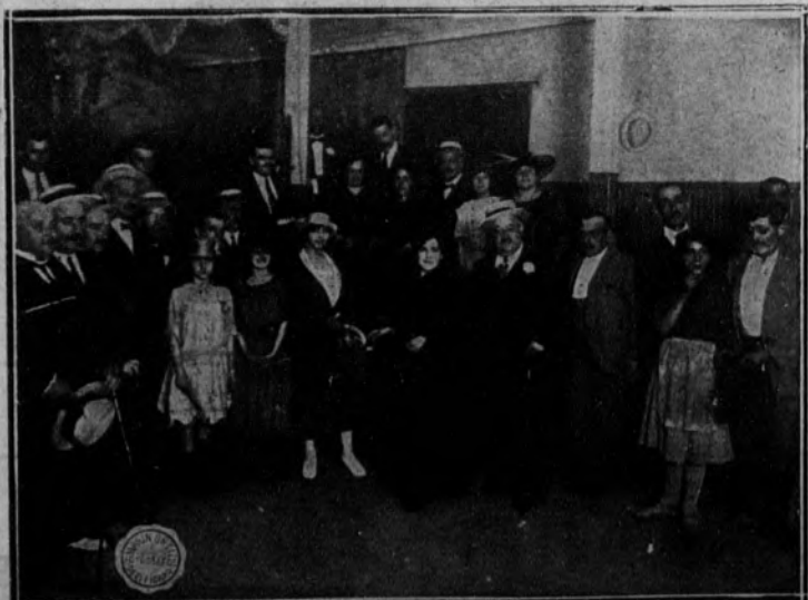
El alcalde de Madrid presenciando el reparto de comestibles a los pobres en la «akermesse» del distrito del Hospital, con motivo de la verbena de San Lorenzo.