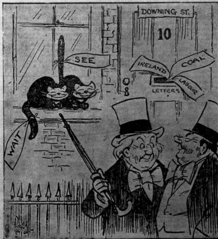
Mr. Asquith, a quien las vacilaciones del Gobierno actual hacen recordar las que él tuvo al principio de la guerra, dice a lord Haldane: «¿No son éstos los gatos de antaño?»