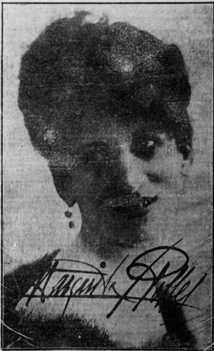
Margarita Robles, notable primera actriz, que actuará en el Teatro Nacional de la Habana

Por iniciativa de D. Paulino Savirón, catedrático de la Facultad de Ciencias Químicas de Zaragoza, se está organizando en dicha capital un grupo de estudiantes, que concurrirá al Congreso de Bilbao, para poder visitar, con este motivo, las fábricas metalúrgicas y de productos químicos.