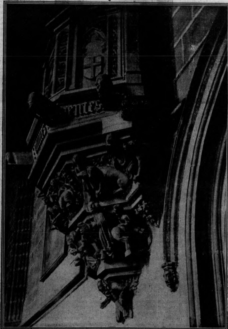
Detalle de la base del púlpito existente en la iglesia del Convento de Dominicos, en Nájera (Logroño).