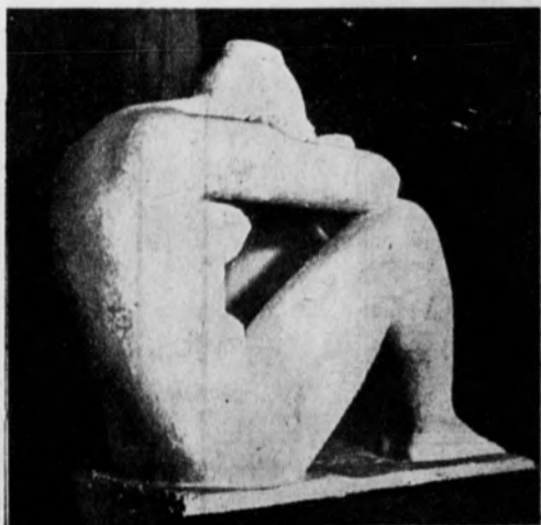
Mujer ocultando la cabeza.

Mestrovic—el genio escultórico actual—no puede ser considerado realmente como discípulo de Rodin; recibió, ello es indudable y visible, «la enseñanza de la verdad» rodiniana—la verdad contra la exactitud y la verdad de la síntesis, que encierra todas las formas contra la falsedad del análisis minucioso que las descompone—; mas, por la plena conciencia de su idiosincrasia, por la grandiosa identificación de su espíritu con el espíritu que desea expresar—espíritu de su raza, de su tierra, de los sentimientos y pasiones de éstas—, la obra de Mestrovic, siendo en cierto modo un resultado, aparece co-