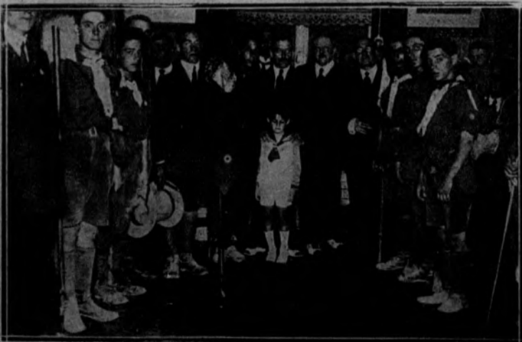
SAN SEBASTIAN.—Los exploradores que fueron a pie a Vitoria, al regresar a esta capital entregaron al alcalde un mensaje de salutación de aquel Ayuntamiento.

Sin ser un especialista en los 800 metros, podrá resistir y vencer las dos pruebas, en las que hay inciertos prestigiosos campeones, como el campeón de Bélgica, Antonin Rives, que en las siete pruebas disputadas últimamente ganó siete de una manera brillante?