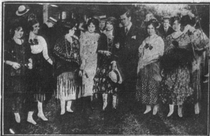
Grupo de distinguidas señoritas que asistieron a la fiesta luciendo artísticos tocados y trajes.

SAN SEBASTIAN.--Festival de la Cruz Roja en el Hipódromo