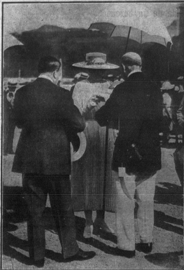
Su Majestad la Reina en las carreras vendiendo billetes a algunos aristócratas para el festival de la Cruz Roja, que se celebró el sábado por la tarde en esta capital.