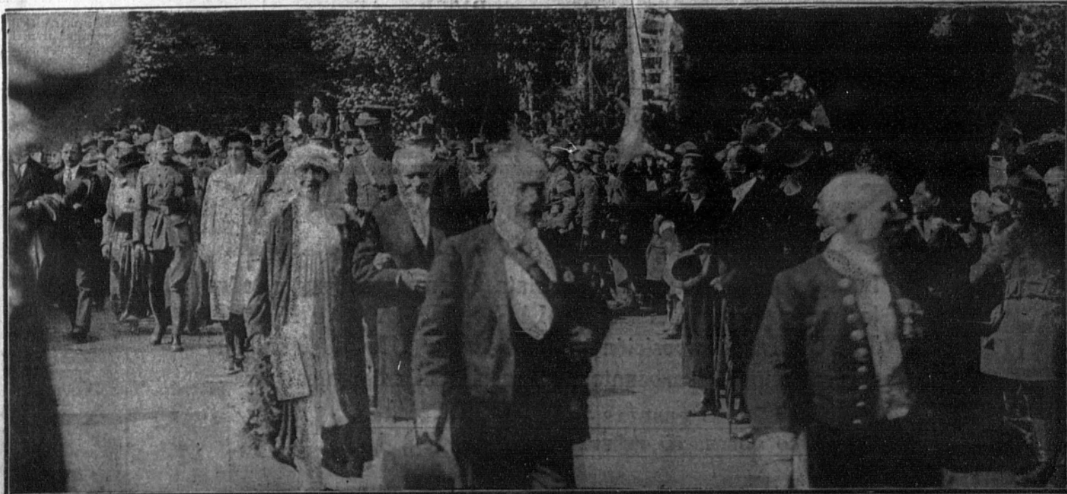
Los Reyes de Bélgica, el presidente de la República francesa y jefes y oficiales del acompañamiento, formando en la comitiva de honor durante el desfile de ésta por el Parque de la Boverie, el día de las fiestas patrióticas celebradas en Lieja.