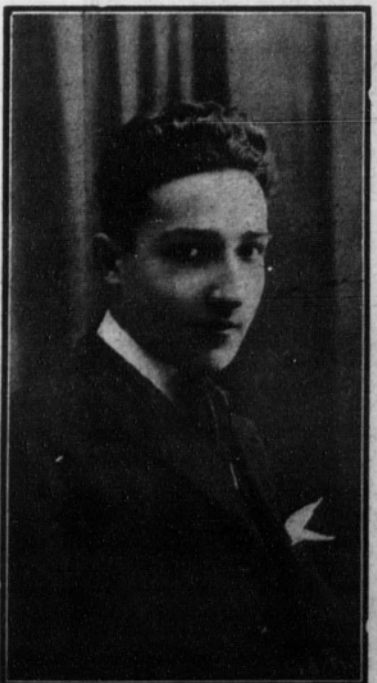
José Rogés, actor cinematográfico español.