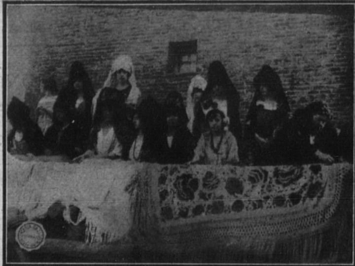
Un grupo de bellas señoritas de la colonia veraniega presenciando la becerrada desde un «palco».