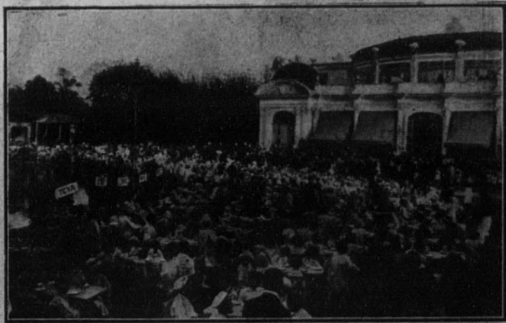
Aspecto que ofrecía la plazuela del Parque durante la merienda con que fueron obsequiados por el Ayuntamiento barcelonés los niños de las colonias escolares.