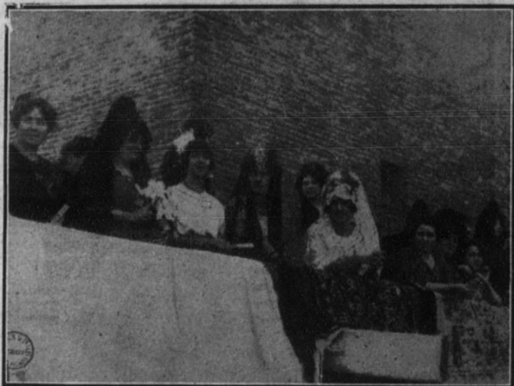
Otro grupo de señoritas presenciando la corrida y luciendo los clásicos tocados de la mantilla.