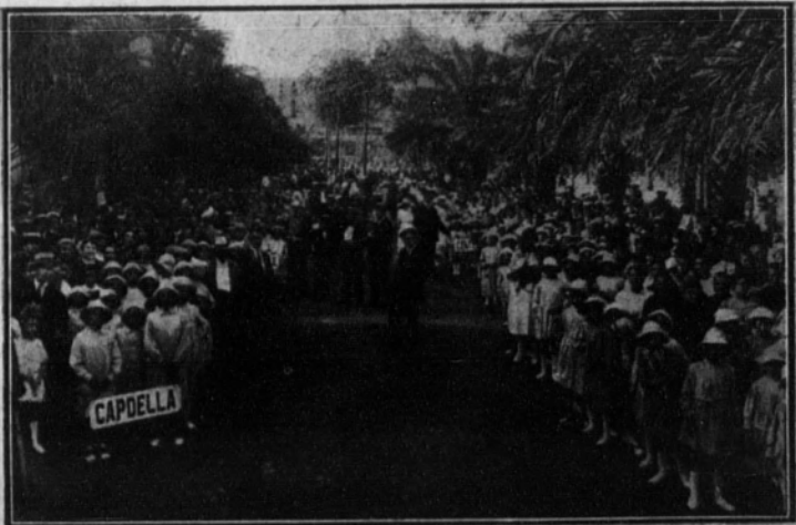
Las colonias escolares en la plaza de Cataluña, reunidas para dirigirse al Parque, donde se les ofreció la merienda costeada por el Ayuntamiento de esta capital.