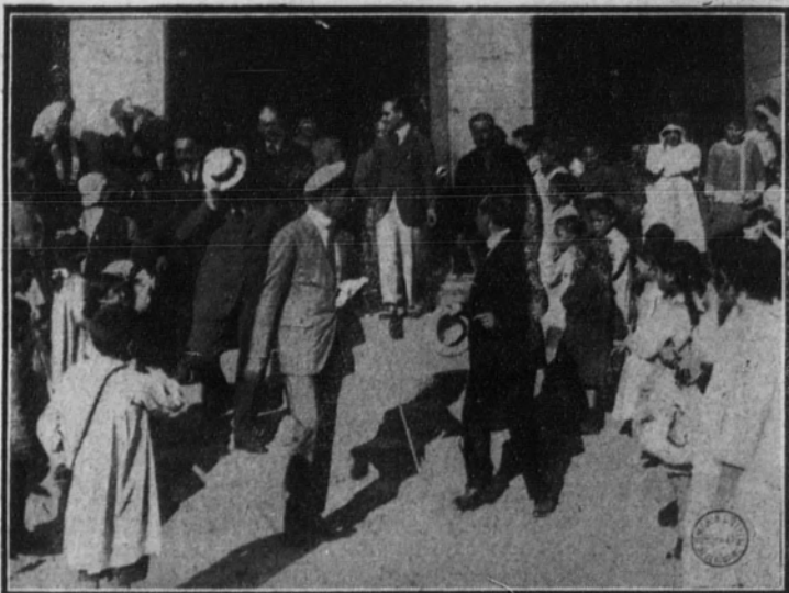
Su Majestad el Rey saliendo de visitar una de las escuelas municipales del pueblo, con ocasión de su llegada a Llodio.