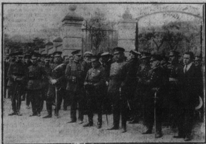
La presidencia del duelo

Una compañía del servicio de Aviación rindió honores a los cadáveres, que fueron enterrados en el cementerio de Carabanchel Alto, en lugar próximo a las tumbas de otros aviadores.