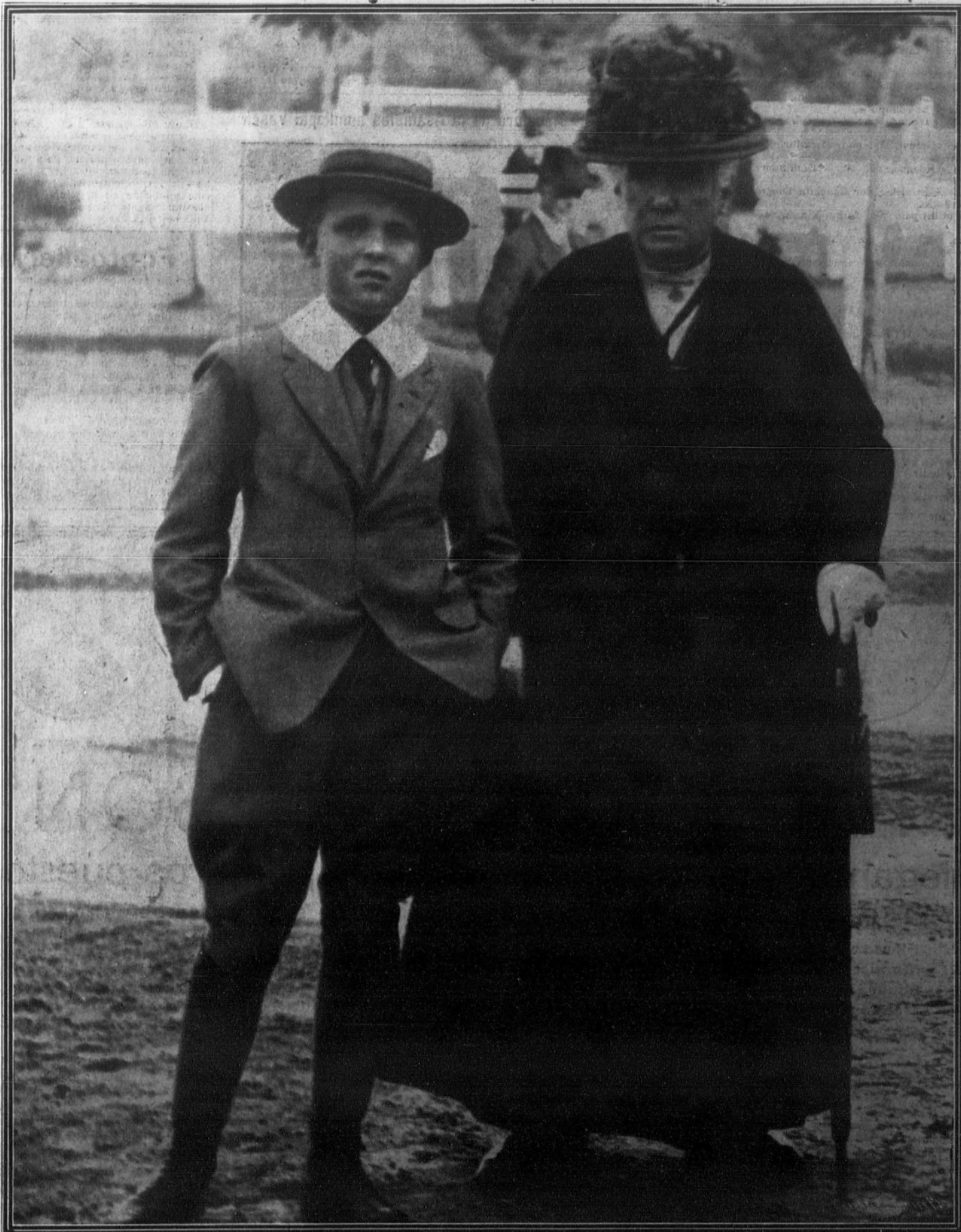
Sus Altezas Reales el Principe de Asturias y la Infanta doña Isabel al llegar al «stand» del Hipódromo para asistir a las carreras de caballos últimamente celebradas en esa capital.

EL VERANEO DE LA FAMILIA REAL SAN SEBASTIAN.-EN LAS CARRERAS DE CABALLOS