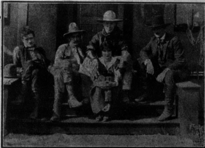
WILLIAM S. HART y ANN LITTLE, su primera actriz,

con otros miembros de la Compañía y del departamento técnico, en los talleres de la Casa Famous Players-Lasky, en Hollywood (California).