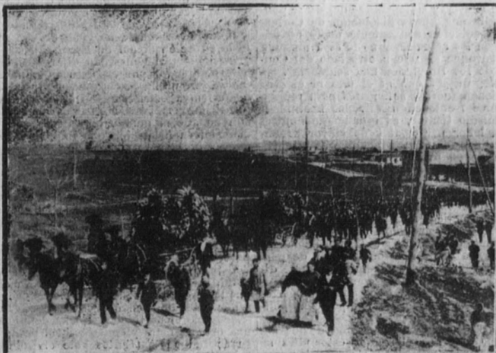
La comitiva fúnebre al dirigirse al cementerio