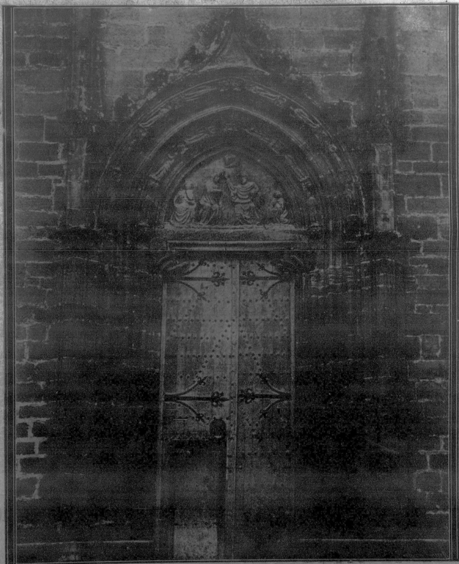
PAMPLONA.—Detalle de la artística puerta de San José, en la catedral.