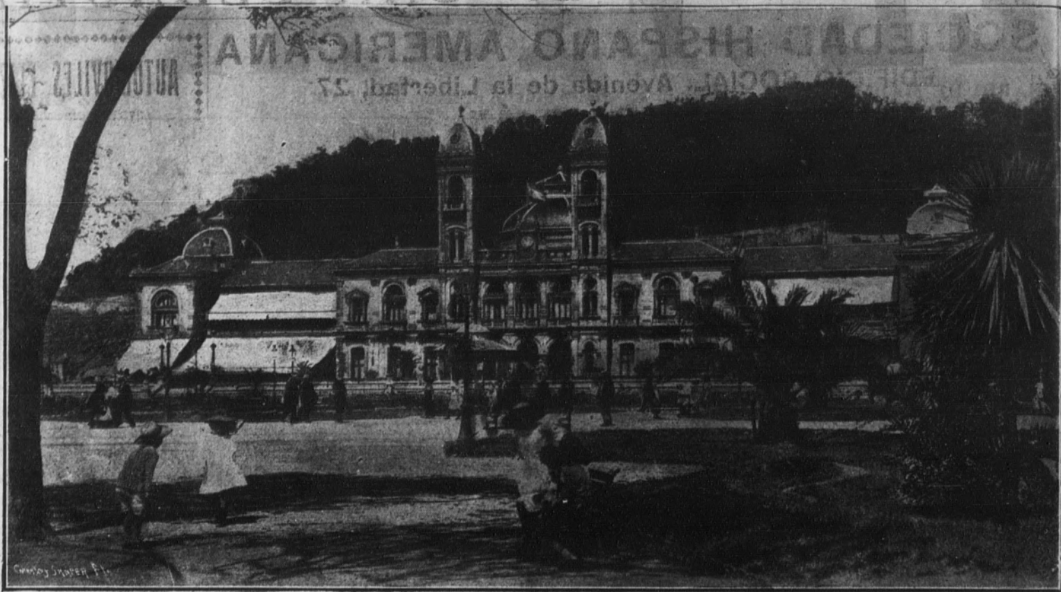
Vista de la fachada principal del Gran Casino.