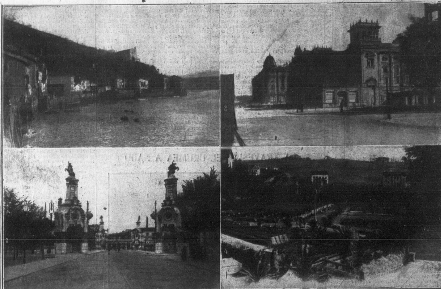
1. Un rincón de Pasajes de San Juan.—2. Teatro Victoria Eugenia y hotel María Cristina.—3. Entrada al puente de María Cristina.—4. Los viveros del Ayuntamiento.