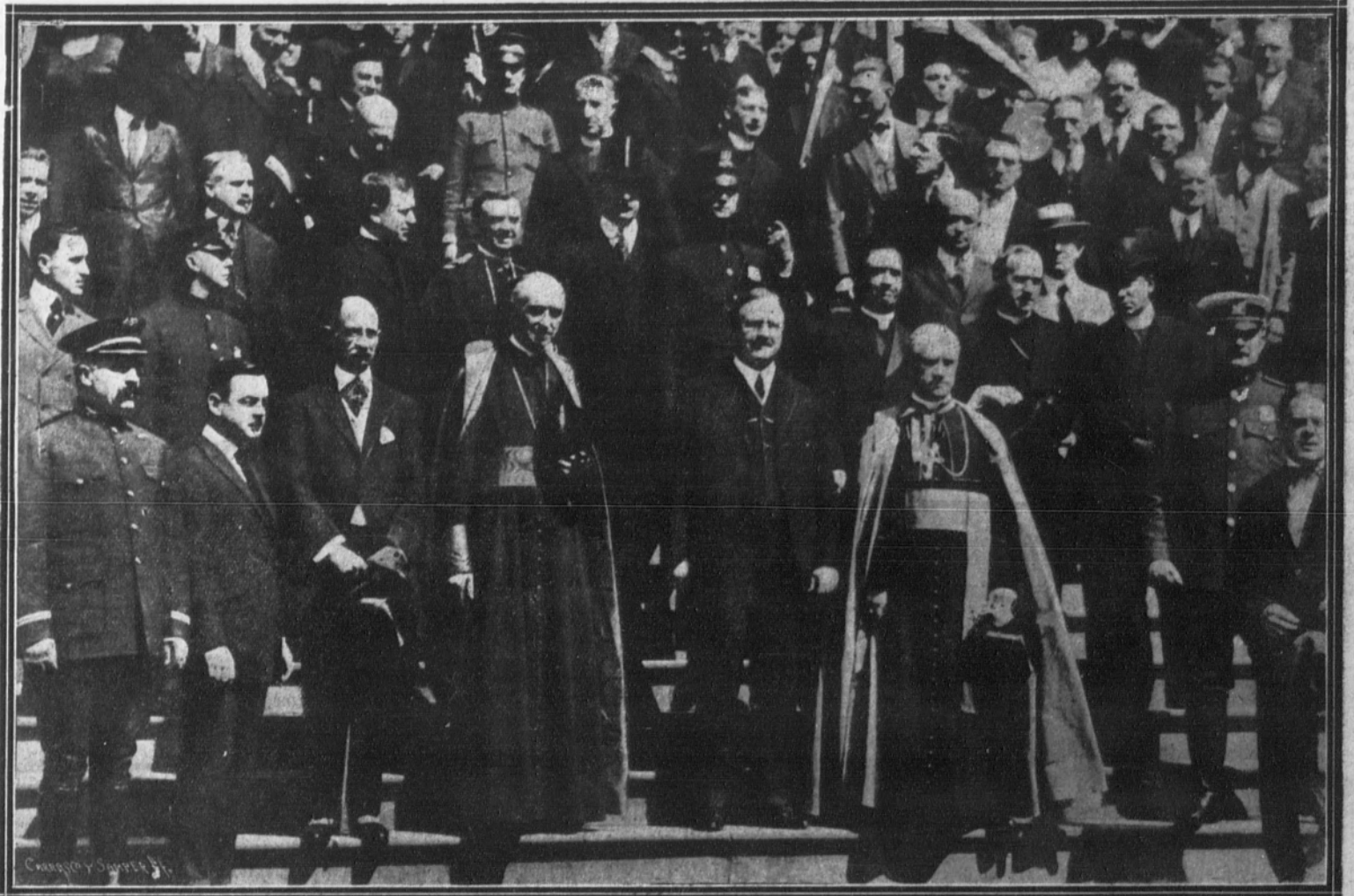
El recibimiento dispensado al cardenal Mercier en Nueva York constituyó un acto solemnisimo. En nuestra fotografia aparece monseñor Mercier en la gran escalinata de entrada al Ayuntamiento, rodeado de las autoridades civiles y militares de la capital, y entre éstas, el arzobispo de Nueva York, Mgr. Hayes.