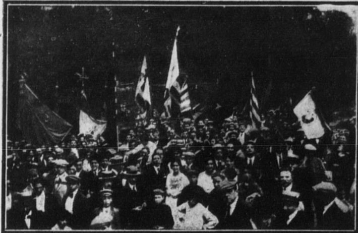
Los abanderados al salir de la iglesia de la Ermita, en Vallvidriera, después de la función religiosa.