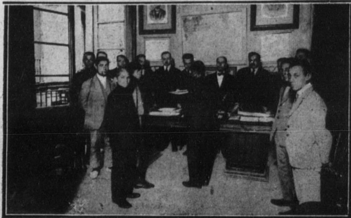
Reparto de premios a los alumnos de la Unión Industrial, verificado el día 5 de este mes.