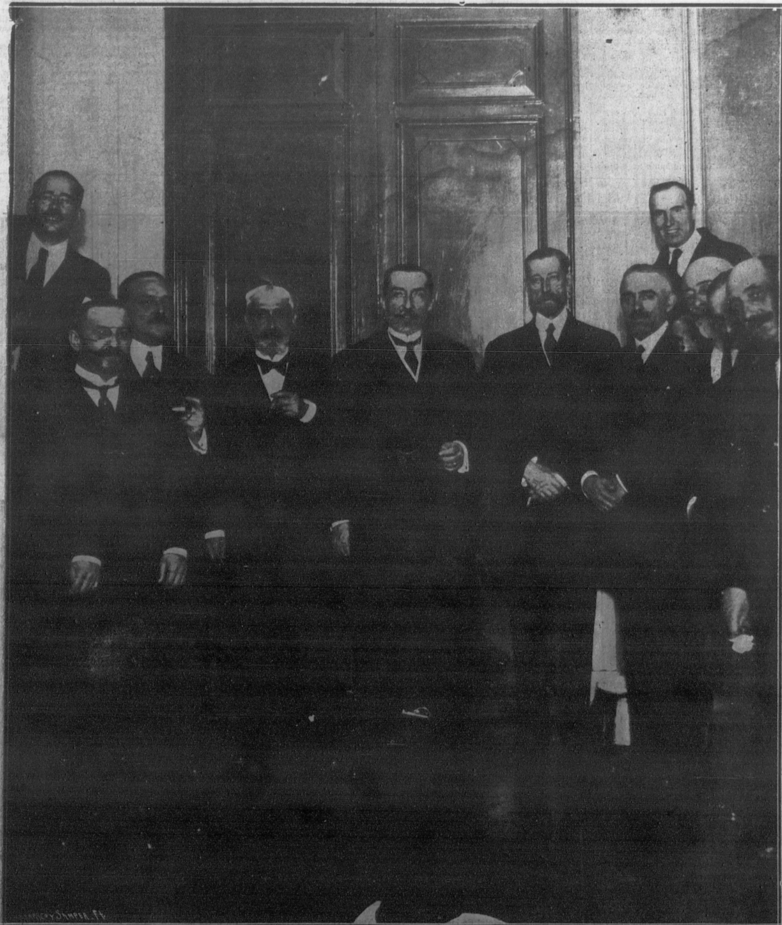
El ministro de la Gobernación, Sr. Burgos y Mazo; el director general de Seguridad, el gobernador civil y otras autoridades, con los periodistas que hacen información en el ministerio, después de haberse efectuado el cambio oficial de la hora en el reloj de torre de este edificio.