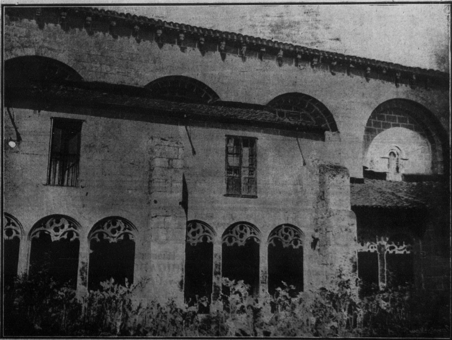
JUNQUERA DE AMBIA (Orense).—Vista de uno de los lados del claustro del patio de la Colegiata.