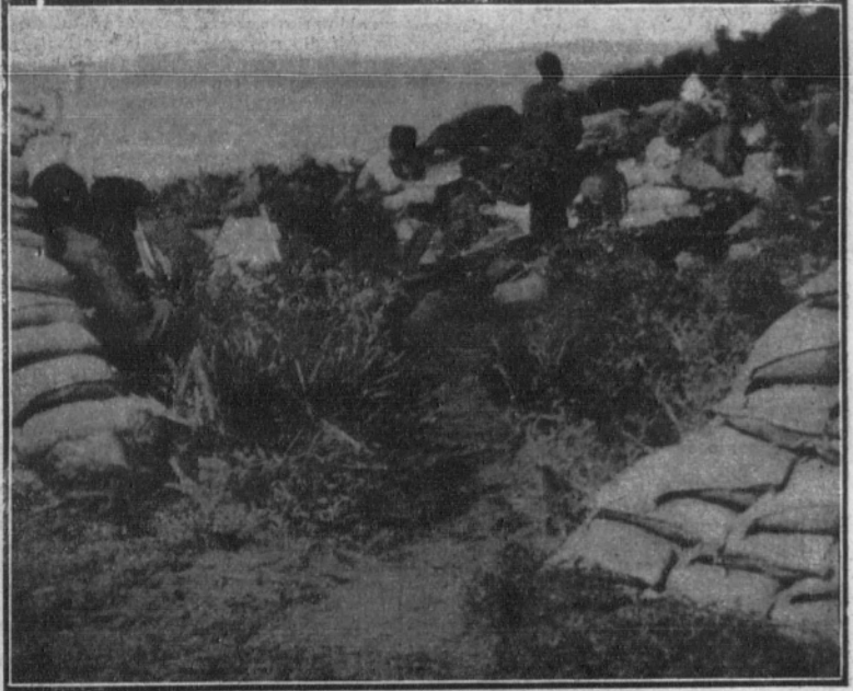
Una avanzadilla de ametralladoras.