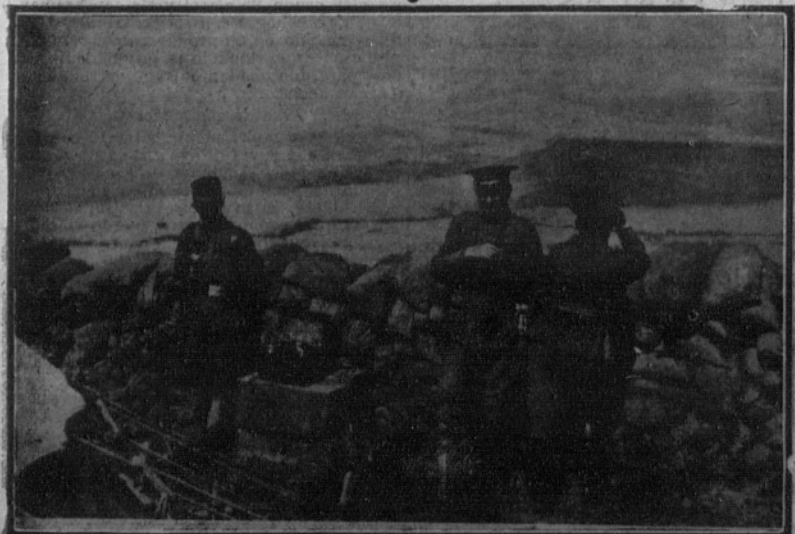
OCUPACION DEL YEBEL-HEDIA.—El general Berenguer telefoneando a las avanzadas.