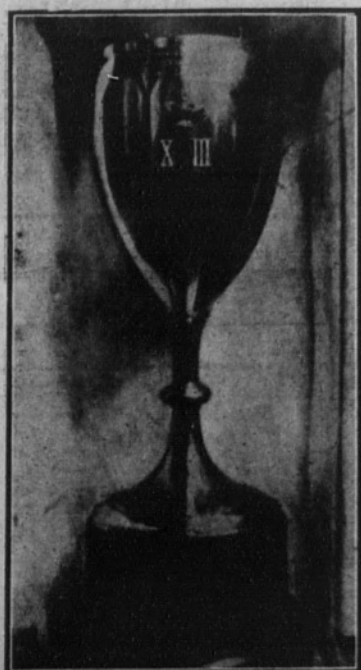
La copa donada por Su Majestad el Rey.

A las ocho en punto de la mañana será la hora de salida para las «motos» solas, y a las diez, la de partida para las con «side-cars», teniendo señaladas las horas de prentaje de cuatro a seis en la tarde de la víspera.