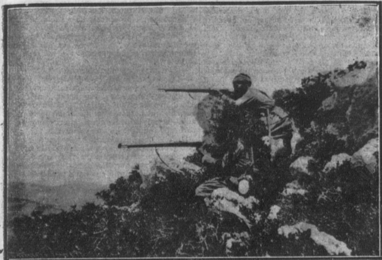
Grupo de moros regulares de Tetuán disparando desde una loma.