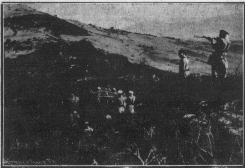
Una guerrilla de Regulars de Tetuán avanzando.