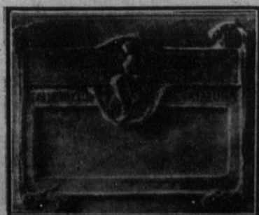
Título de campeón, en placa de plata.

No hay anuncio caro si es eficaz. El anuncio más eficaz es el más caro.