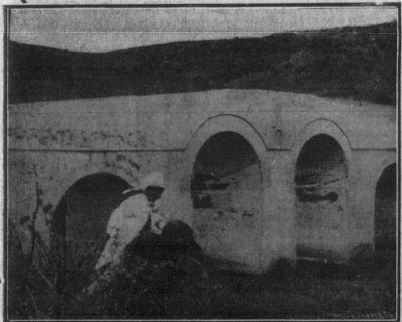
El puente Buceja.