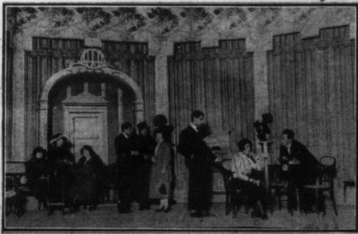
Una escena de la comedia en dos actos, titulada «La prosa de la vida», de don Miguel España, estrenada ayer, tarde en el Gran Teatro.