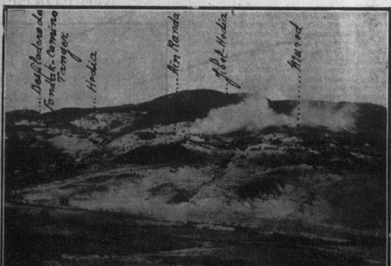
OCUPACION DEL YEBEL-HEDIA.—Poblados incendiados, después de su ocupación, el día 2 del actual.