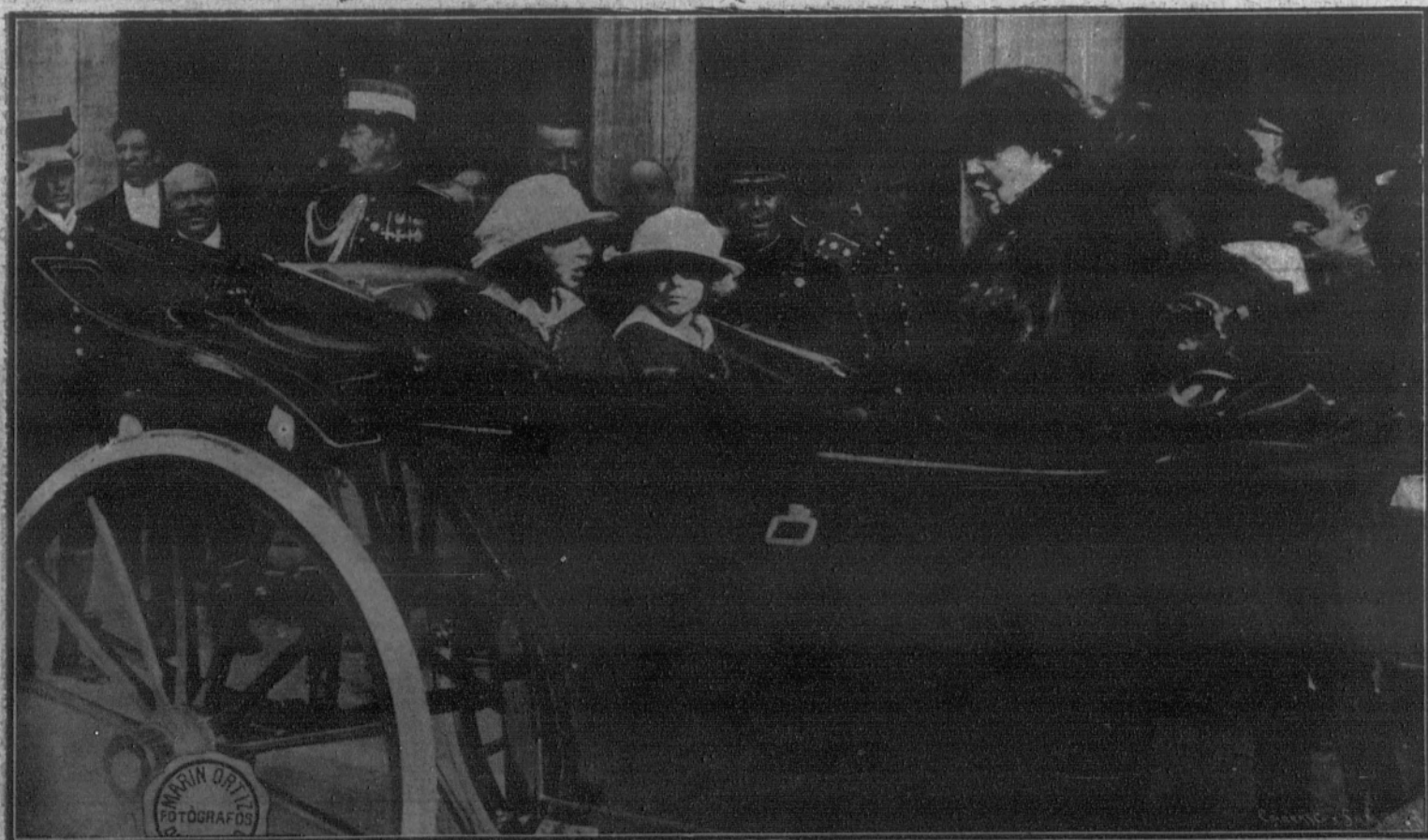
Sus Altezas Reales las Infantitas Beatriz y Maria Cristina, acompañadas de sus damas, al salir de la estación para dirigirse a Palacio.