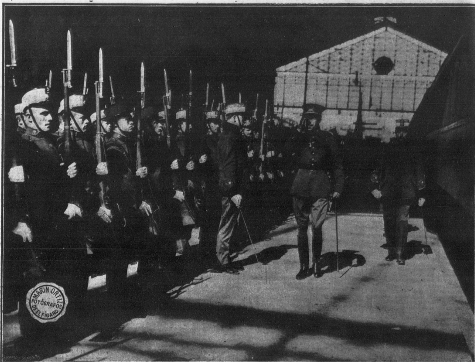
La Majestad el Rey D. Alfonso desfilando ante la Compañía de Infantería que acudió a la estación a rendirle honores.