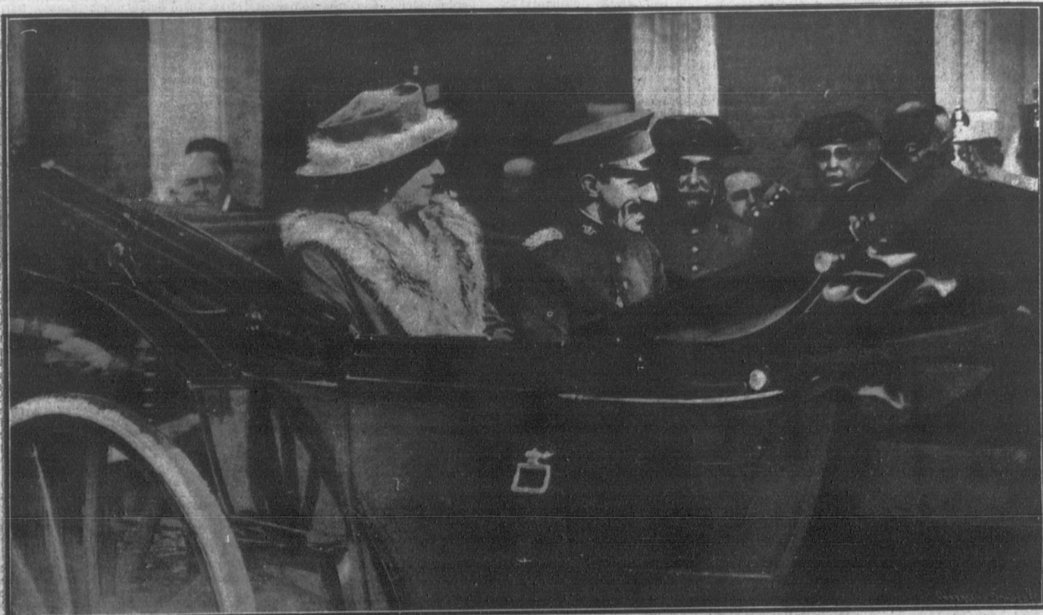
Sus Majestades D. Alfonso y doña Victoria en el coche que los condujo a Palacio.