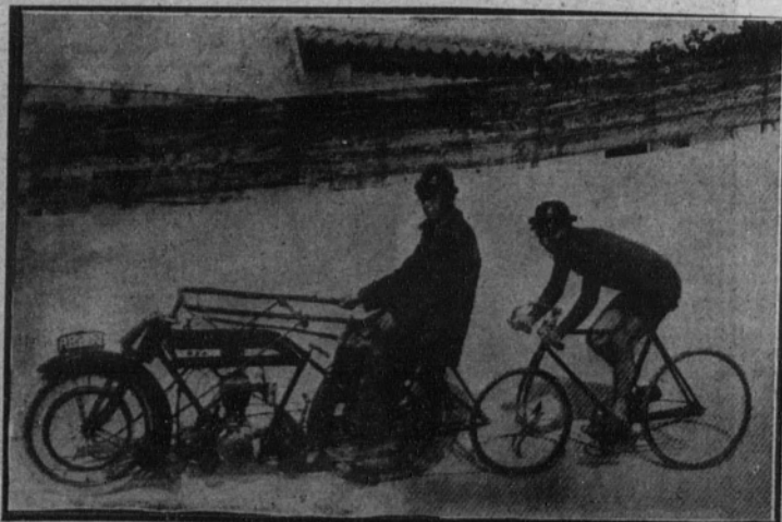
El campeón actual Bover, que cubrió los 100 kilómetros en una hora cincuenta y un minutos.