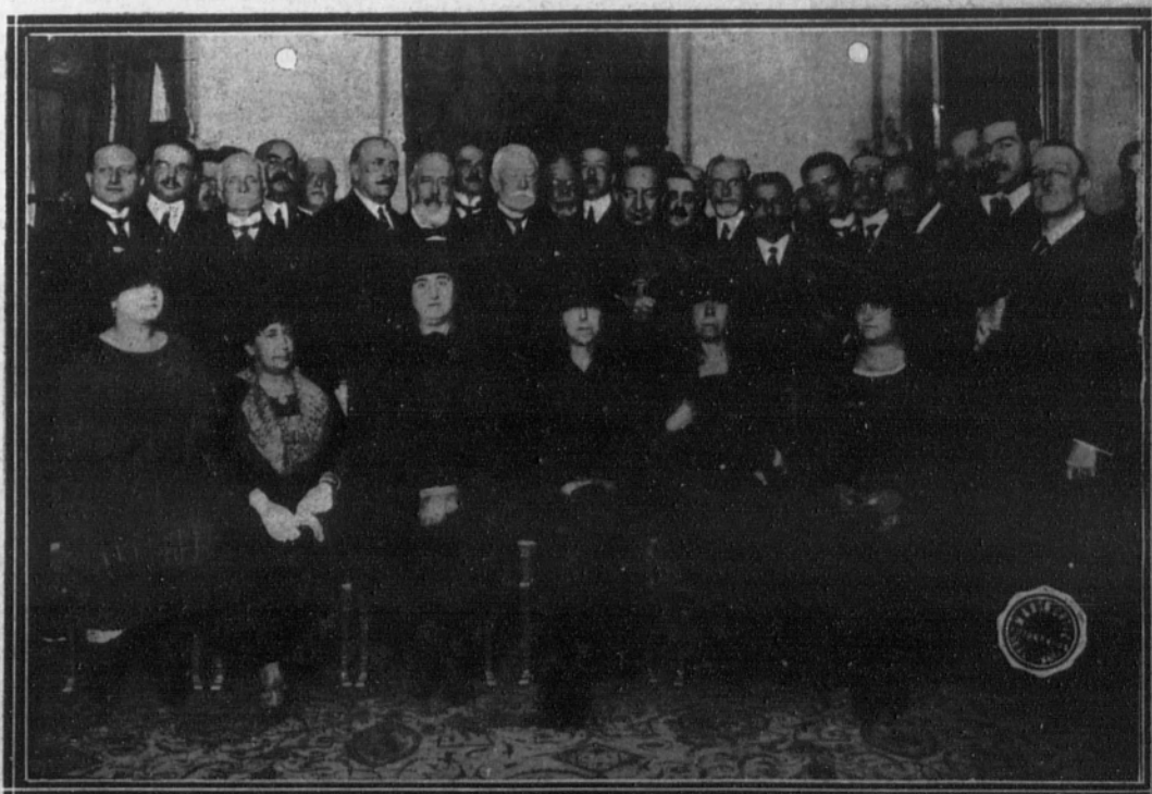
Ilustres personalidades que concurrieron al té con motivo de la fiesta de la Raza, celebrada en la Unión Iberoamericana.