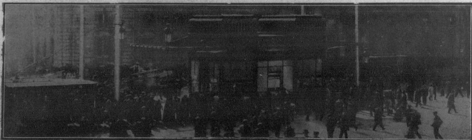
El público en los alrededores de la estación del Metropolitano, en la Puerta del Sol, esperando la llegada de Su Majestad para descubrir la lapida conmemorativa de la inauguración.