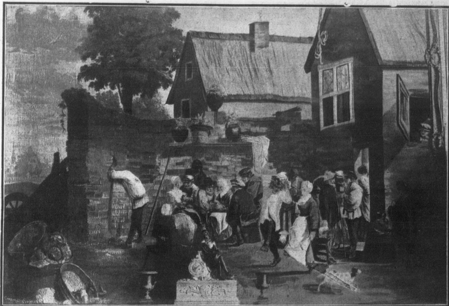
«Una fiesta campestre», soberbio tapiz de Teniers, que se conserva en el Real Palacio de El Escorial.