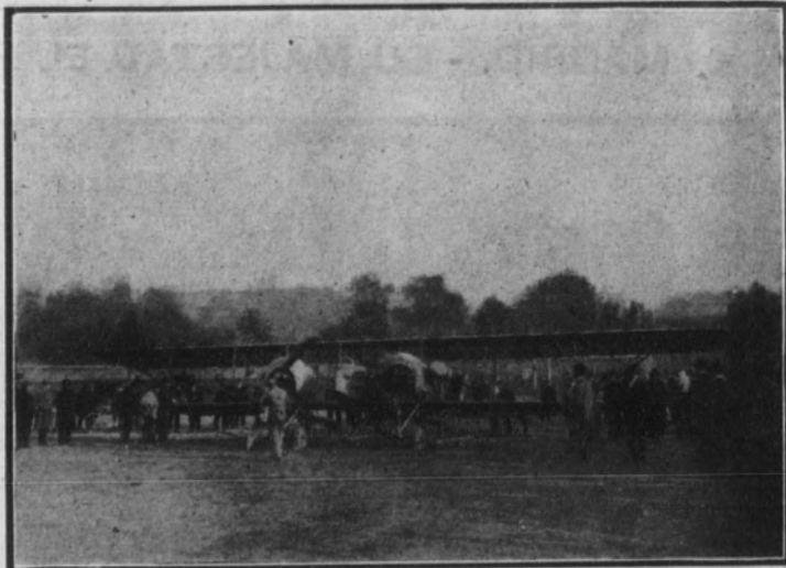
El biplano de doble motor en el instante de disparar sus hélices para emprender el viaje de 25.000 kilómetros.