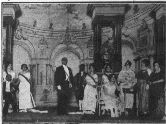
Una escena de la opereta «La Princesita de los sueños locos», que se estrenó el sábado por la tarde en el teatro de la Zarzuela.