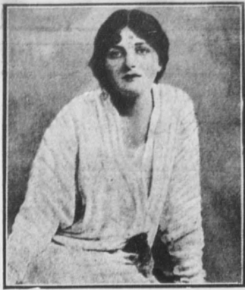
MISS GLADYS COOPER, bellísima actriz inglesa que ha logrado mercedísimos triunfos en el cinematógrafo.