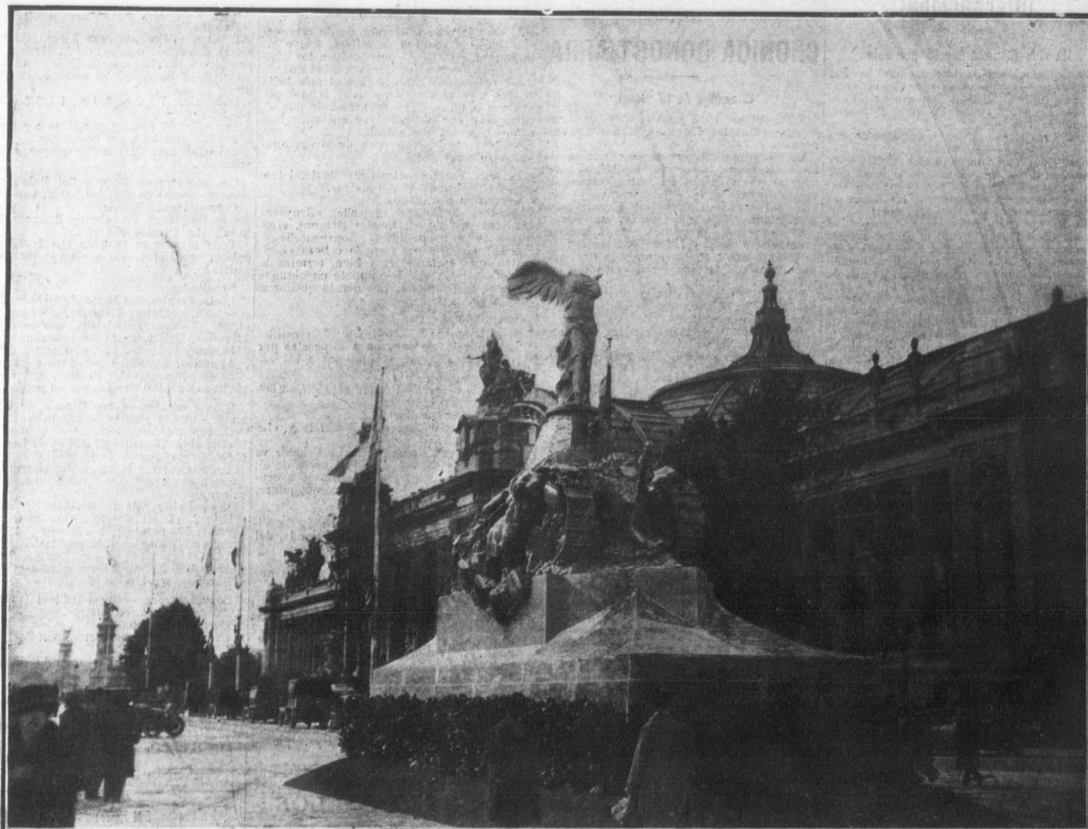
Detalle del notabilísimo monumento erigido a la entrada de la Exposición de automóviles, cuyo monumento conmemora los servicios prestados por los tanques en la guerra.