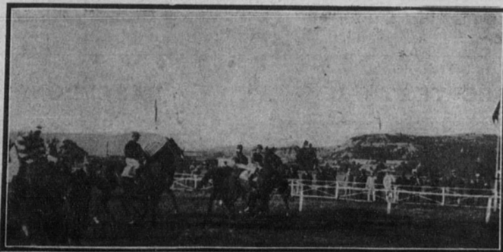
Momento de dar la salida a la primera carrera que se celebró en el Hipódromo de esta capital.