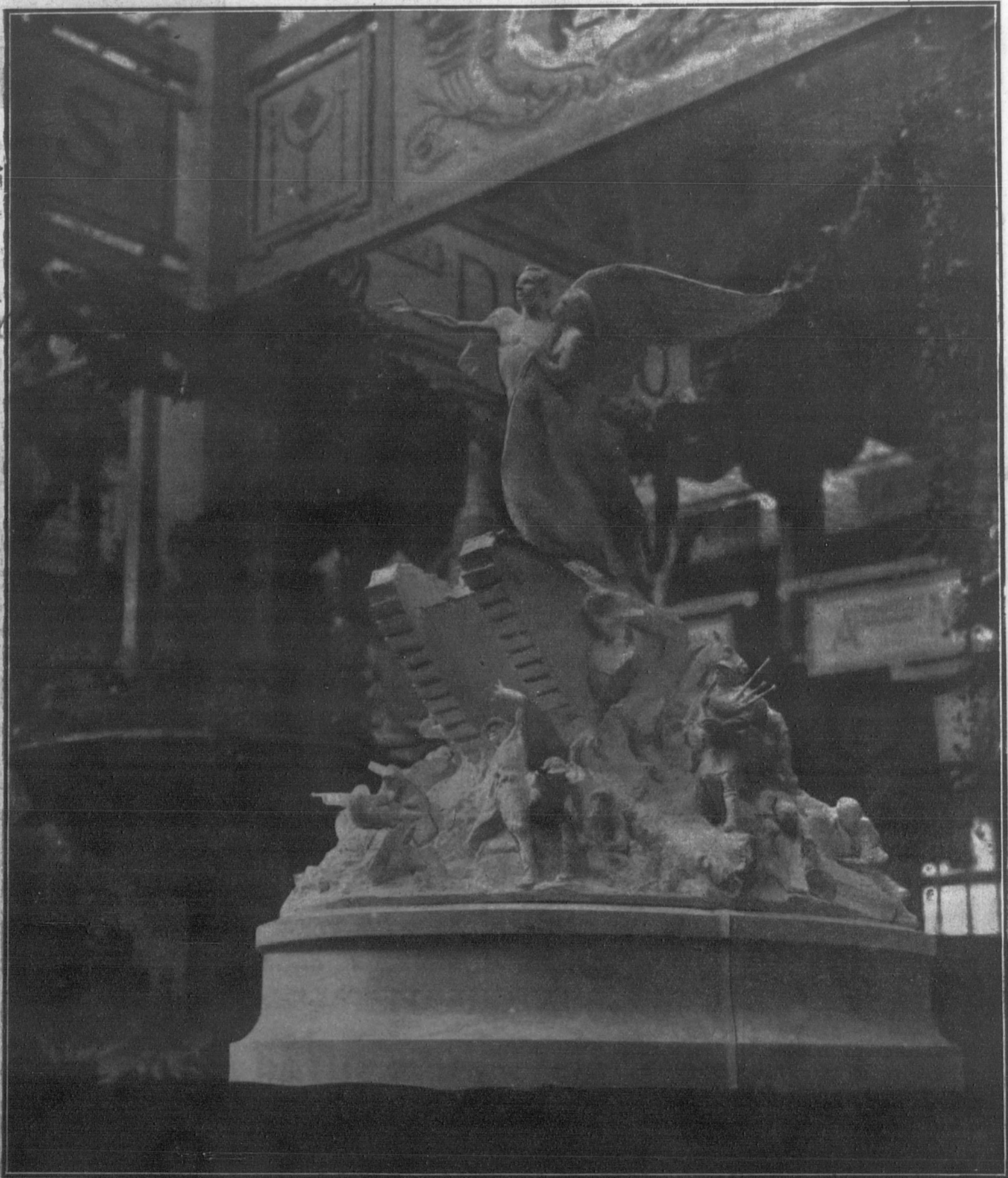
Una de las maquetas del monumento erigido a la entrada de la Exposición de Automóviles que actualmente se celebra en el Gran Palace