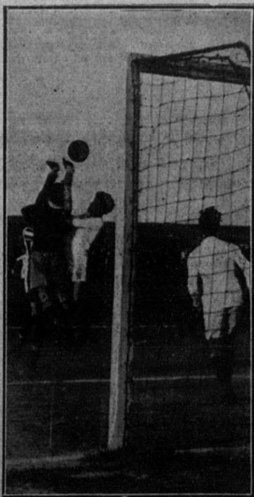
Una bonita parada del portero «racinguista», en el partido de inauguración de temporada entre Vizcaya y Santander.

Mendizábal, Muguerza y García (M.), bien secundados por Gallostra y Ordóñez, han sabido alcanzar el galardón de la victoria de modo brillantísimo. Sus estupendas «performances» en las pruebas de 100 y 200 metros, 1.500 y 5.000 metros, 800 metros y salto de longitud con impulso, y en la de relevos, respectivamente, les mantiene a los dos primeros en su antiguo prestigioso puesto, y a los últimos les clasifica entre las figuras