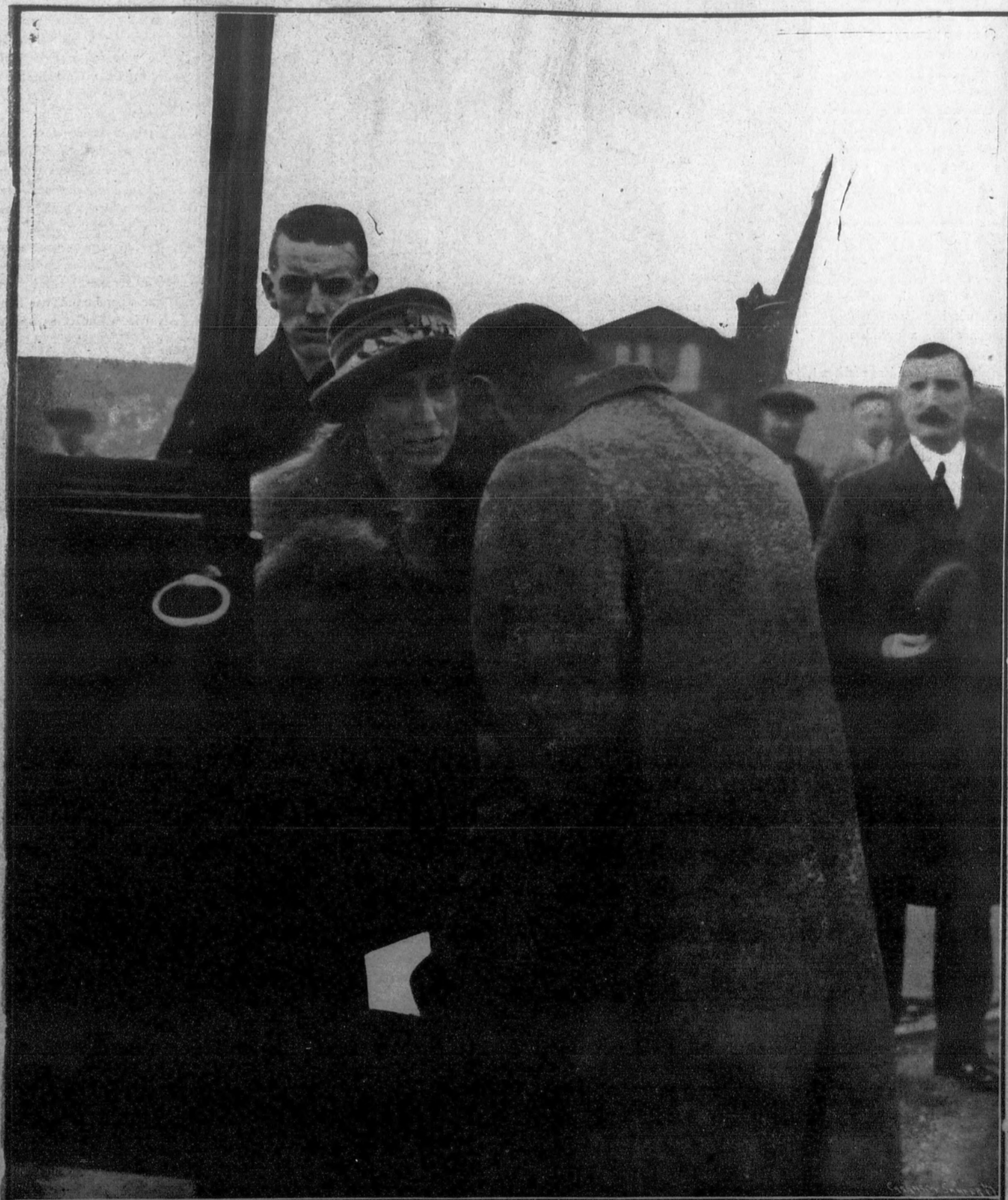
La Princesa Mary saludando, al apearse del automóvil, a los obreros del arsenal de Wootwich, a cuyo puerto llegó en el yate real «Alejandra», en viaje desde Escocia.

INGLATERRA.—EL VIAJE DE LA' PRINCESA MARY