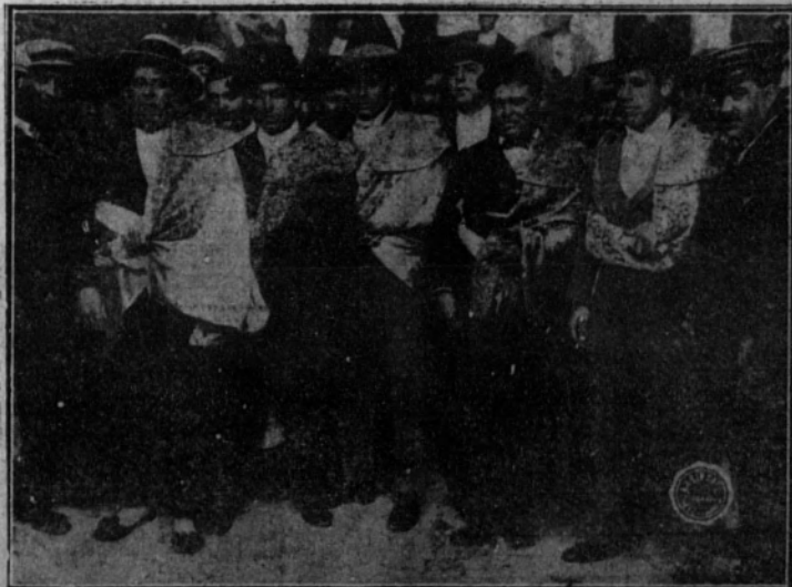
Los picadores que actuaron de espadas, antes de salir al ruedo.