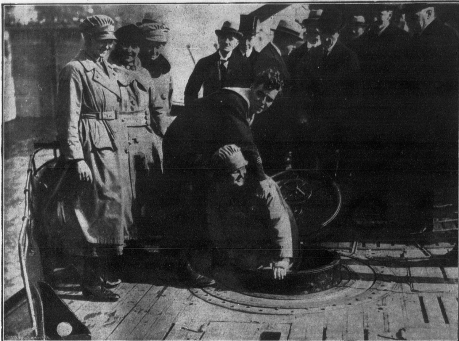
El famoso submarino mercante alemán «Deutschland», que fué atacado por la flota inglesa a su regreso de América, y actualmente en un dique del puerto de Londres. Nuestro grabado representa el momento de salir por la escotilla de cubierta a una señorita que visitó el interior del barco. Dicho submarino es constantemente visitado por el público londinense.

INGL TERRA. - E GRAN SUBMA INO MERCANTE "DEUTSCHLAN", EN EL PUERTO DE LONDRES