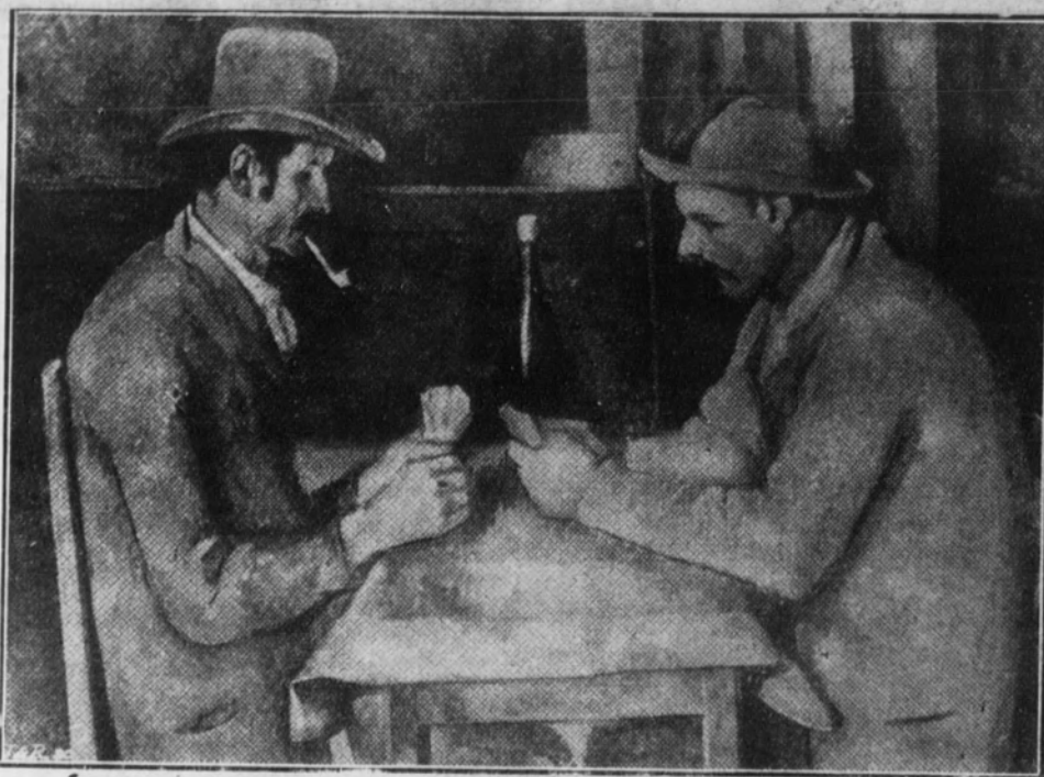
«Los jugadores», por Paul Cézanne.

En Bilbao estaban—más o menos bien representados, pero siempre fuertes y dominantes—Van Gogh, Cézanne y Gauguin, los tres faros del arte moderno; estaban también dos de los jefes del impresionismo: Monet y Renoir; estaban, por fin, cada cual con la fuerza de su originalidad, los jefes del Salón de Otoño y del Salón de los Independientes, desde Denis, recogido y fervoroso, hasta Van Dougen, estrepitoso, en quien no creemos. Y estaba Picasso que, por su auto-