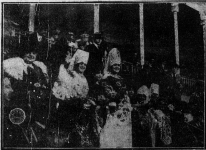
Las tiples del teatro Apolo y Reina Victoria, que presidieron la fiesta.