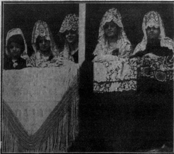
El palco presidencial

A beneficio de las viudas y huérfanos de los tripulantes del «Valbanera», se celebró ayer tarde en la plaza de Vista Alegre una benéfica.