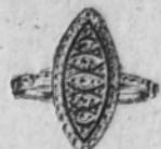
Núm. 2.905.—Ptas. 425