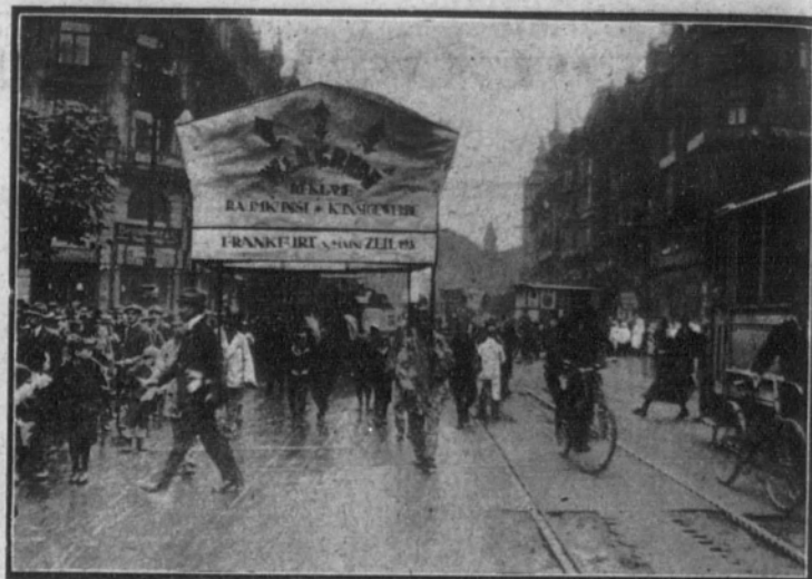
Portadores de una gran farola anunciadora circulando por las principales calles de la población.