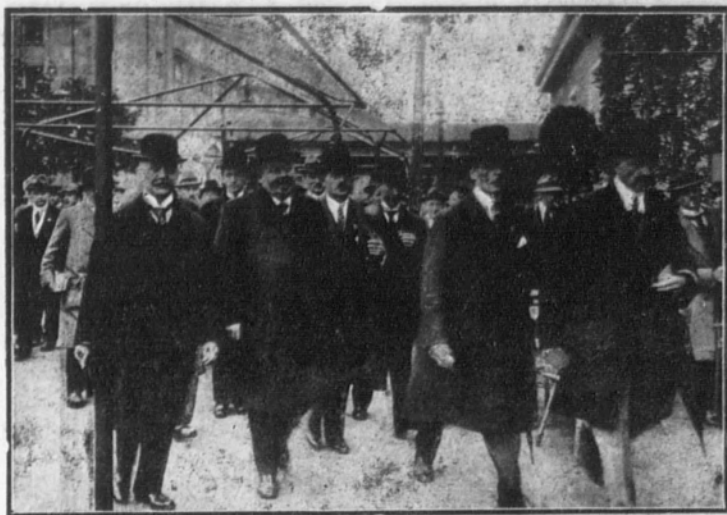
El presidente del Gobierno alemán, Ebert, acompañado de otras personalidades, recorriendo los principales lugares de la feria.