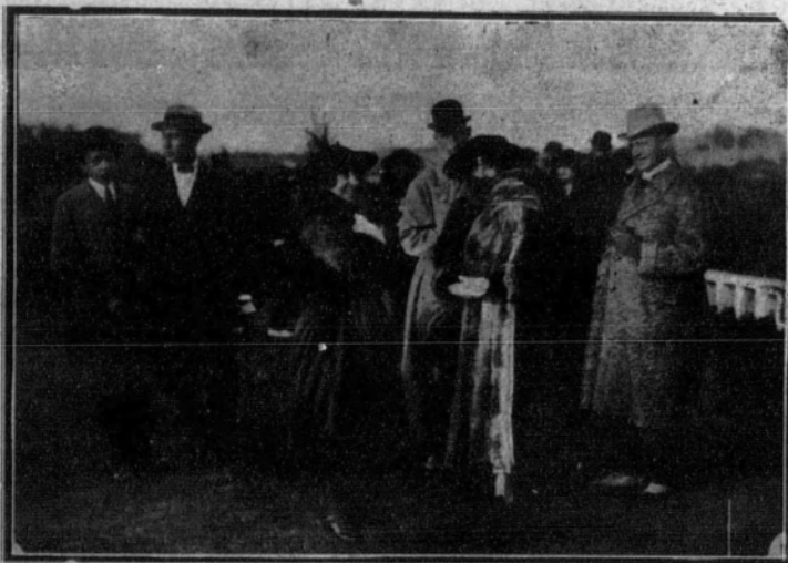
En el «estando».