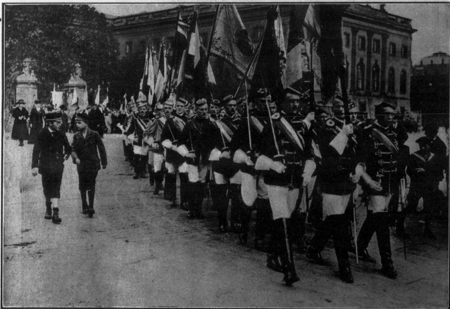
La revolución alemana no parece haber operado un gran cambio en las costumbres teutonas. El 2 de octubre los estudiantes berlineses, para festejar el aniversario de Hindenburg, desfilaron en masa, con sus banderas y con los uniformes que acostumbraban a usar antes de la guerra, por las calles de la capital del Imperio.