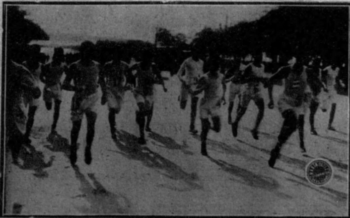
Salida de los corredores del «cross-country», celebrado ayer mañana, y que patrocina la Sociedad Cultural Deportiva.