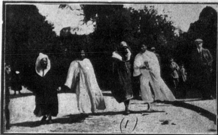
El kaid de Beni-Messauar, El Alaxi Zel-lal (1), jefe de gran prestigio, que vino al frente de las importantes cabilas de Beni-Messauar y Yebel-Hebid a hacer acto de sumisión.