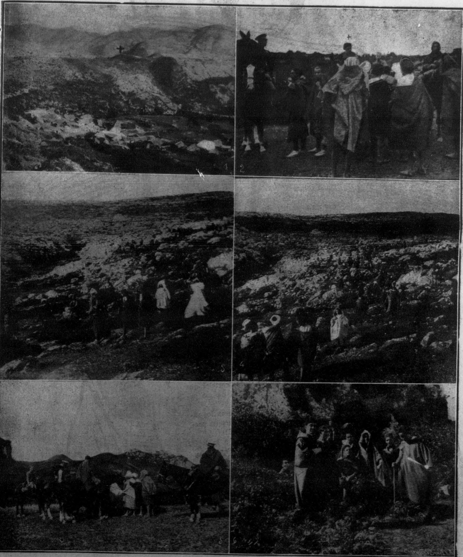
1. El poblado de Barba-Lonzal, ocupado por las fuerzas españolas y que entregó todo el armamento. + Lugar donde se puso la nueva posición de Guadalupe.—2. El coronel Sanjurjo + interrogando a un grupo de prisioneros.—3. Grupo de moros de las cabilas del Haus.—4. Los moros del poblado de Beni-Salen guiando a la columna del coronel Sanjurjo para penetrar en las cabilas del Haus.—5. Prisioneros moros hablando con el coronel Sanjurjo.—6. Grupo de oficiales de Regulares de Tetuán, en el poblado del Kuf.