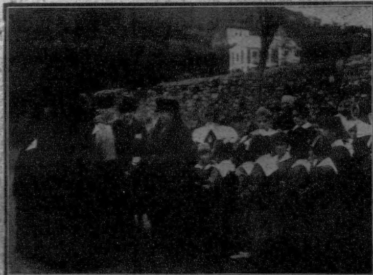
Su Majestad la Reina doña Maria Cristina hablando con la madre superiora del Asilo de huérfanos de San José de la Montaña.