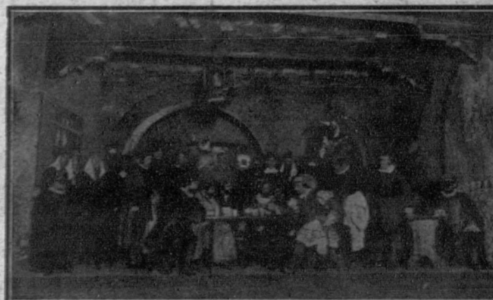
Una escena del primer acto de «Don Juan Tenorio», cuyas representaciones se anuncian con gran solemnidad.