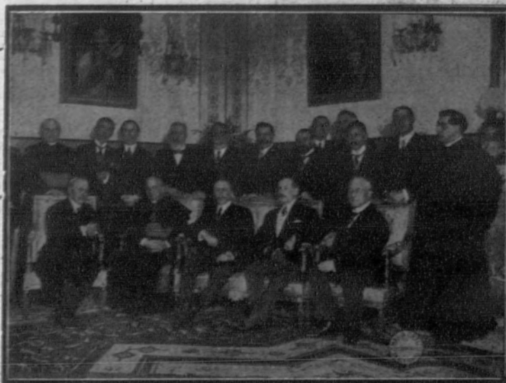
Concurrentes al rancho de despedida ofrecido al embajador de Argentina por el Nuncio de Su Santidad, monseñor Ragonesi.