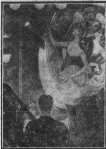
En el "Moulin Rouge" (Le chahut)

Porque Seurat quiso razonar su intuición de artista y establecerla sobre bases que juzgaba inquebrantables, y porque formuló sus razonamientos escribiendo—en 1889—una «teoría», explicando