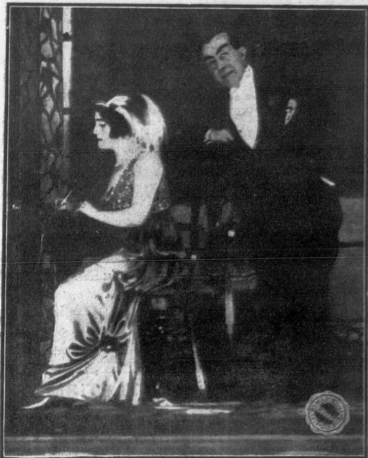
Una escena de la comedia «El diablo», original del célebre autor húngaro Franz Molnar, que se estrenó anoche.