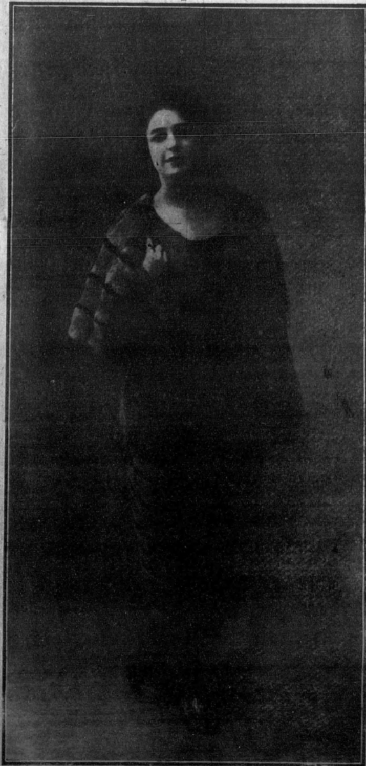
Carmela Ruiz Moragas, bellísima primera actriz del Teatro Español

Los Reyes de España asistieron anoche a la función del teatro His Majesty, recibiendo, tanto a la entrada como a la salida, calurosas muestras de simpatía por parte del público, mientras la orquesta interpretaba la Marcha Real española.