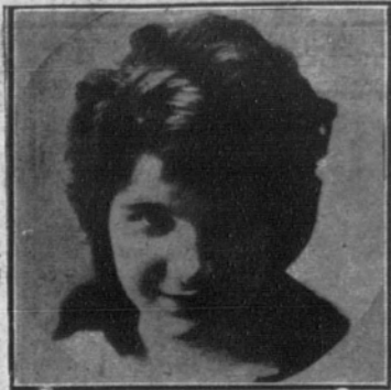
GLADYS HULETTE, hermosísima actriz americana, que obtiene señaladísimos triunfos en la pantalla.