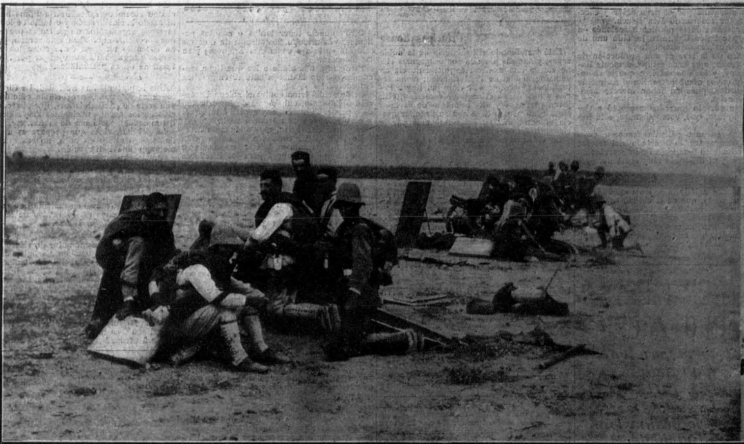
Artillería haciendo fuego para proteger el avance de las fuerzas de Infantería.