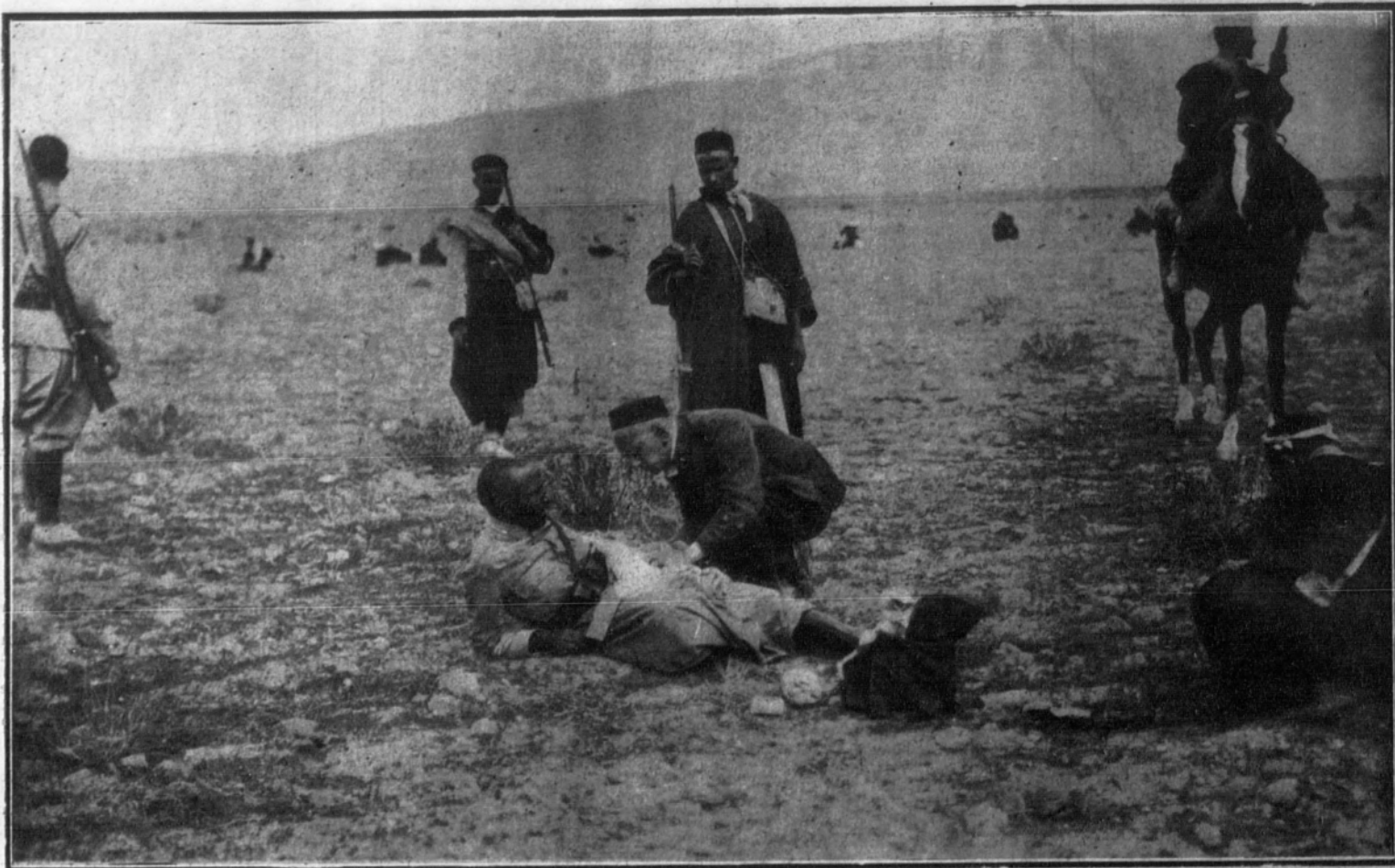
Médico de la Policía Indígena practicando la primera cura a un sargento moro herido en un muslo.