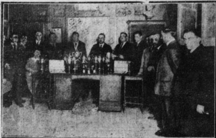
Reparto de premios en el Real Moto Club.