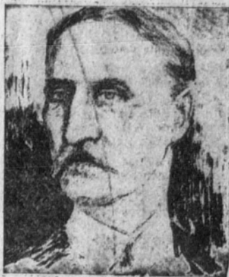
Mr. Bonar Law

lica—permítasenos—esta aparente paradoja—no puede tener efectividad si no es con la plena confianza de todo un pueblo. ¿Conseguirá Mr. Lloyd George procurársela? En la respuesta a esta pregunta va