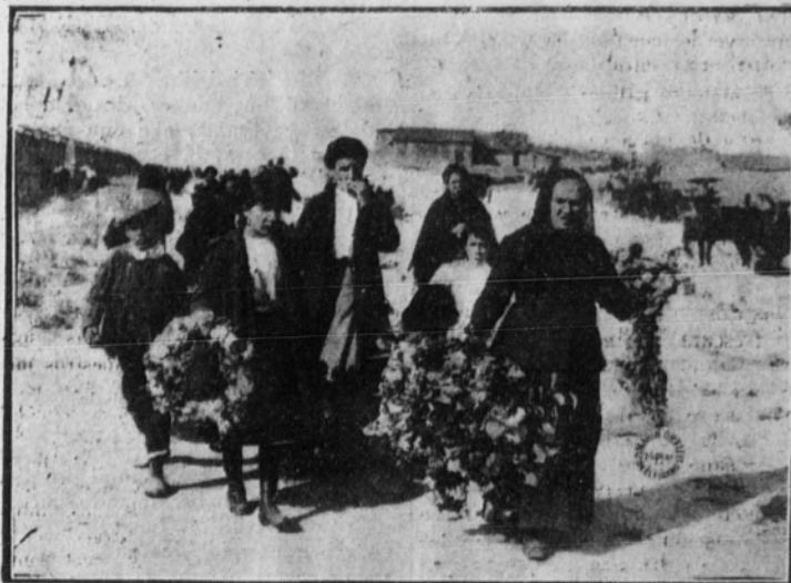
Camino del cementerio

vimos a, oír lo mismo. Venciendo nuestra interior resistencia, nos aproximamos hacia el sitio de donde parecía partir aquella voz. Un rumor. Después oímos claramente, sin duda alguna, y sin que viésemos a nadie, la voz patética de un hombre, que, a la vez, debía sollozar: —¿Lo ves? ¿Lo ves ahora, loca? ¿Quién te quería de verdad?... ¿Quién es el que después de muerta te quiere?... ¡Aquellos...! ¡Malditos! ¡Sólo querían tu cuerpo! ¿Sabes? ¡Y tú no lo comprendías! ¿No hice bien en matarte, en matar lo que sólo querían los otros? ¿Quién te habla ahora más que yo?... Luego, la persona que así hablaba sollozaba con más fuerza, y daba besos apasionados, seguramente sobre alguna lápida. Repuestos de la impresión—pues ya no había duda de que era en el patio vecino—, volvimos adonde estaba el guarda, el cual nos explicó que, quien de tan patético modo se expresaba, era un hombre, muy conocido en Madrid, que había matado de un tiro a su mujer, por celos, en un café céntrico, y que era sobrino de un gran poeta, ya muerto. —Ese hombre—nos dijo el guarda—, después de matar a su mujer, se volvió como loco, y no vive más que pensando en ella. Aquí