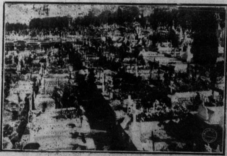
Rindiendo el tributo a los muertos

PARIS 1.—Comunican de Cahors que Malvy ha dirigido una carta a sus electores exhortándoles a que cumplan sus deberes de republicanos y expresando su sentimiento por no encontrarse entre ellos.