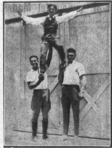
El estupendo actor Douglas Fairbanks y el famoso boxeador Jack Dempsey—que últimamente ha tomado parte en una gran película—sirven de puntales al incommensurable «Charlot».

Pero, señor: ¿por qué cada uno no hace en su salón todas las mejoras que le vengán en gana sin preocuparse tanto del vecino, como ocurre en cualquier parte?