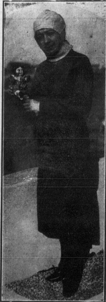
JUANA HERVEUX, célebre aviadora francesa que se encuentra actualmente en Norteamérica dirigiendo una Escuela femenina de aviación.