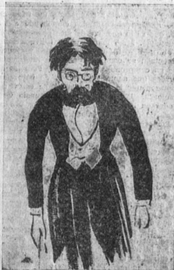
El maestro Fernández Arbós abrumado por una ovación

Completaron el programa una interesantísima Danza de gnomos , del maestro Morera; el Idilio de Sigfredo , de Wagner, y un canto po-