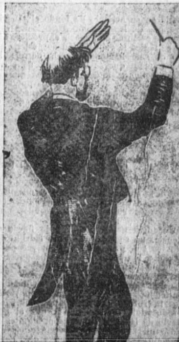
El maestro Fernández Arbós dirigiendo en un "forissun"

Gustó más que ninguno el último tiempo por su vigor y por la energía de sus sonoridades. Hay en esa composición una pasmosa emotividad, definida en vagos y angustiosos anhelos, en pasiones contenidas y dolorosas. Al final de