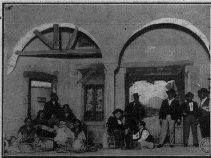
Una escena del estreno de «Rosario la Canastera».