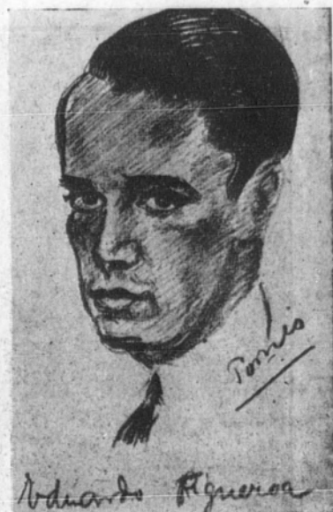
Campeón de España, peso ligero.