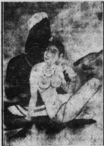
«Civa y Parvati» (Copia de un fresco de Ajanta, por Nanda Lal Bose)

Con la India sucede, aún en mayor escala, lo que con España: el arte que se precia de reproducirla o que pretende in-