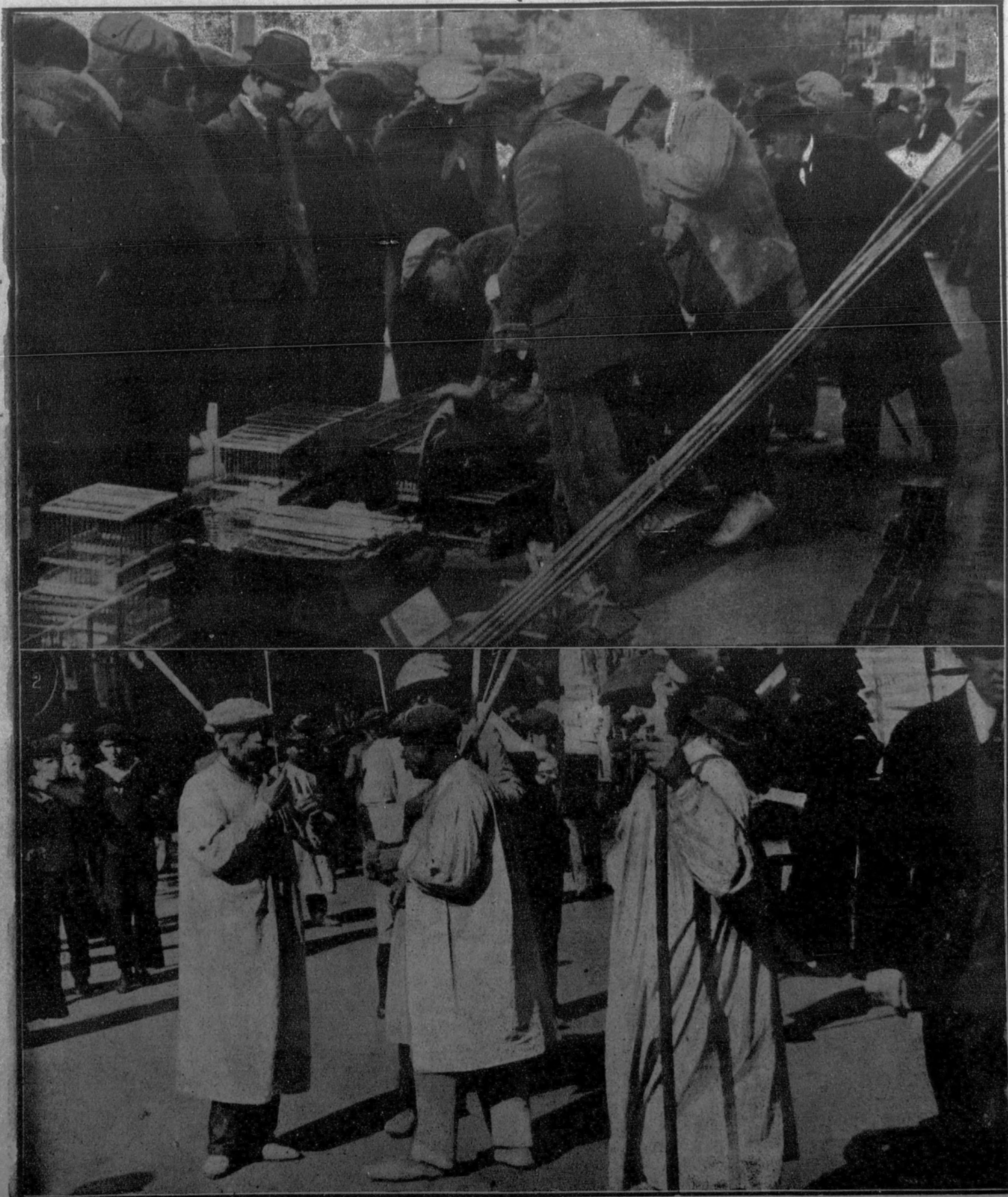
1. Los obreros parados visitan el mercado de jilgueros. 2. Los clásicos «emblanquinadors» (enjalbegadores) esperando, como de costumbre, a los clientes.

BARCELONA.—“EL LOCK-OUT”: LA VIDA ES NORMAL EN LAS RAMBLAS