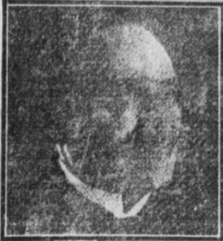
M. Hugo Haase

Hugo Haase era una de las figuras de mayor relieve de la Socialdemocracia antes de la guerra. Excelente orador, cáli-