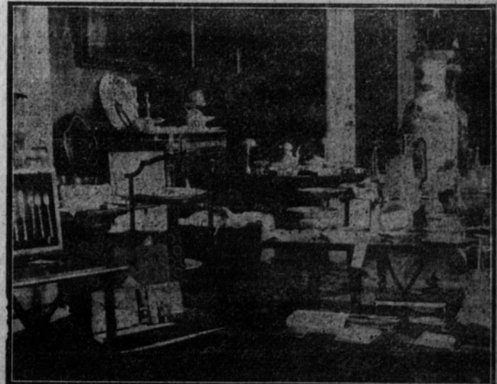
Los regalos recibidos por los novios, expuestos en uno de los salones de casa de los marqueses de Villamayor