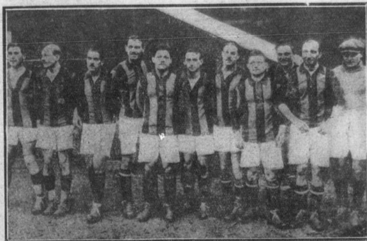
Los jugadores de la Liga parisina que consiguieron una resonante victoria sobre los ingleses en los partidos Londres-Paris, recientemente celebrados.

licas» y deportivas, que hacen una labor social que tiene abandonada el Estado.