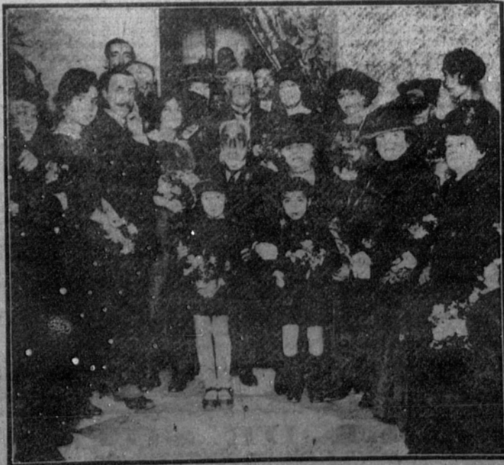
Toma de posesión por la esposa del general Luque, del cargo de presidenta honoraria de la sección de damas de la Asociación de pensionistas, jubilados y retirados de España

Séptimo. Se facultará a la Comisión ejecutiva a dar estado parlamentario si hiciera falta para conseguir la efectividad de los acuerdos tomados.