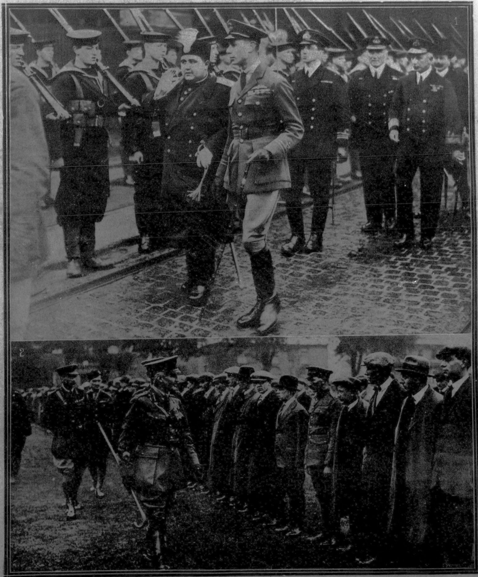
1. El Shah de Persia, al desembarcar en Dover (Inglaterra), pasa revista a la Guardia de honor, acompañado del Príncipe Alberto. 2. El general Horne, uno de los jefes de ejército durante la guerra, pasando revista al regimiento territorial de Cambridge.