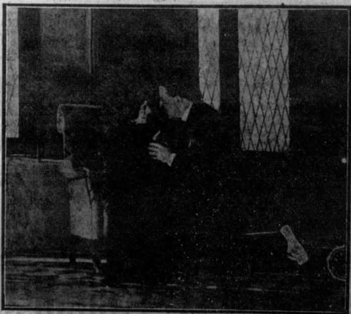
TEATRO DE LA PRINCESA.—Una de las escenas del estreno de esta noche titulado «Leonarda»