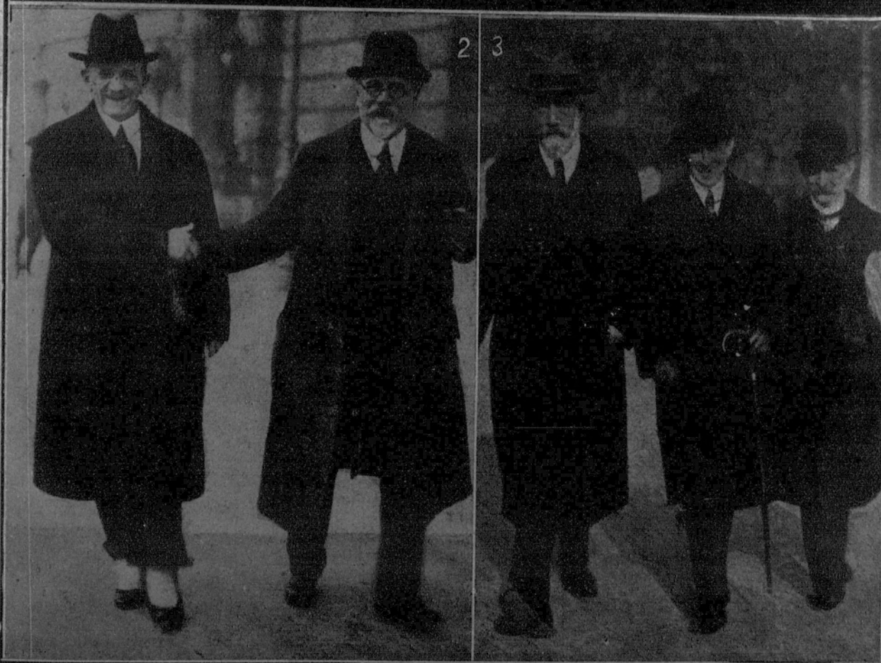
1. La Comisión investigadora de las responsabilidades de la Guerra. 1), ministro Gotheim; 2), presidente Warmuth; 3), señora Pfütz; 4), reverendo doctor Maxen; 5), doctor Sinzheimer; 6), profesor Schücking; 7), doctor Cohn, diputado socialista minoritario.