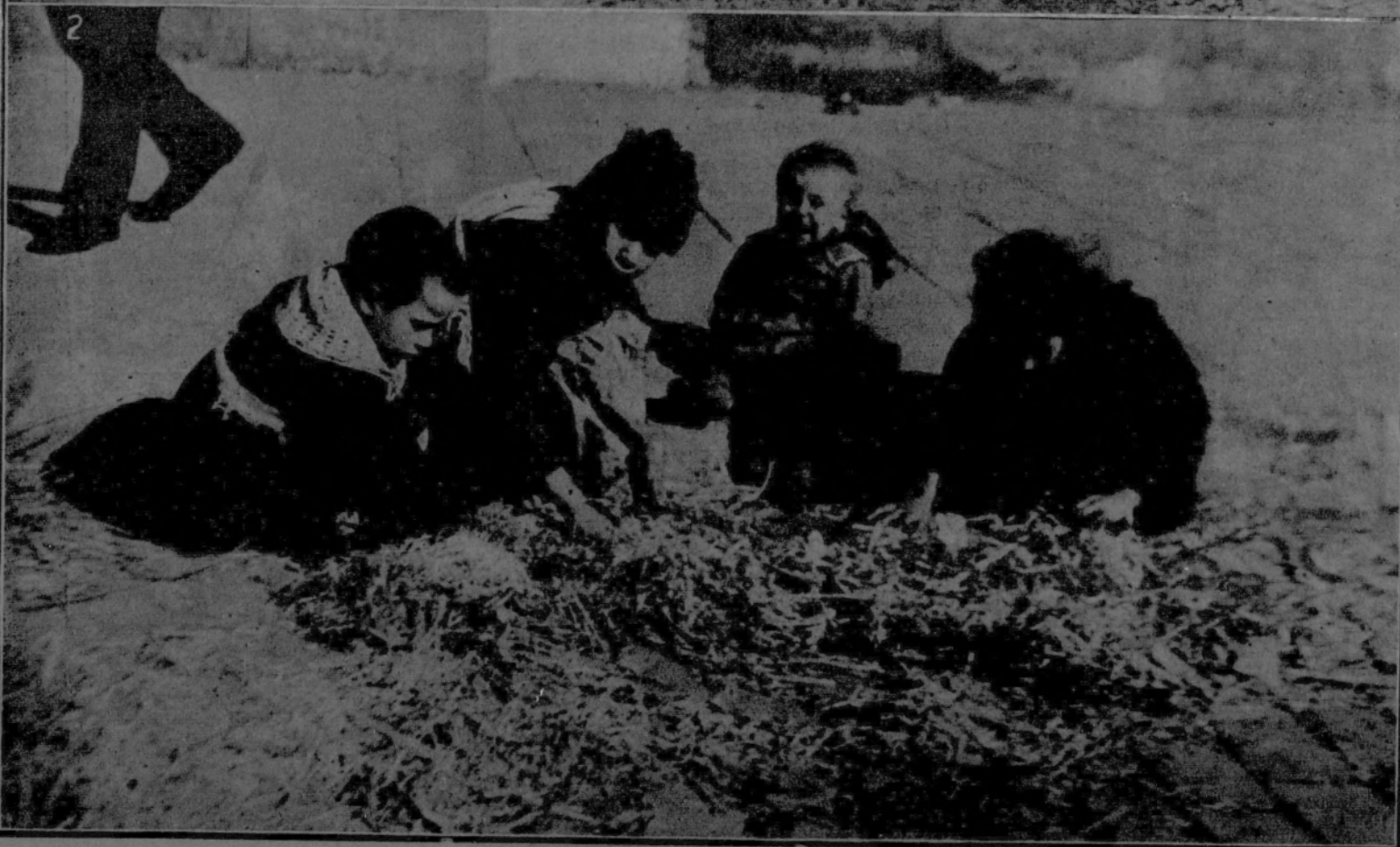
1. El Ejército y el pueblo, confraternizando.—2. Las inocentes víctimas del «lock-out».