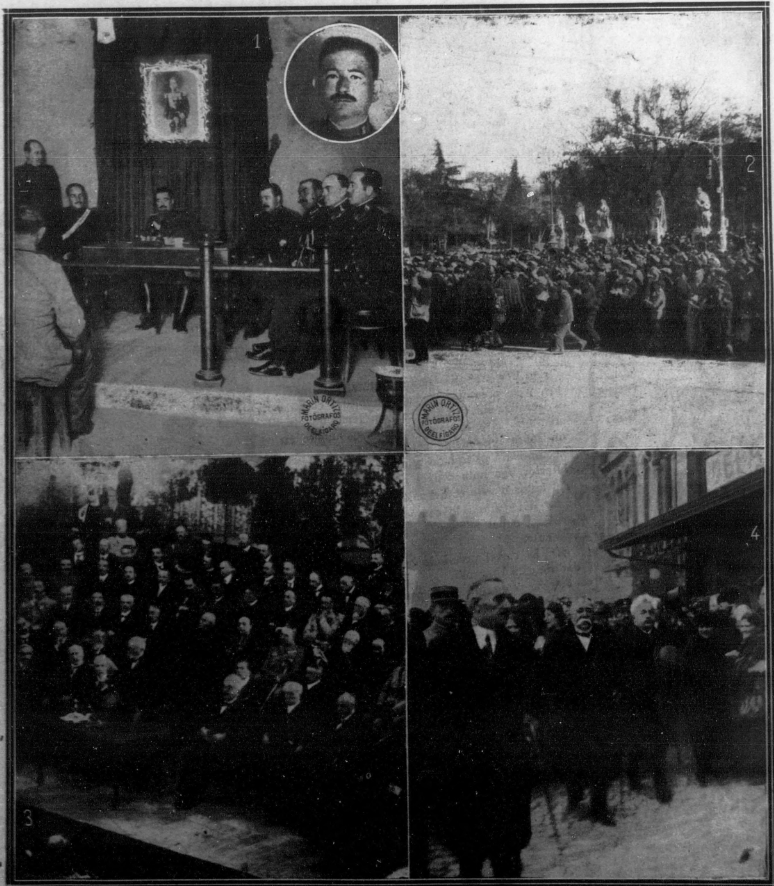
1. Consejo de guerra celebrado para formar causa al guardia civil Dionisio García Sánchez, por matar a dos torerillos y herir gravemente a otro, en el correo de Irún. (Ex el óvalo, el retrato del guardia).—2. El público en la plaza de Oriente aclamando al Rey al llegar a Palacio.—3. En el palacio de fiestas de Estrasburgo M. Clemenceau pronuncia su discurso-programa para las elecciones.—4. M. Clemenceau vitoreado por la multitud al salir de la estación de Estrasburgo.