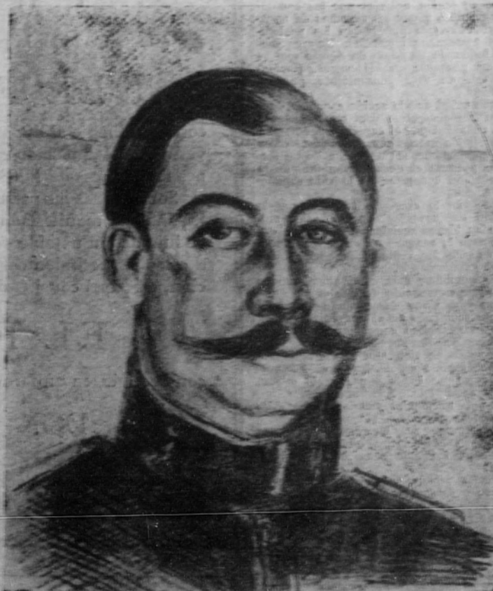
(Dibujo de P. Maura)

autoridad suprema en tierras hispanas de África, nos estaba esperando desde los cuarteles de la tarde.