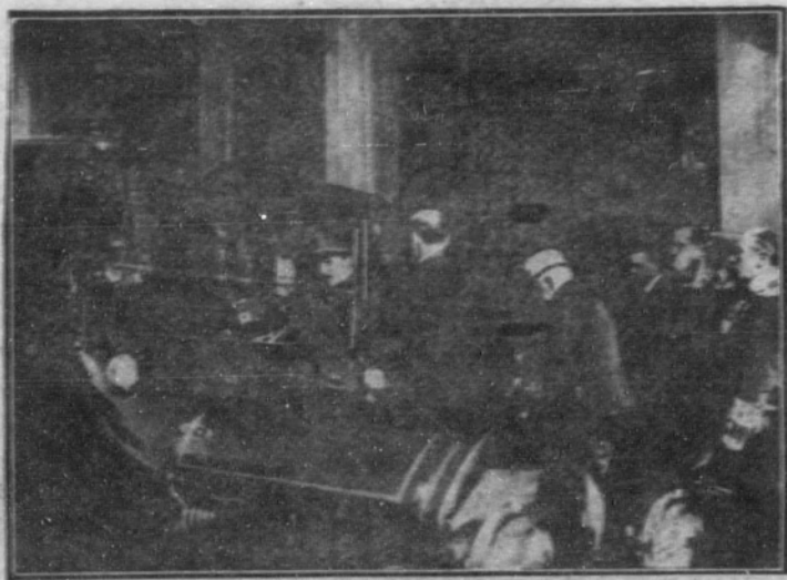
S. M. el Rey al salir de la estación del Norte a su llegada a Madrid

Habló breves momentos de la situación de Barcelona, mostrándose inclinado a