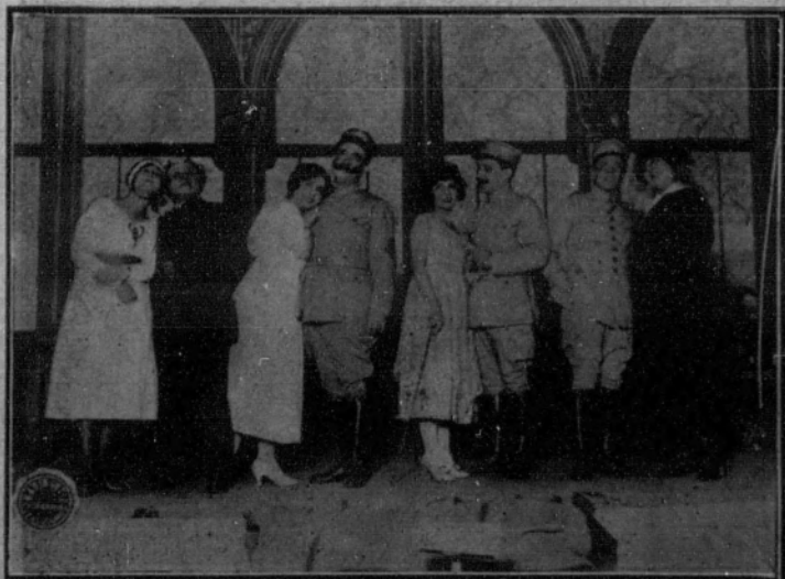
Una escena de la opereta «El As», estrenada con gran éxito.