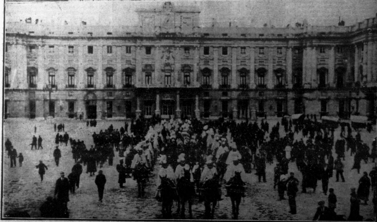
1. El nuevo embajador de Italia, barón de Pasceiotti, con el presidente del Consejo y el ministro de Estado, en la Presidencia.—2. La comitiva al salir del Palacio Real, después de la entrega de credenciales a Su Majestad.