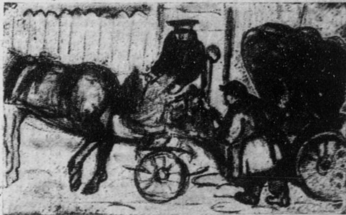
¡A las Ventas, cochero!

—¿Qué? ¿Diga, por toda su respetable familia!