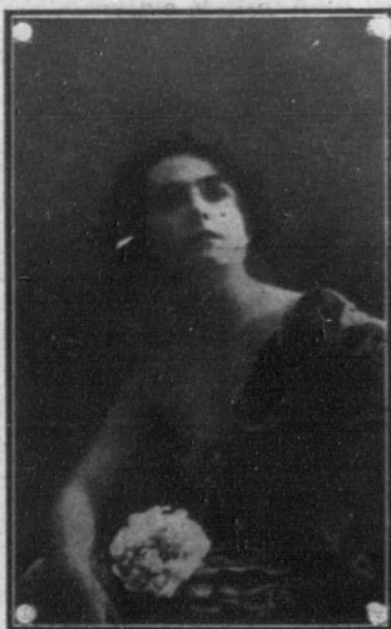
FRANCESCA BERTINI, bellísima actriz italiana, admirada y muy querida del público español.

«Viva la libertad!». Pero quiere su aciaga suerte que una tía le legue una cuantiosa fortuna, que le será entregada precisamente el día de su matrimonio, y hétenos a Virginia comprándose un marido en buen uso para dejarlo sin contemplaciones a las puertas de la dicha. La segunda parte del programa no le sale tan bien, por la viveza de él, que consiguió conquistar su corazón.