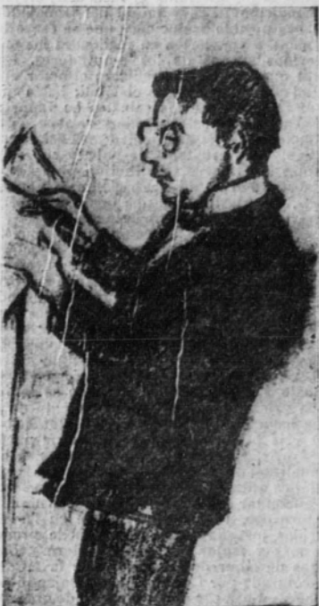
El maestro Pont

a sí mismo y al público precisamente con esta Vedova Scaltra que tanto nos regocijó ayer tarde en Eslava.