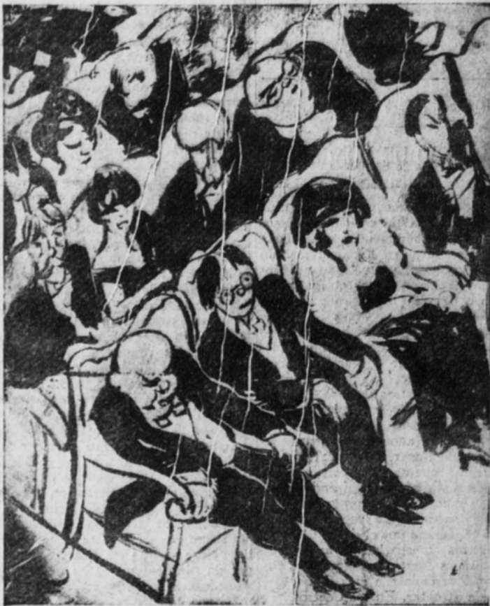
El melómano somnoliento

Desde luego, por su belleza, por la perfección de líneas, por el sonrosado de las mejillas; además, por la expresión.