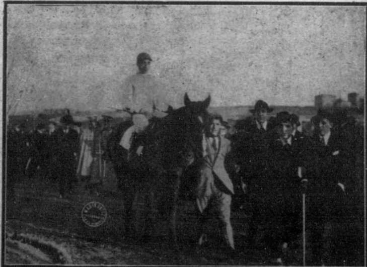
«Kopek», ganador del premio «Lisbon», de 10.000 pesetas, después de un interesante recorrido en la cuarta carrera.