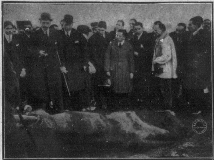
Su Majestad el Rey viendo el caballo «Los Caireles», de D. Jenaro Parladé, muerto en plena carrera al chocar contra una barra de madera. El «jockey» resultó con ligeras contusiones.

AYER, EN EL HIPODROMO.- ULTIMO DIA DE CARRERAS