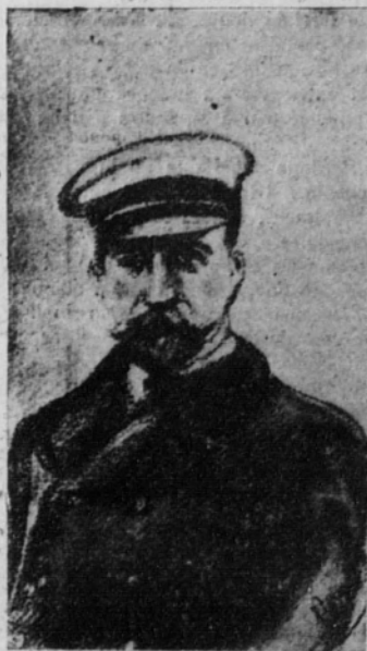
El Príncipe de Mónaco