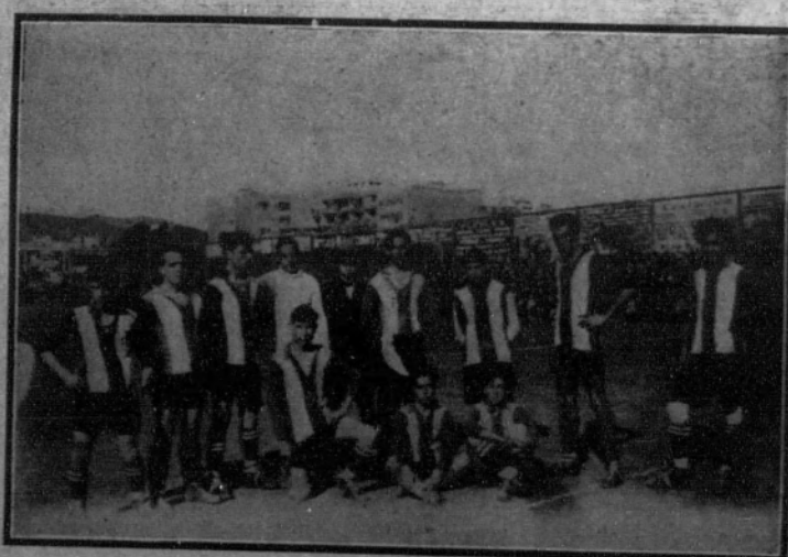
Real Club Deportivo Español.—Segundo equipo.