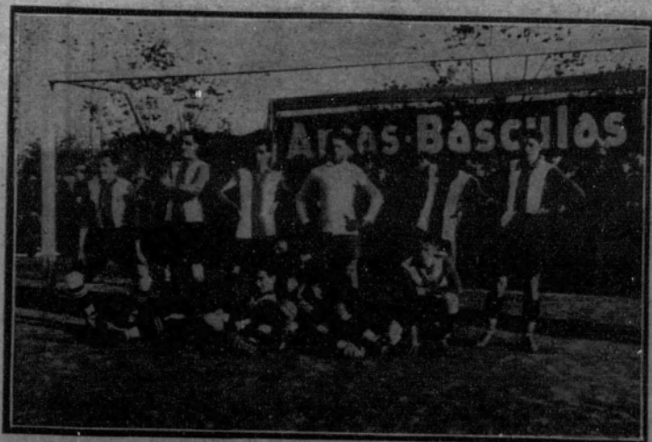
Real Club Deportivo Español.—Primer equipo.

El juego fué reñidísimo, sobresaliendo «Goalkeeper», sevillano, que fué sacado en hombros. Hubo empate.