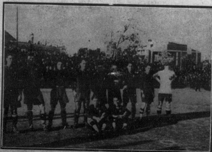
Primer equipo Barcelona, vencedor por dos "goals" a cero contra el Español.

La Junta directiva encarece la urgencia de los envíos con objeto de poder incluir los trabajos en el «Anuario 1920», que a primeros del año próximo repartirá la Sociedad.