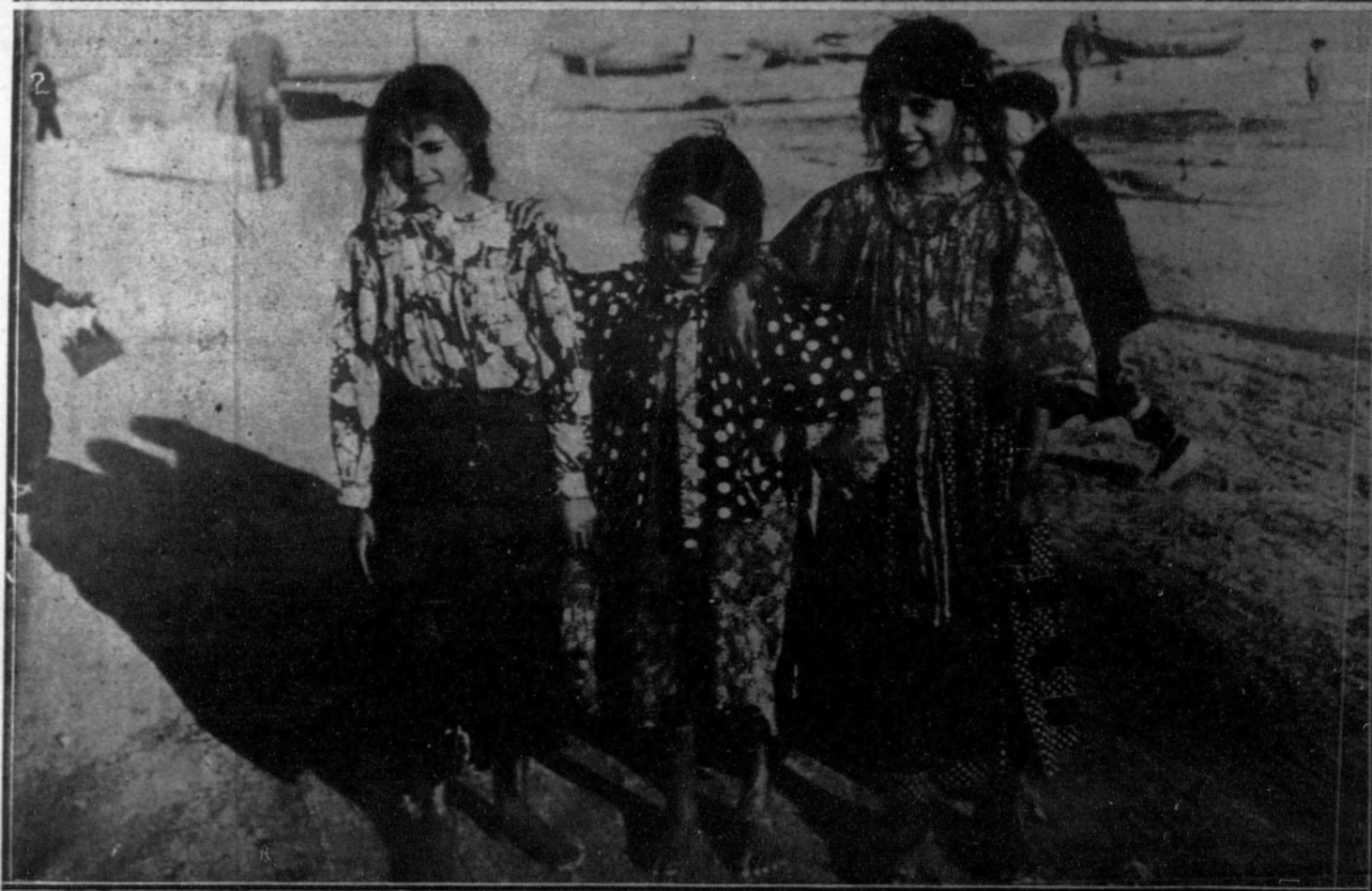
1. El Príncipe de Mónaco, presidiendo en el Senado, la Conferencia internacional para la exploración científica del Mediterráneo.—2. Pintoresco grupo de gitanillas en Arenys de Munt (Barcelona).