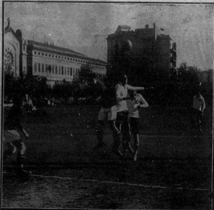
Un momento del encuentro entre los primeros equipos del Internacional y el España.

equipos, en el campo de Atocha (San Sebastián), y sus productos se destinarán a beneficio de la Caja de Previsión de los jugadores, que ha sido creada por iniciativa del presidente de la Federación guipuzcoana para con sus fondos hacer frente a los gastos inherentes a los accidentes que, dolorosamente, van siendo frecuentes en nuestros campos, ya que los Clubs, por negligencia o economía, apenas si se han preocupado de dotarles con una póliza de seguro.