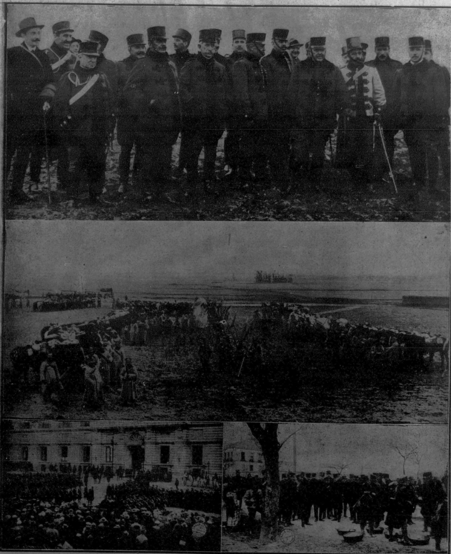
1. El capitán general con su Estado Mayor y ayudantes en las maniobras.—2. Los lanceros de la Reina acampados a 12 kilómetros de Madrid, esperando órdenes.—3. Desfile de las tropas frente a Palacio.—4. El capitán general presencia la comida de los soldados.