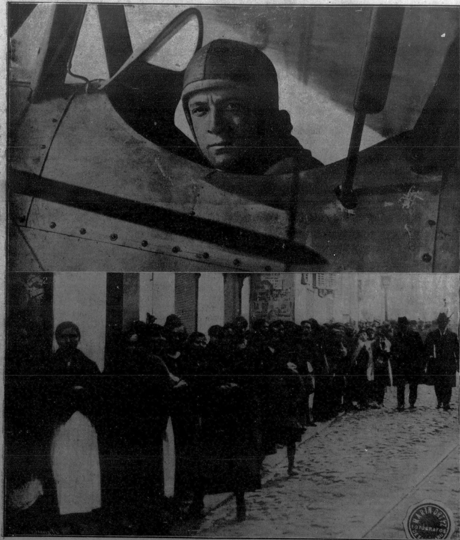
1. La muerte del aviador Bourgeois en Lisboa. Fotografía tomada en el aeródromo de Amadora, pocos momentos antes de emprender el intrépido aviador el vuelo que le costó la vida.—2. La huelga de panaderos de Madrid. A la puerta de las tahonas de los barrios obreros se formaron ayer largas colas, esperando el despacho de pan.