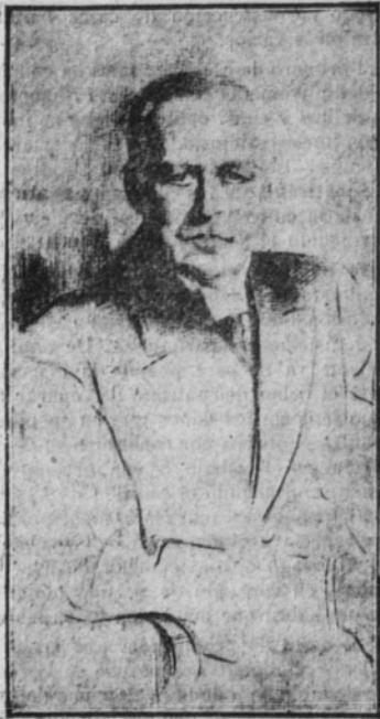
El general Ludendorff

Si la Comisión de encuesta toma en serio las abrumadoras acusaciones que recaen sobre Ludendorff, la consecuencia sería el procesamiento del general autócrata de Alemania durante la guerra. Porque detrás de la Comisión está el Tribunal sancionador. Bien lo saben los que