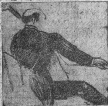
Casals, en el concierto de Dvorak

Hay en esta obra una prodigiosa ligereza