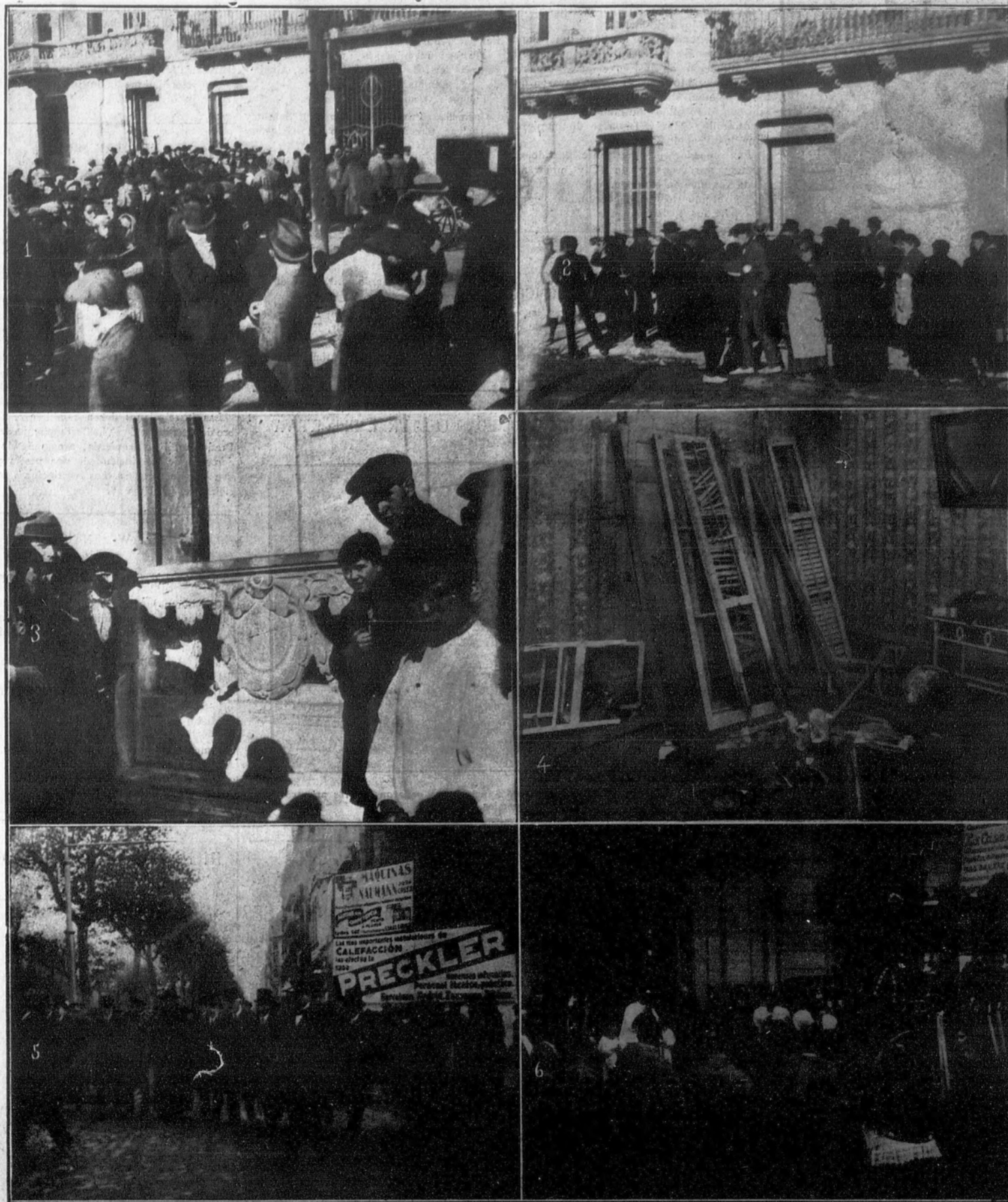
Explosión de un petardo en la Gran Vía Diagonal: 1. La multitud congregada, pocos momentos después de la explosión.—2. Un grupo de curiosos examinando los destrozos.—3. Desperfectos ocasionados en el balcón donde estalló el petardo.—4. Estado en que quedó una de las habitaciones interiores del taller de modista de las hermanas Puig Domènech, después de la explosión. La puerta marcada con una cruz da al balcón donde fué colocado el explosivo.—Entierro de la madre política del alcalde, señor Martínez Domingo: 5. Las autoridades presidiendo el duelo.—6. El féretro a la salida de la iglesia parroquial.