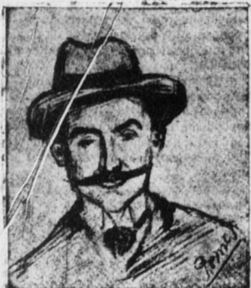
Pedro Muñoz Seca

Se han polarizado en el sentido más epícu-