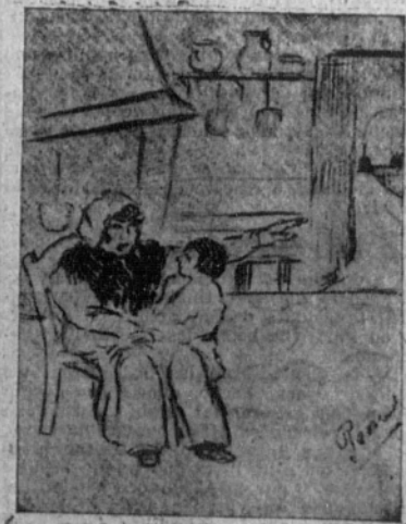
La linda criada gustaba especialmente de hablar de brujerías...

de las mujeres, que brillan tal que llamas. Los campesinos ribereños llevan una vida feliz. Se visten con elegancia y sus mujeres toman parte en sus trabajos. El dinero es raro, ciertamente, pero la ropa