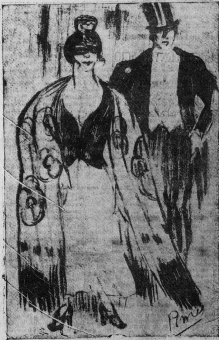
A la salida del baile

Y el señorito baila. No sólo domina el tango argentino, sino que domina el