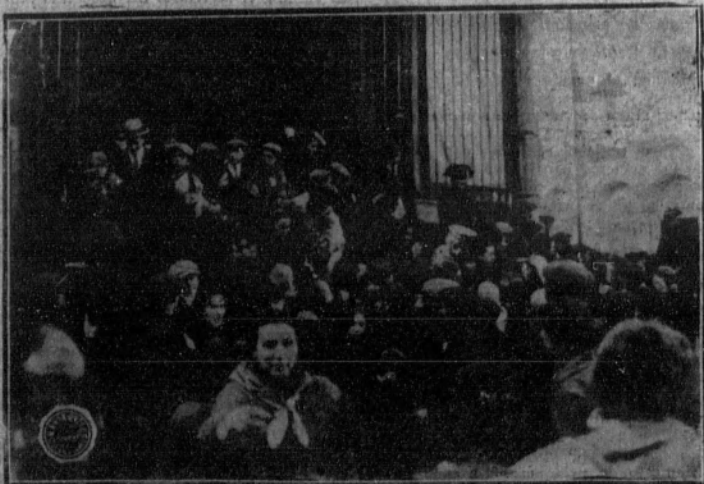
La gente saliendo de la plaza de la Cebada después de adquirir pan.