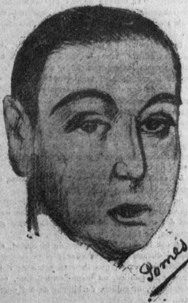
El «Noy del Sucre».

Comprendimos en seguida la magnitud de la decisión patronal, y, si bien en la