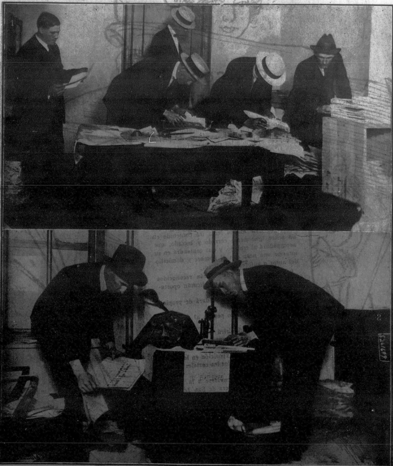
Dos escenas del registro verificado por la Policía norteamericana en el domicilio de la «embajada» que la República rusa de los Soviets había establecido en Nueva York.