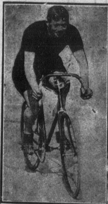
BARTHELEMY, el famoso ciclista francés.