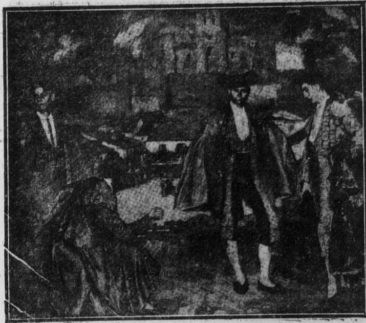
«Toreros de pueblo», por Zuñiga

A la España de pandereta y caja de pasas había de suceder el otro aspecto, no menos sensacional, del españolismo: la España negra de las saetas para todos los rit-