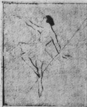
Todo en el aire

se en una llama que ondula y se mueve, y siempre acondicionada por las leyes del ritmo.