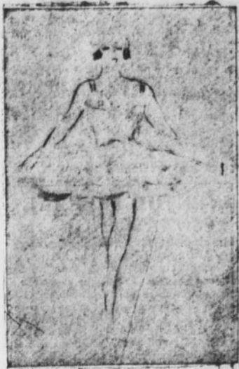
Sólo con las puntas

Ella surgió al cabo, y sólo con su aparición nos convenció de que nos hallábamos ante un ser que bailaba porque estaba destinada a bailar desde los primeros tiempos de la creación. Era una víctima de la fatalidad que le obligaba a metamorfosarse.