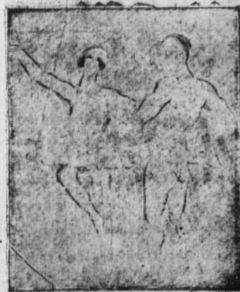
Un diálogo sin palabras

tribuyó con sus telones aparentemente dispartados al triunfo de alguno de los números de los bailes rusos.