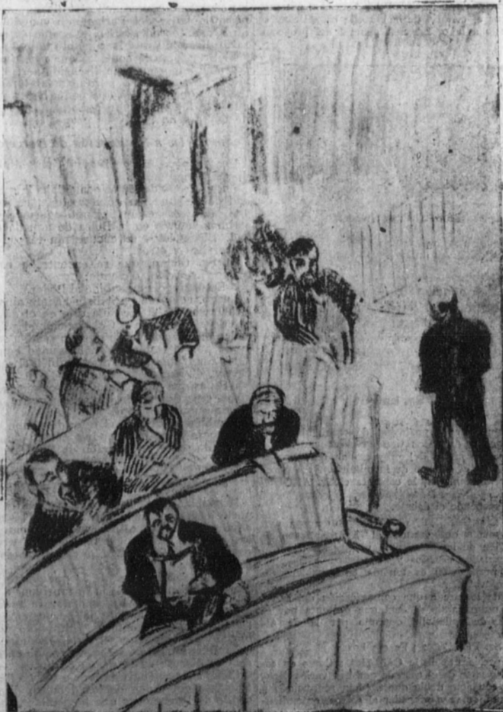
El banco azul

El ideal sería poder constituir un depósito flotante, teniendo constantemente barcos con trigo desde la Argentina a España; pero esto no es posible. La carencia de barcos es tanta, pese a los buenos deseos del Comité de tráfico marítimo, que algunas veces se tienen que hacer contratos de trigo por radiotelegrafía para poder aprovechar la salida de algún barco. Yo tenía facultad y autoridad completa para contratar libremente trigo, y, sin embar-