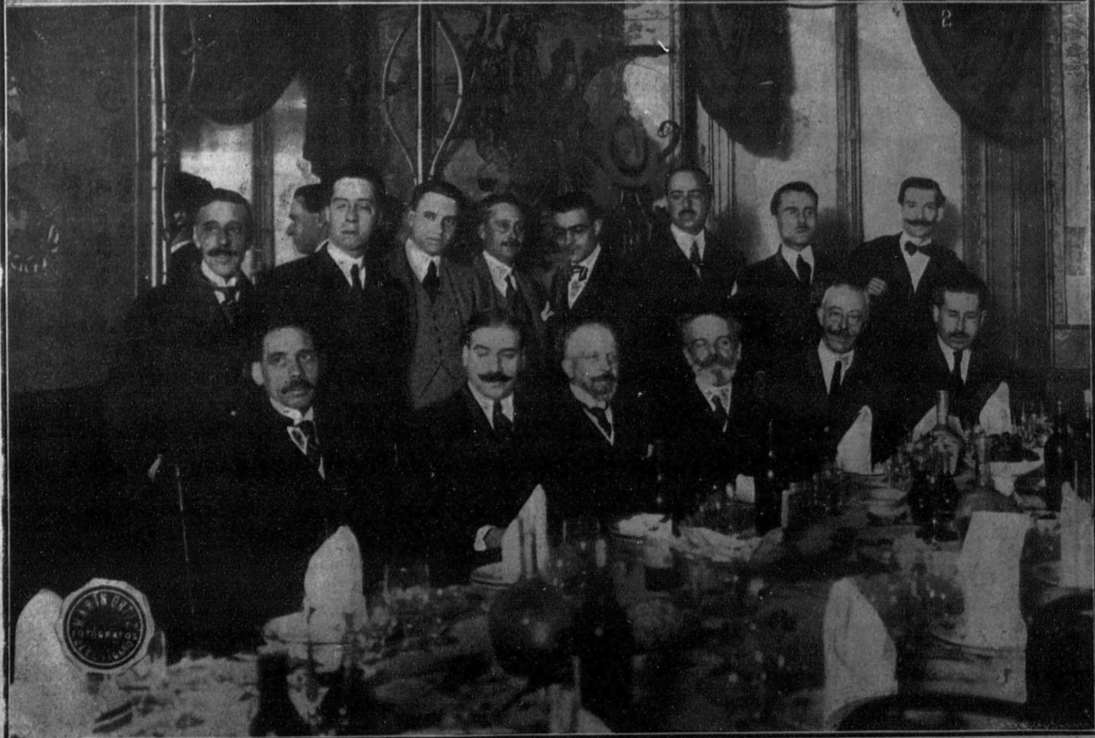
1. Su Alteza Real la Infanta Isabel en la inauguración de la Exposición organizada por los pensionados en El Paular.—3. Banquete con que los organizadores del Congreso de Ingeniería obsequiaron a la Prensa.