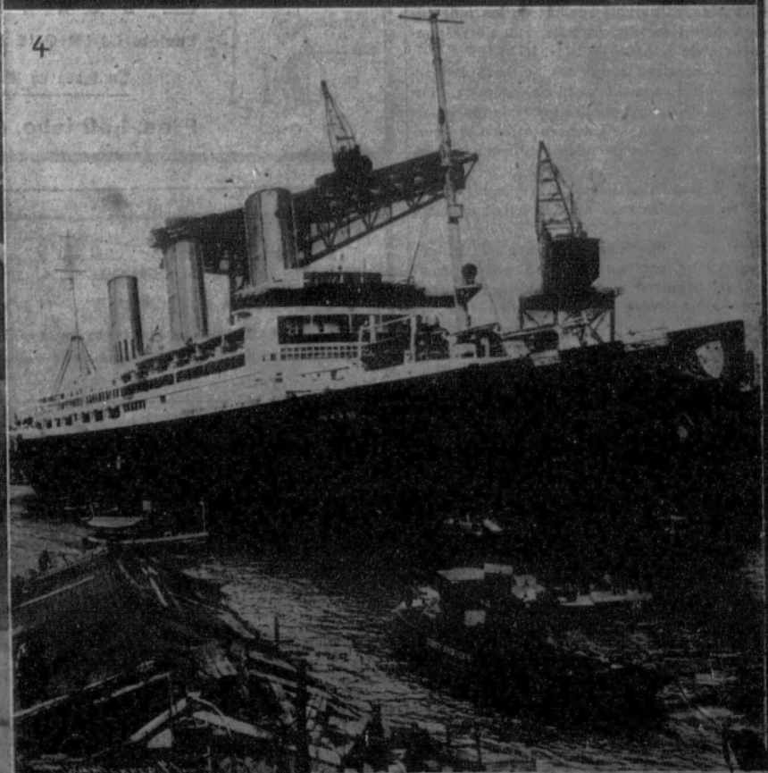
1. Las tropas rumanas en la ciudad de Budapest.—2. Una gran fiesta gimnástica en el «stadium» de Berlín, en la cual tomaron parte 10.000 estudiantes.—3. El general Dupont en Polonia.—4. El paquebot alemán «Waterland», que pertenece en la actualidad a los aliados y que lleva el nombre de «Leviathan».