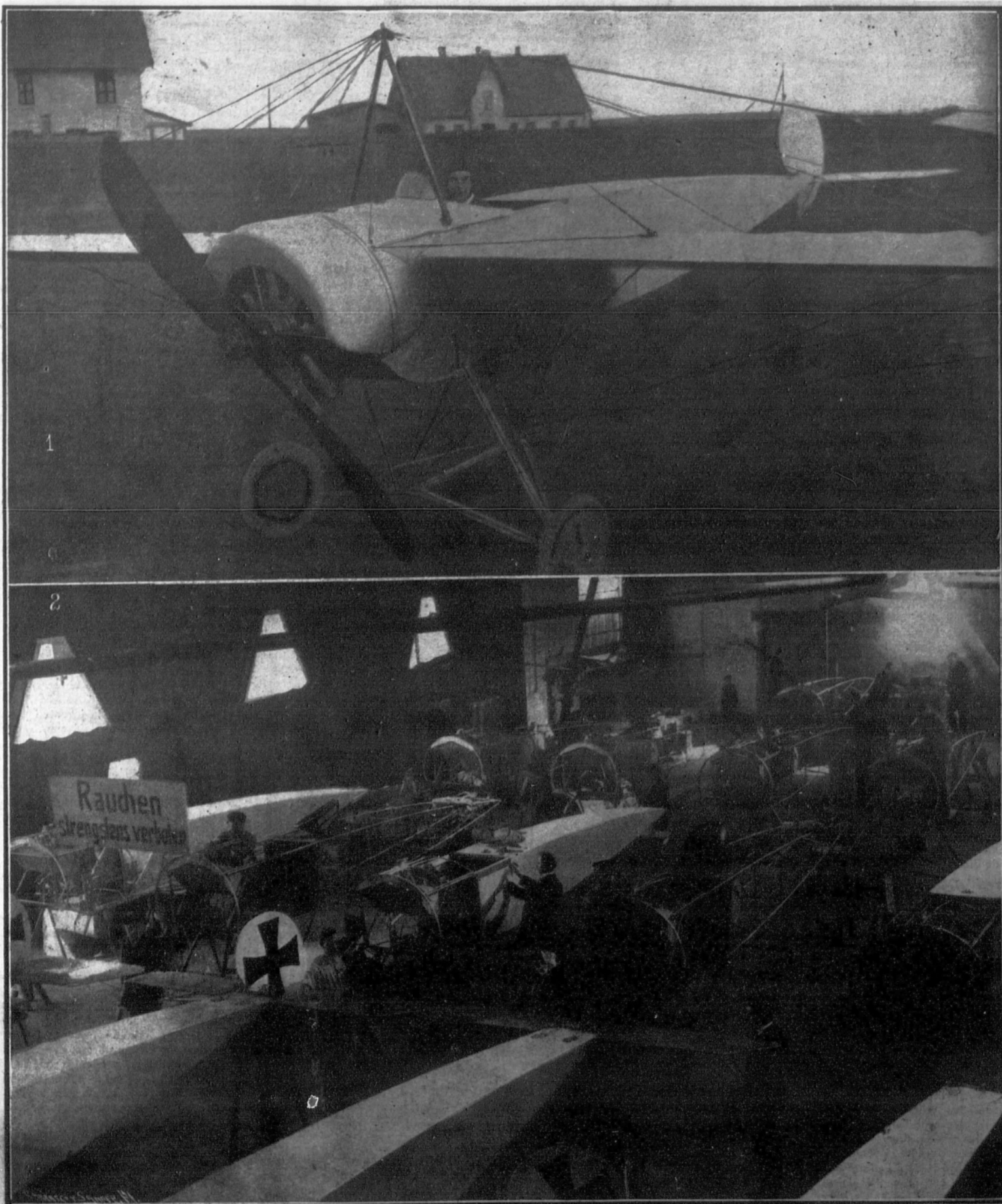
Los «nuevos ricos»: 1. El aviador Fokker, en su más rápido aeroplano, dispuesto para fugarse a Inglaterra con toda su fortuna, evaluada en cien millones de marcos. 2. Aspecto del «chall» de montaje de los establecimientos «Focke», en Schwerin.