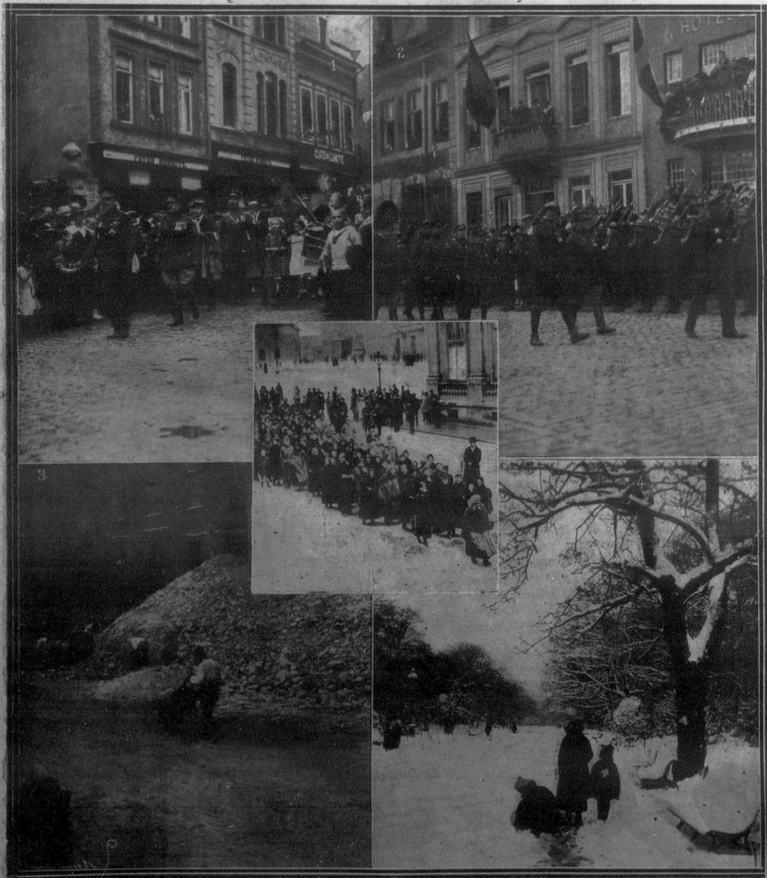
1. BELGICA: Llegada del general Michel y de su Estado Mayor a la plaza de Malmédy.—2. Revista de las tropas por el general Michel.—3. ITALIA: Demolición del palacio Caffarelli, que fué sede de la Embajada alemana en Roma.—4. PARIS: Niños jugando con la nieve en el Parque Monceau.—BUDAPEST: Las mujeres sin trabajo recorriendo las calles, después de la partida de las tropas rumanas.