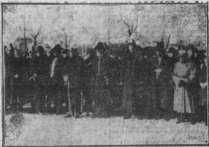
La presidencia del duelo

CASA SERNA HORTALEZA, 9, tienda.-Tel. 53-51 M.