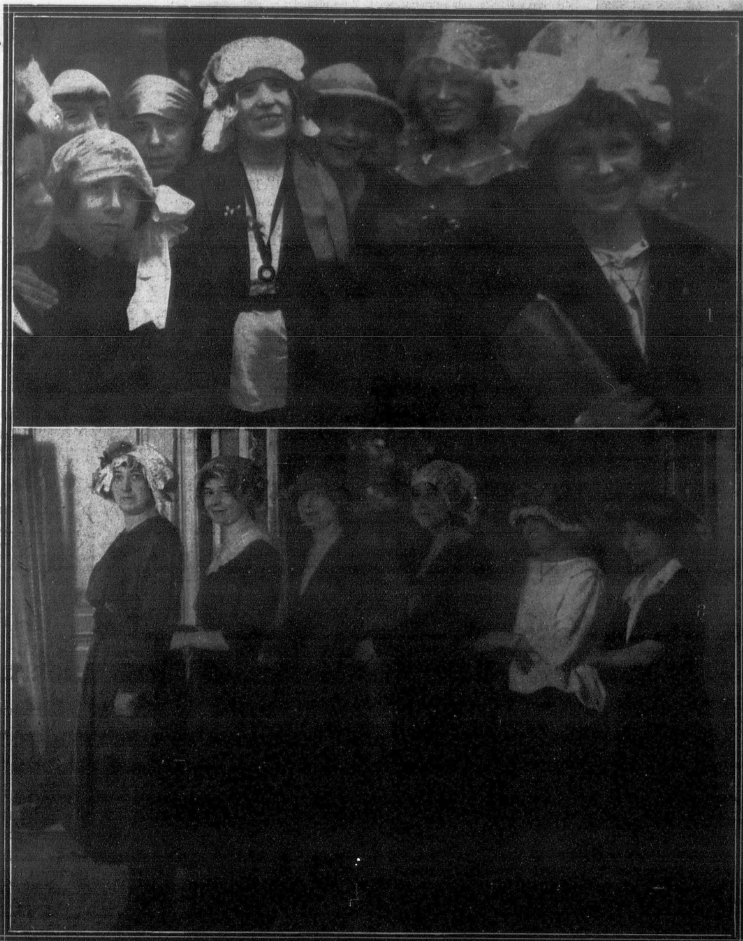
Todos los años las modistillas de París que no quieren quedar solteras celebran ruidosamente la fiesta de Santa Catalina.—1. Grupo de «midnettes» tocadas con el tradicional gorro, en la «rue de la Paix».—2. Las «Catalinas» de una gran casa de costura parisién.