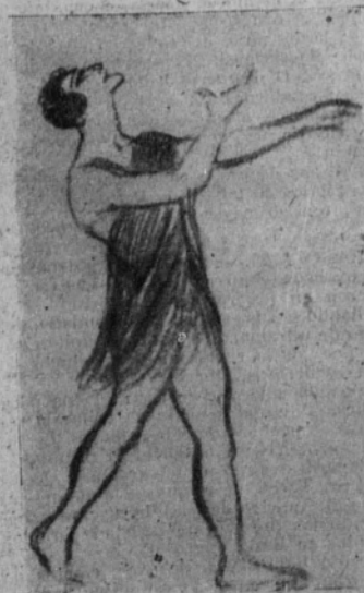
El protagonista del "ballet" de anoche