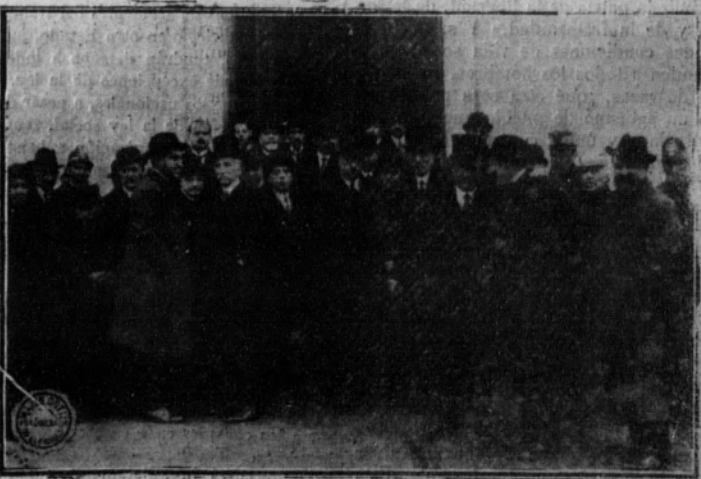
Grupo de personalidades que asistieron al acto

En cajas distintas se depositan aquí am-