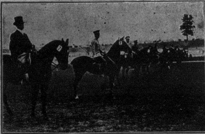
Concurso hípico en el «stadium» de Berlín.

Hoy, domingo, a las tres en punto de la tarde, y en el campo del Madrid, jugarán un partido de Campeonato los primeros equipos del Madrid F. C. y de la Gimnástica Española.