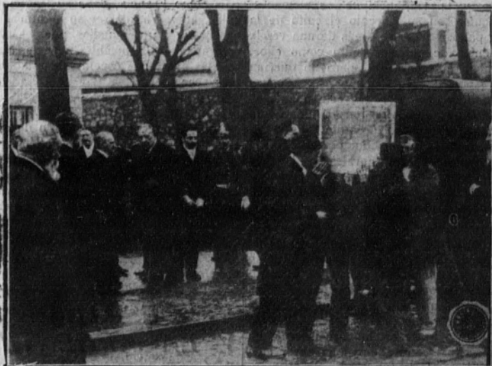
Momento de ser llevados los restos del inmortal pintor a la capilla de San Antonio de la Florida

Aparte, en caja de plomo, vinieron, al mismo tiempo que los de Goya, los restos de su amigo D. Martín Miguel de Goicoechea, nacido en Alsásua el 7 de octubre de 1755, muerto en Burdeos el 30 de junio de 1875, y en cuyo panteón familiar fue