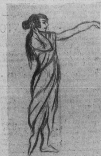
La protagonista del "ballet" de anoche

Teléfono de EL FIGARO 15-02 M. Apartado de Correos núm. 399