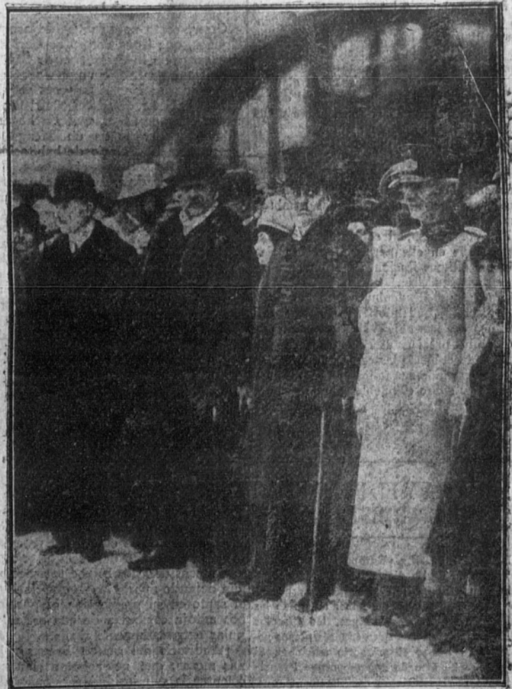
Los generales Hindenburg y Ludendorff y el ex ministro de Hacienda Sr. Helfferich.

Ludendorff no disfruta de la misma acogida. Las gentes piensan: Hindenburg hizo bien su oficio; merece respeto. Pero Ludendorff dominó la política; perturbó, con sus intemperancias y funestos errores, la obra prudente de las autoridades civiles. El es el culpable. Hindenburg está se-