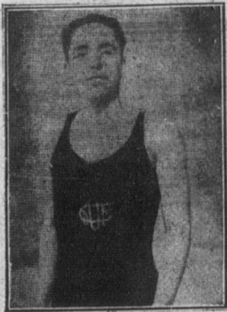
MAYAUD, el campeón francés de natación.