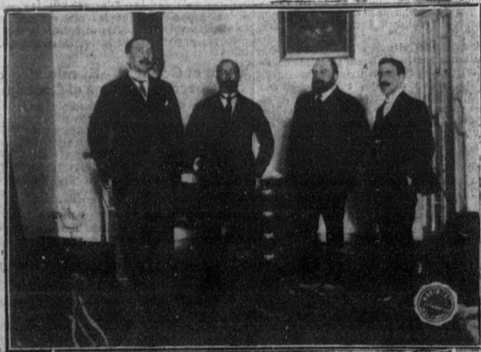
D. Ramón Menéndez Pidal, con varios amigos, después de la conferencia dada acerca de «La primitiva poesía lírica española».

Las negociaciones serán rápidas, y el Tratado será firmado en la segunda quincena de enero. Los amigos del nuevo Gobierno están firmemente decididos a hacer restablecer las antiguas fronteras de Hungría.—Radio.