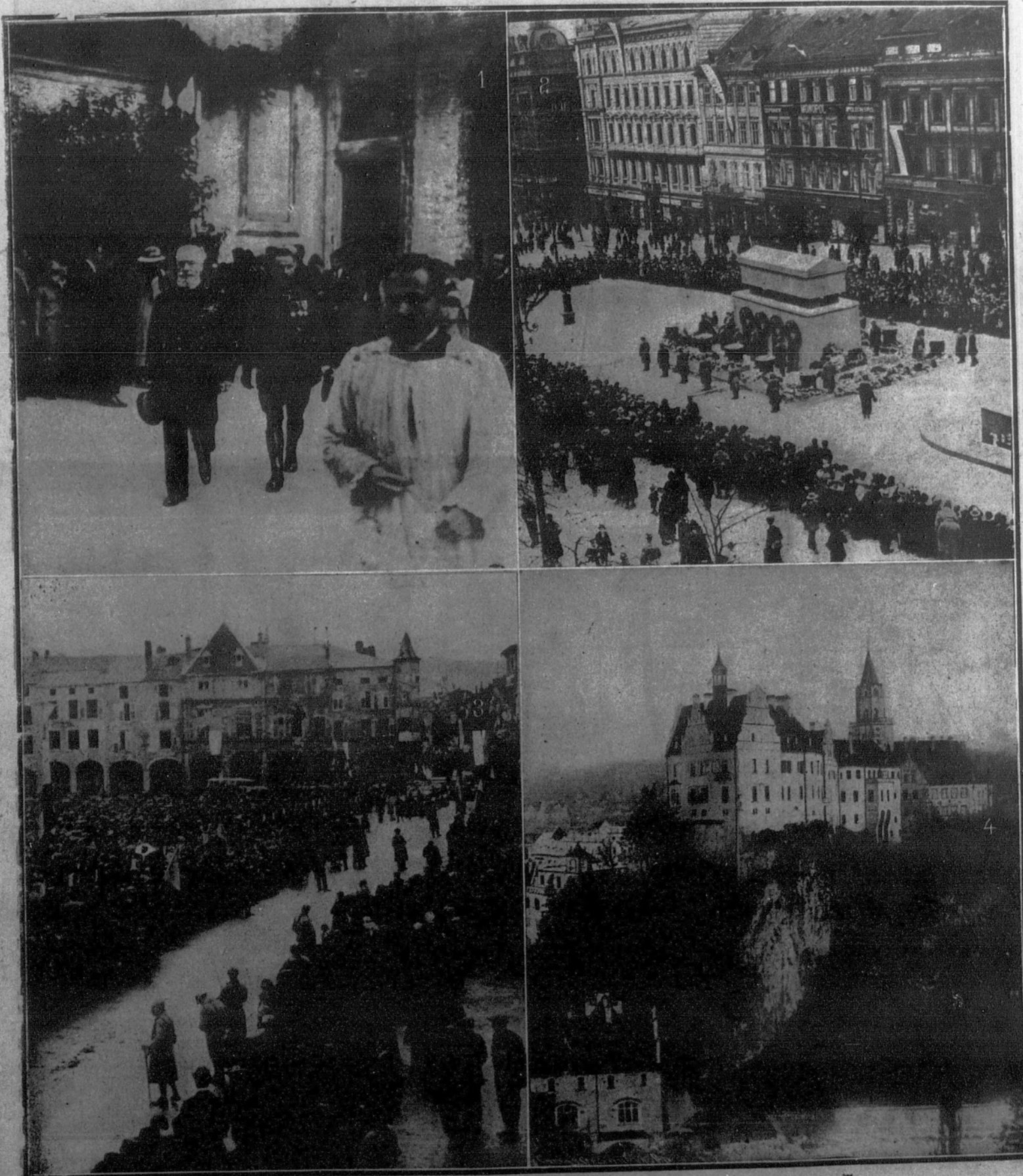
1. CONSTANTINOPLA: El vicealmirante De Bon, jefe de las fuerzas navales del Mediterráneo, saliendo de una ceremonia religiosa celebrada a la memoria de los soldados aliados.—2. PRAGA: Inauguración del monumento erigido en Praga en honor de los soldados checoslovacos muertos en defensa de la patria.—3. PONT-A-MOUSSON: La plaza del Ayuntamiento durante la ceremonia de entrega de la cruz de Guerra.—4. El castillo de Sigmaringen, retiro actual del ex Rey de Baviera.