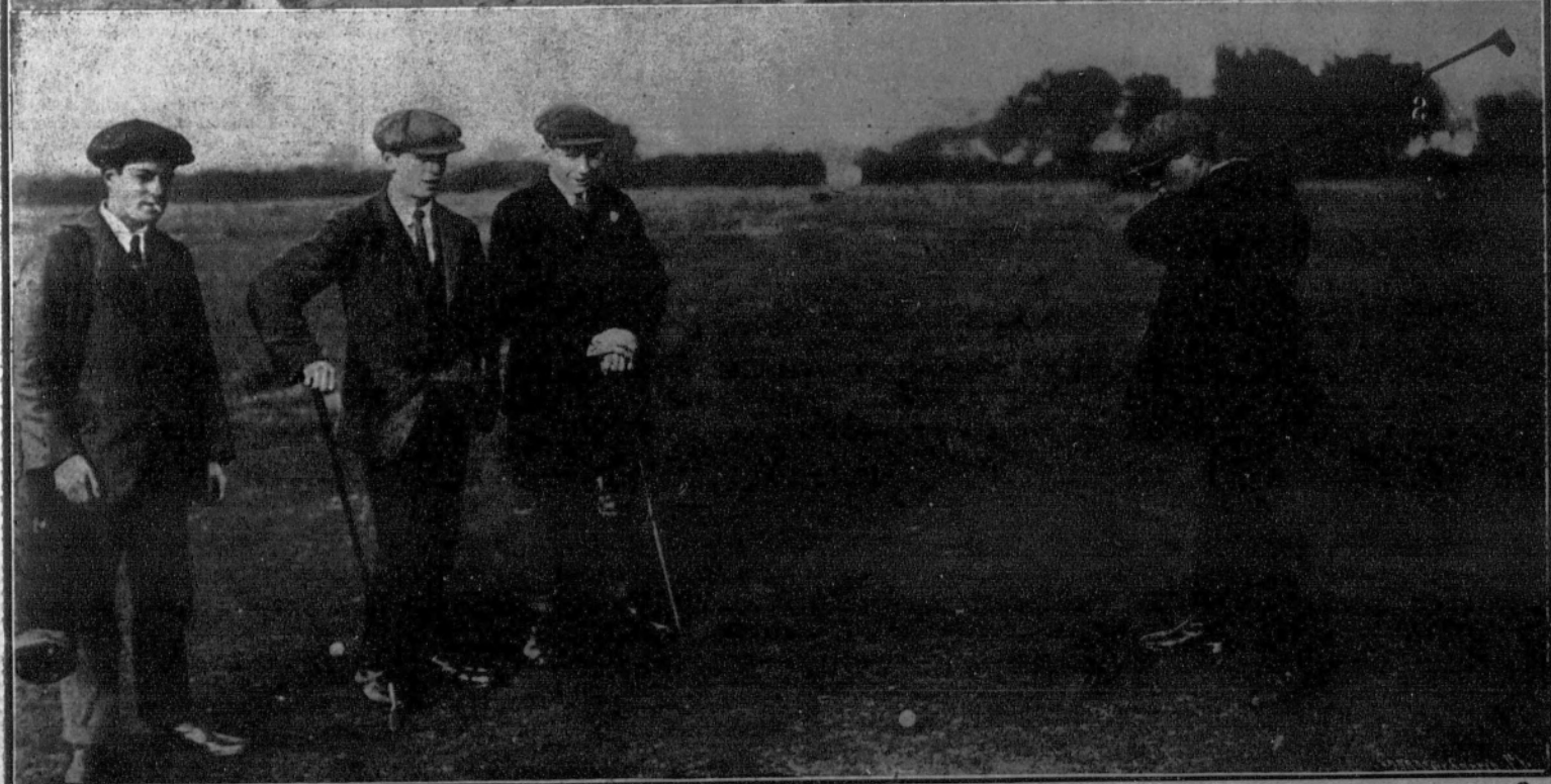
Una huelga en las cuadras inglesas. Mientras las mujeres cuidan de asegurar los servicios (1), los huelguistas entretienen sus ocios jugando al «golf» (2).