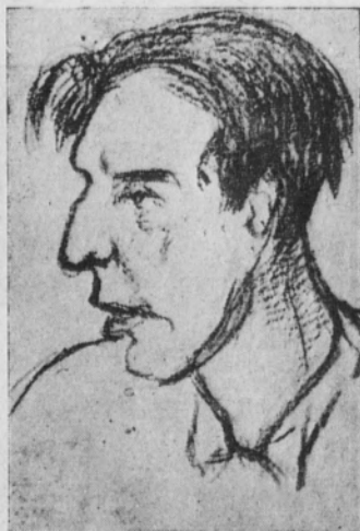
SANSINENEA, delantero del M. F. C.