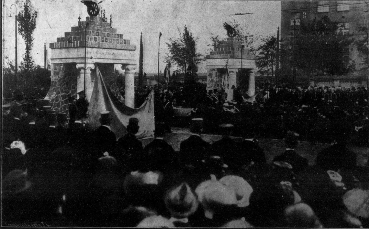
1. El nuevo ejército alemán: Inspección del equipo de un soldado antes del ejercicio.—2. Monumento a los ferroviarios alemanes que acaba de ser inaugurado en Berlín.