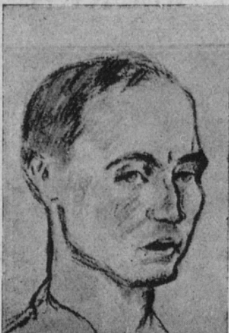
BERNABEU, delantero del M. F. C.