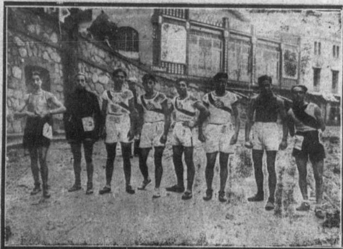
Grupo de los corredores.