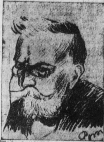
Don Angel Guimerá

El problema sentimental que se plantea en el drama igual puede plantearse en Estambul que en Vitigudino. Ahora, que Estambul posee mayores prestigios