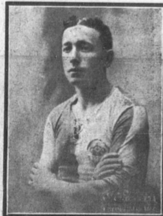
DIMAS. el famoso jugador del Vigo, conocido por el «Rey del «penalty»».