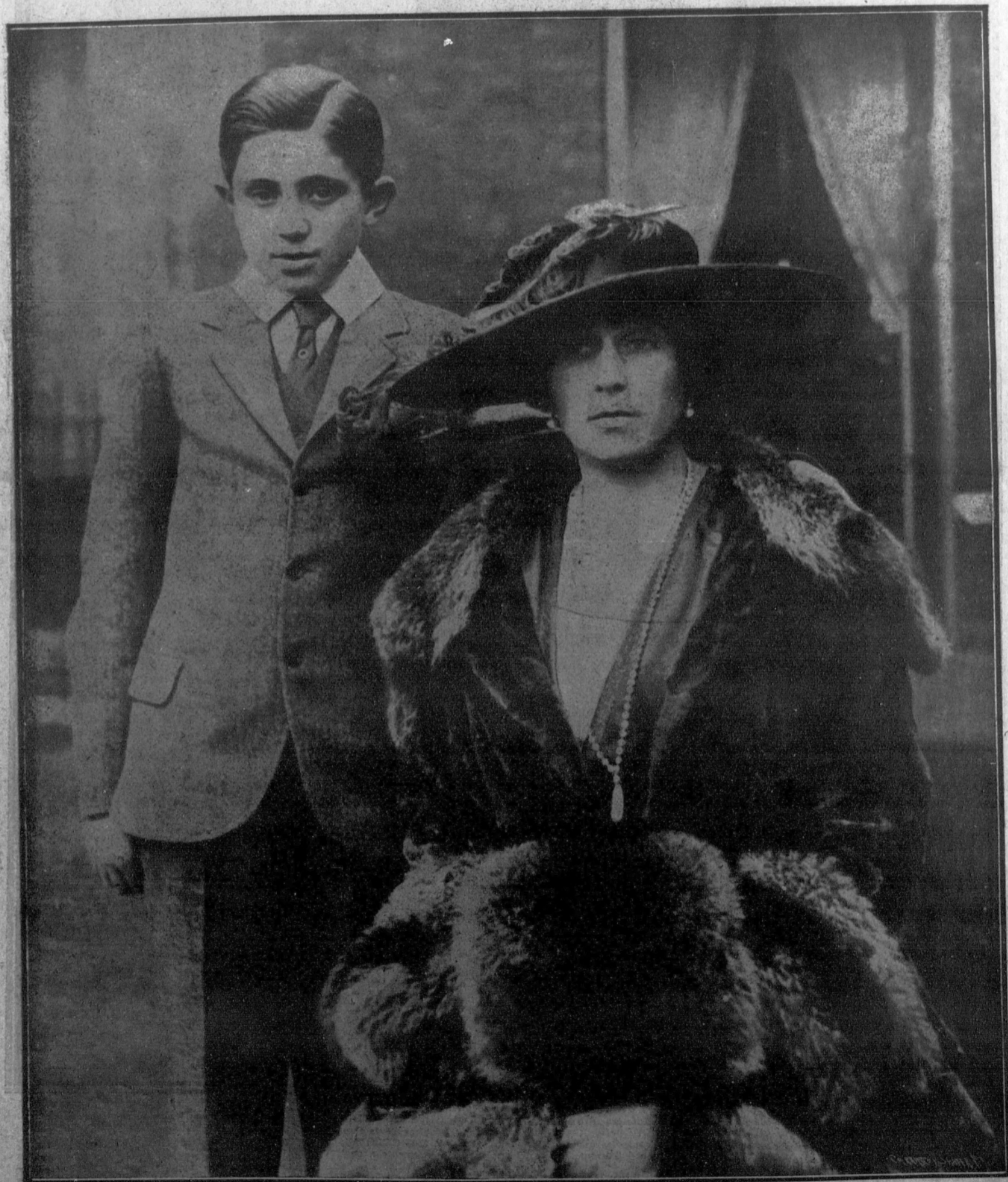
LONDRES.—Su Majestad la Reina doña Victoria y su hijo el Infante D. Jaime en el Palacio Kensington.