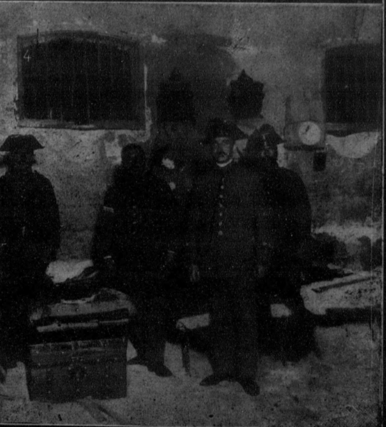
1. BARCELONA: «Kermesse» organizada por la Obra «Pro Infancia, Pro Patria» (El Sostén Francés).—2. MADRID: Una «escena del drama de Guimerà «El alma es mía», estrenada anoche en el teatro de la Princesa.—3. BARCELONA: Ceremonia celebrada en el altar de la Santa Cruz, de la iglesia de los Santos Justo y Pastor, para elevar a testamento sacramental la última voluntad de dos consortes que fallecieron sin testar.—4. BARCELONA: Ventanas donde fueron colocados dos petardos, en la cochera de los tranvías del Torrente de las Flores, hiriendo levemente a cuatro guardias civiles.