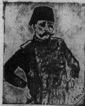
Fernando Díaz de Mendoza

y da a los poemas dramáticos como este que nos ocupa un agradable matiz de orientalismo, que, por lo que se ve, es una alta manifestación del arte... aun en los días que corren.