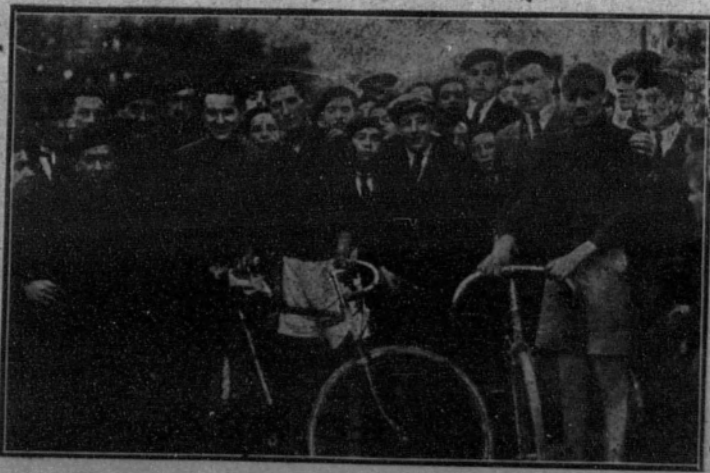
Los ganadores de la carrera ciclista organizada por el Club Fortuna.