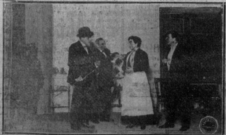
Una escena de "La red", de López Pinillos, que se estrenará esta noche en el Odeón