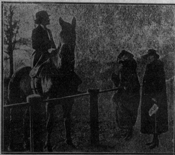
En el Rotten Row de Hyde Park: Nuestra Soberana detiene a una elegante «sports-woman», amiga suya, para conversar con ella.