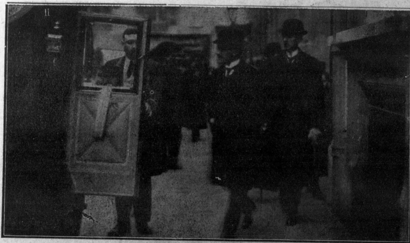
Los yugoeslavos han firmado el Tratado de paz.—El Príncipe Alejandro de Serbia durante su viaje a París.