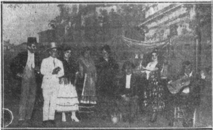
Una escena de "Granada mía" estrenada con éxito hace algunos días y original de los Sres. López Monís, O'Lein y Angel Barrios

La descripción de ambiente, de forma delicadísima en el primer cuadro, fué ovacionada con entusiasmo ayer. Un quinteto de murga